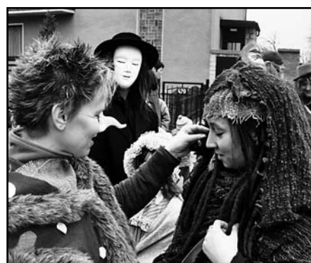
Masky se postupně scházely před kostelem ve Slivenci...následoval průvod masek Slivencem s četnými zastávkami...