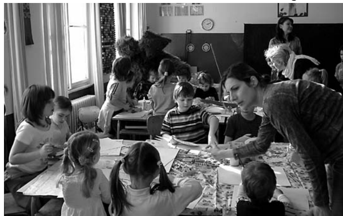
Na dílničkách děti vyráběly karnevalové masky.