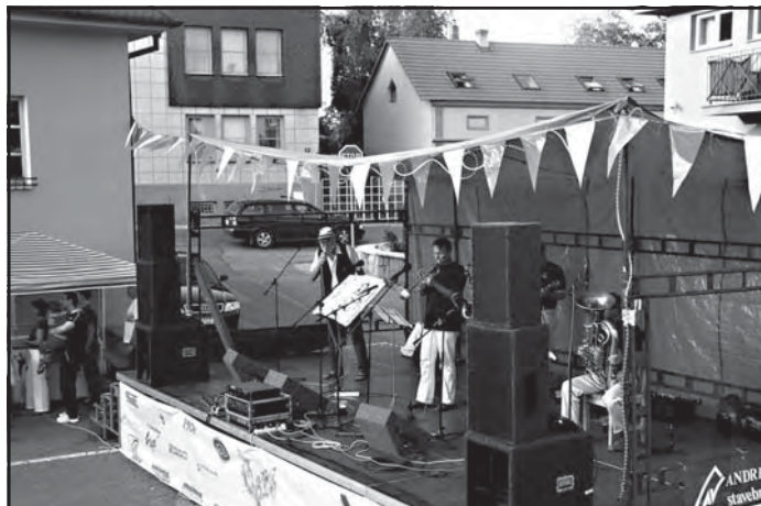
Koncert jazzové skupiny Bridge Band