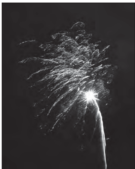
Závěr festivalu patřil ohňostroji