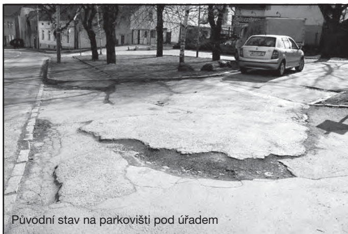
Původní stav na parkovišti pod úřadem