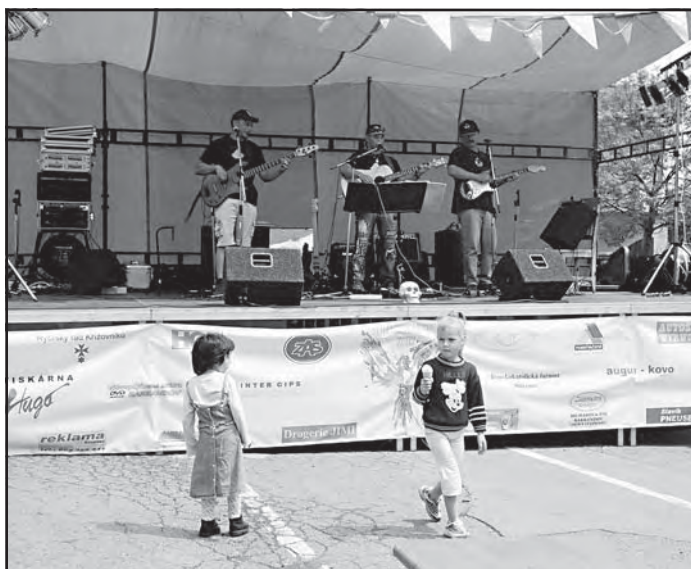
Kapela Neurol Band pobavila i děti