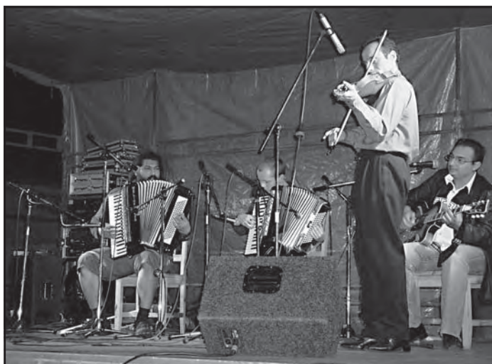
Kapela Mária Bihárho svými magickými cikánskými rytmy....