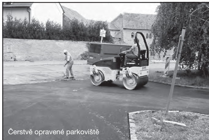
Čerstvě opravené parkoviště