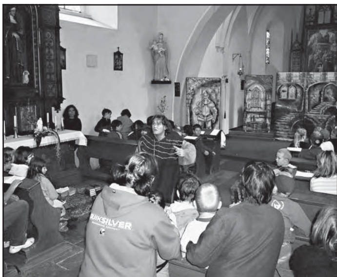
Představení fantasy hry Čarostřed (Divadlo F. Kreuzmanna) shlédly v kostele desítky malých diváků s doprovodem