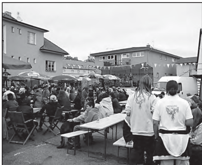
...které sledovaly stovky diváků...