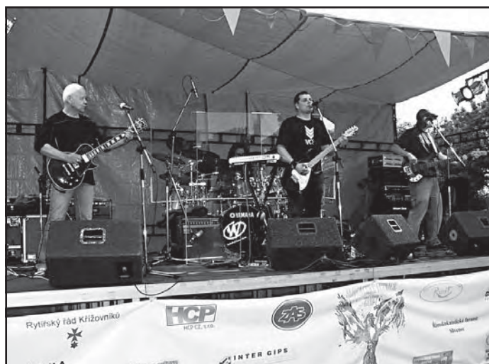
Vrcholem festivalu se stalo vystoupení legendární kapely Blue Effect s kytarovým mágem Radimem Hladíkem, ...