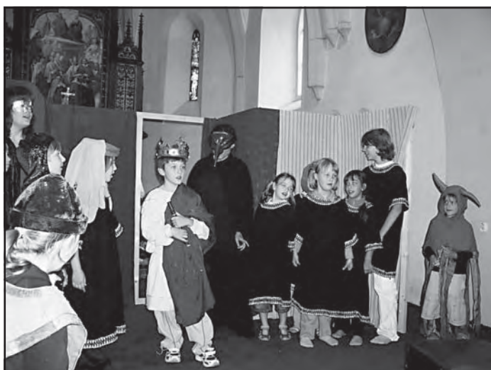
Děti z místního divadélka Šlyven předstoupily před publikum se hrou Kníže Václav