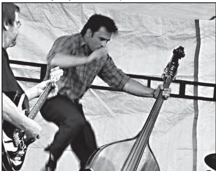
Highway 61 nadchli nejen muzikou, ale i akrobatickými kousky svého basisty