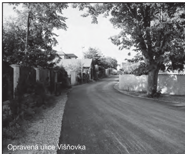
Opravená ulice Višňovka