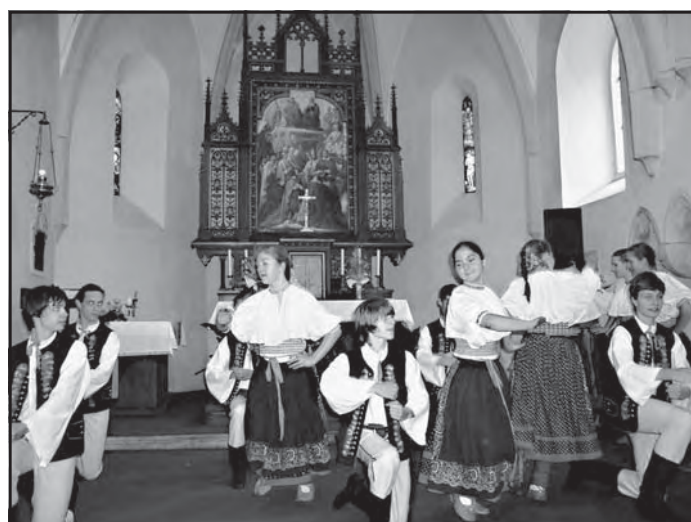
Taneční soubor Jaro nevystoupil kvůli nepřízní počasí v parku, ale musel ve vejít do kostelíku