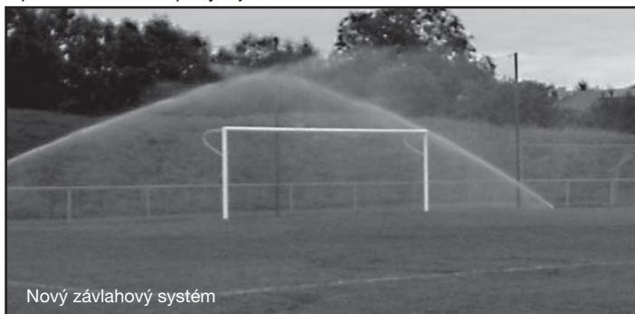
Nový závlahový systém

Přípravu na novou sezonu začala mužstva dospělých 24. 7. 2007. Fyzičku nabírali hráči výběhy do Chuchelského háje a následně do Lochkova, kde probíhala herní příprava. Slivenečské „áčko“ vstoupilo do nového soutěžního ročníku výhrou nad Cholupicemi 2:0, v dalších třech kolech ale mužstvo dobrý výkon nezopakovalo, hlavně neproměňování šancí nás stojí body, a proto se v tabulce pohybujeme kolem desátého místa.