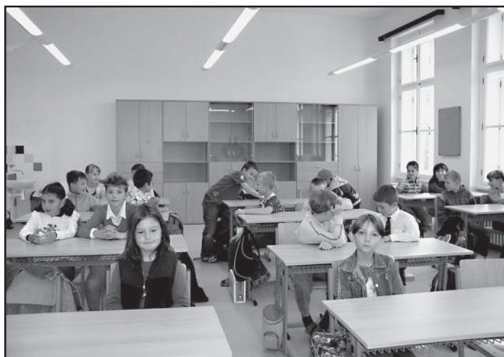
Nové jsou i veškeré elektroinstalace, takže ve třídách i na chodbách je nyní dostatečné osvětlení. Čtyři třídy získaly nový nábytek.