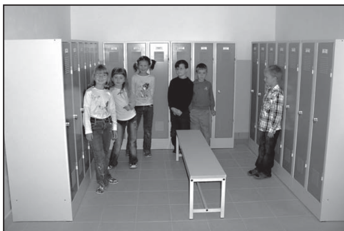
Velkým přínosem jsou nové šatny, které se rozšířily do místnosti bývalé dílny.

Pevně doufáme, že se dětem i učitelům bude v nově opravené budově dobře učit i pracovat.