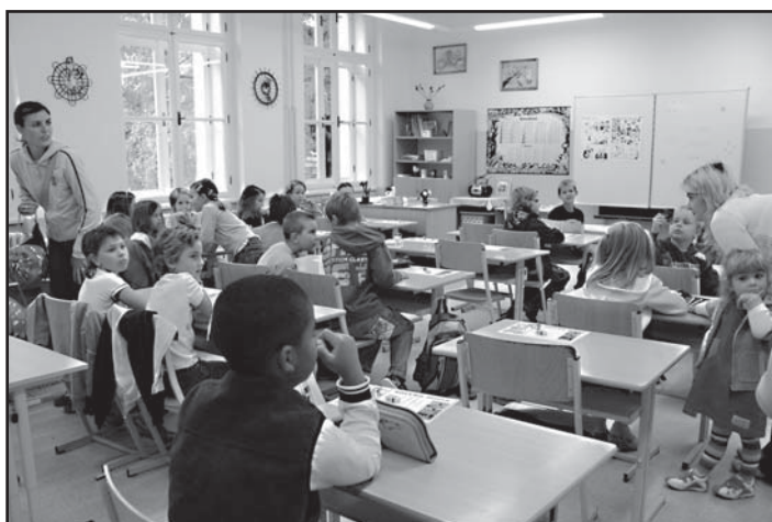
Všechny třídy mají nové tabule, na které lze psát křídou i fixy.