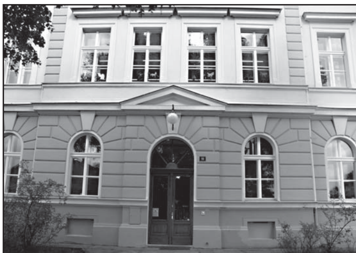
Škola má nová dřevěná špaletová okna a pěkné nové dubové dveře.

Během prázdnin prodělala historická budova školy výraznou rekonstrukci. Vyměnily se všechny stoupačky, rozvody vody i podlahy.