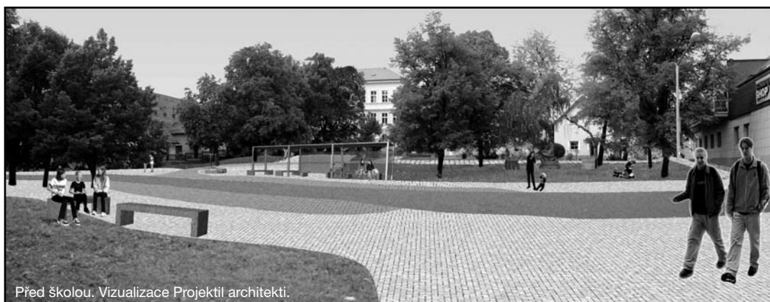
Před školou. Vizualizace Projektů architektů.

Projekt najdete na webových stránkách www.praha-slivenec.cz v sekci Aktuality. Do 20. 11. k němu můžete dávat připomínky.