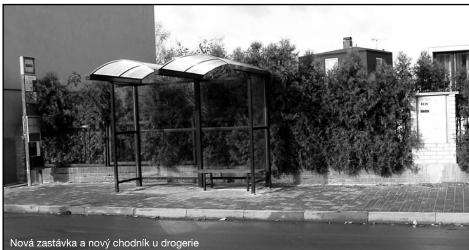
Nová zastávka a nový chodník u drogerie