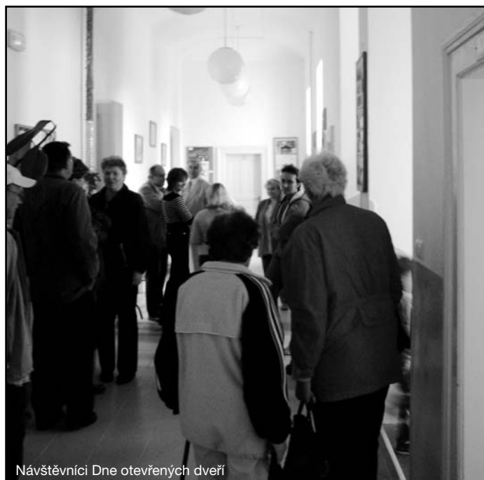
Návštěvníci Dne otevřených dveří