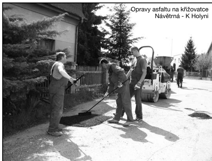
Opravy asfaltu na křižovatce Návětrná - K Holyni