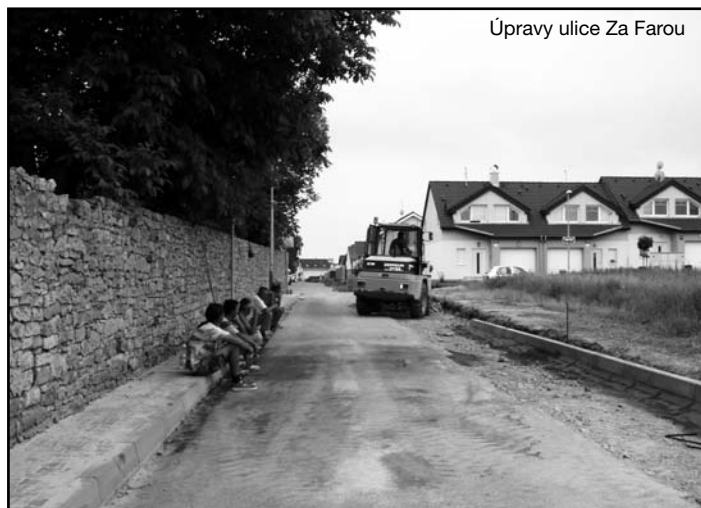
Úpravy ulice Za Farou