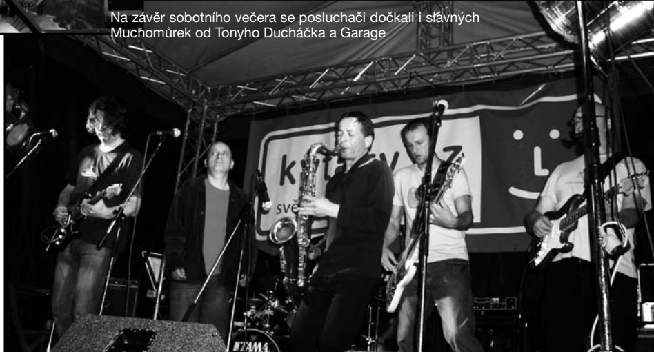
Na závěr sobotního večera se posluchači dočkali i slavných Muchomůrek od Tonyho Ducháčka a Garage