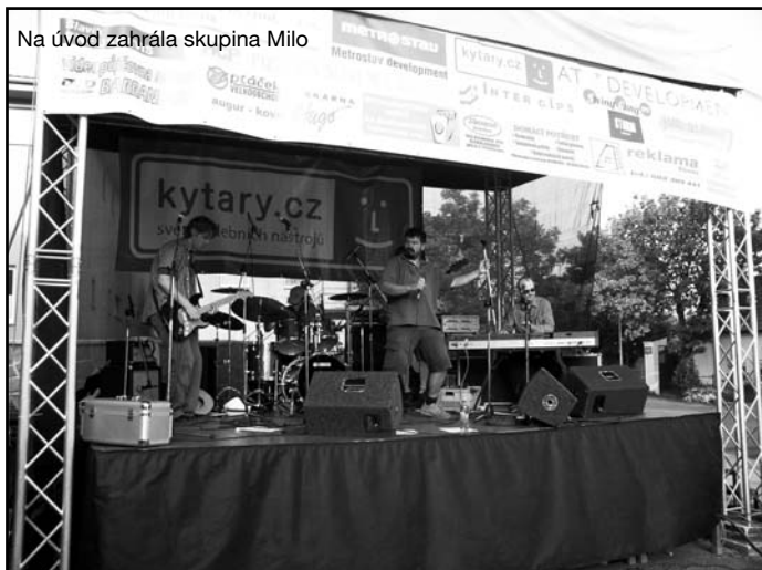
Na úvod zahrála skupina Milo