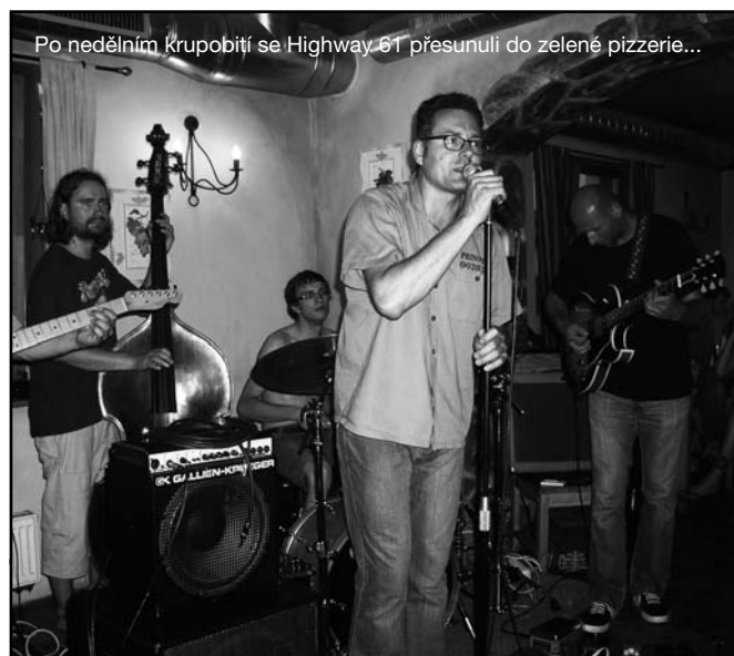
Po nedělním Krupobití se Highway 61 přesunuli do zelené pizzerie...