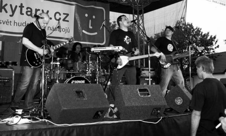
Legendární Blue Effect - hlavní magnet pátečního večera