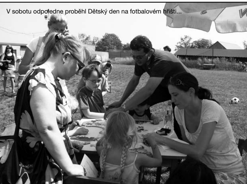
V sobotu odpoledne proběhl Dětský den na fotbalovém hřišti...