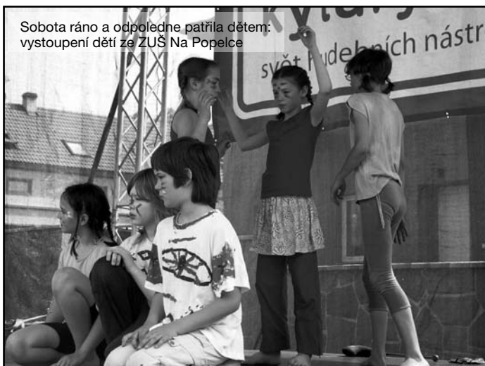
Sobota ráno a odpoledne patřila dětem: vystoupení dětí ze ZUŠ Na Popelce