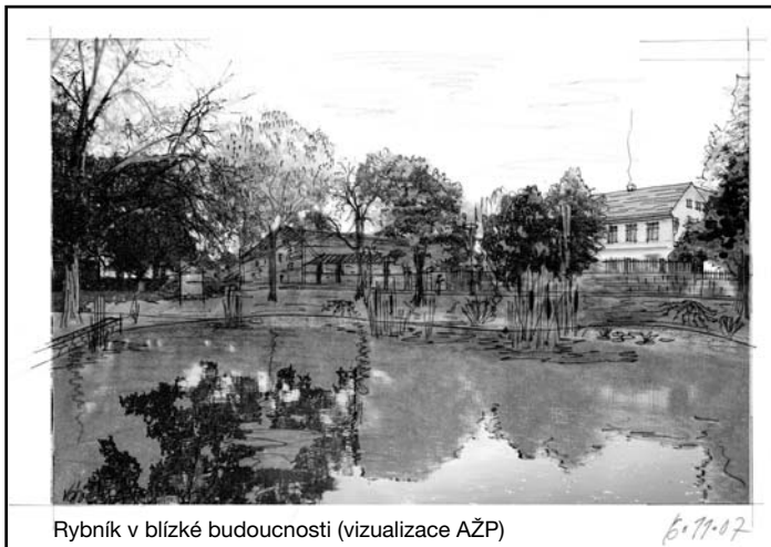
Rybník v blízké budoucnosti (vizualizace AŽP)