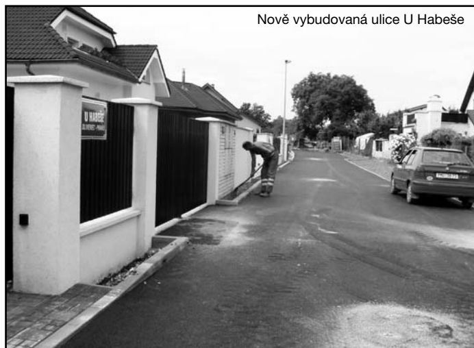
Nově vybudovaná ulice U Habeše