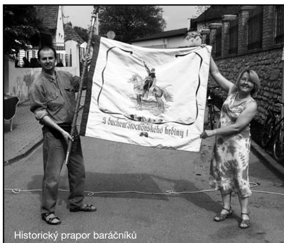
Historický prapor baráčníků

Poděkování za současný stav kaple patří zmiňovaným firmám, vedení obce, ale také četným nadšencům, kteří se snaží o to, aby kaple ožila, byla příjemným zastavením a vyhledávaným výletním cílem. Zvláštní poděkování patří firmě Mramor Sliveneč za sponzorský dar ve formě dodávky dlažby na podlahu kaple. Lenka Kudláková ■