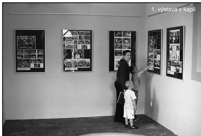
1. výstava v kapli