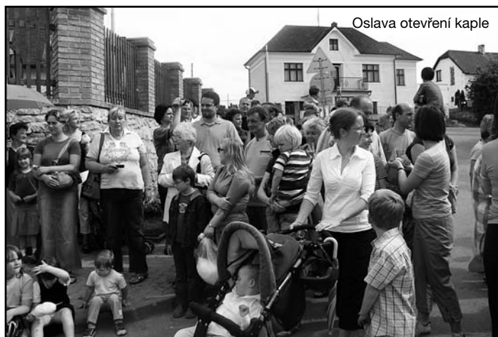
Oslava otevření kaple