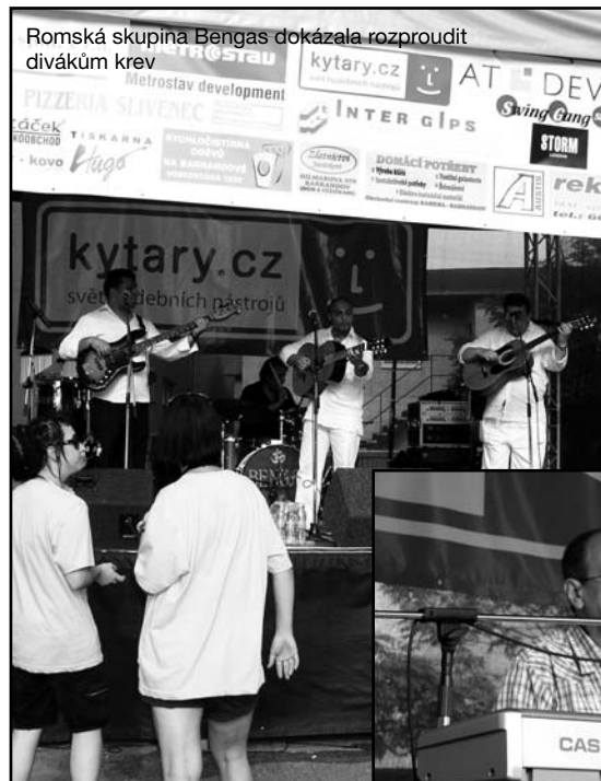
Romská skupina Bengas dokázala rozproudit divákům krev

svatého či Svatodušní svátky. Vztahuje se k seslání Ducha svatého na apoštoly po Ježíšově zmrtyvýchstání a slaví se 50 dnů po velikonočních a 10 dnů po Nanebevstoupení Páně. Liturgická barva letnic byly vždy červená, neboť slavnostní oděvy se ve starověku barvily purpurem. Dnes se ovšem velmi často užívá název Letnice jako synonymum pro „Slavnosti léta“ a v tomto smyslu je chápeme i my.