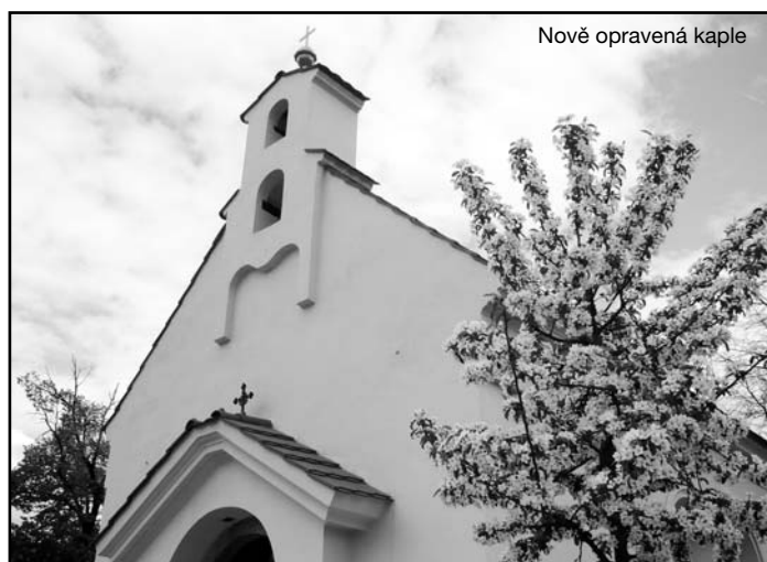
Nově opravená kaple