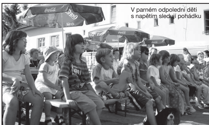
V parném odpolední děti s napětím sledují pohádku