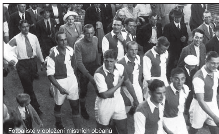
Fotbalisté v obležení místních občanů

Velkou událost bylo třeba oslavit tak, jak si toho vyžadoval její význam v análech obce i v celostátním měřítku. Byla tedy v neděli 14. srpna uspořádána slavnost, jejímž jádrem bylo fotbalové utkání SK. Slavie s Bicanem v čele versus místní fotbalový klub.