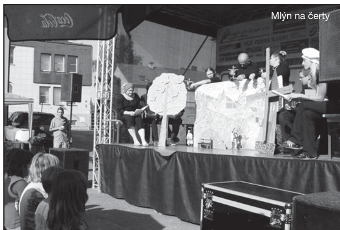
Mlýn na čerty