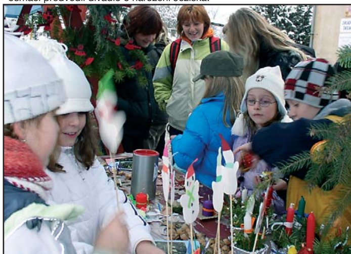
kde se prodávaly jejich výrobky, o které byl značný zájem.

■ vodárna ■ Praha a kanalizace ■ Czechpoint ■ kolumbárium ■ novinky ve škole ■ adventní akce ■ sázení stromků ■ hokej