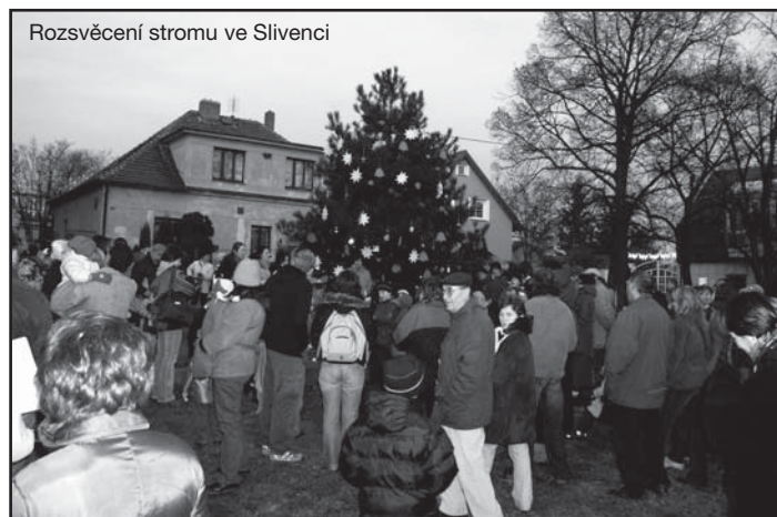
Rozsvěcení stromu ve Slivenci