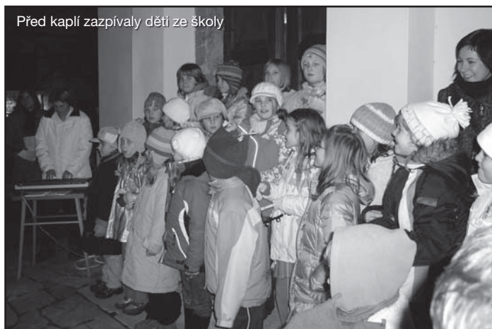
Před kaplí zazpívaly děti ze školy