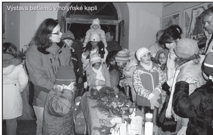
Výstava betlémů v holeňské kapli

Další fotografie z adventních akcí najdete na www.praha-sliveneč v rubrice Fotografie a články z akcí.