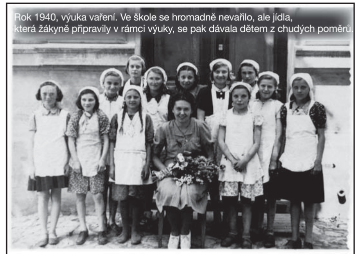
Rok 1940, výuka vaření. Ve škole se hromadně nevařilo, ale jídla, která žákyně připravily v rámci výuky, se pak dávala dětem z chudých poměrů