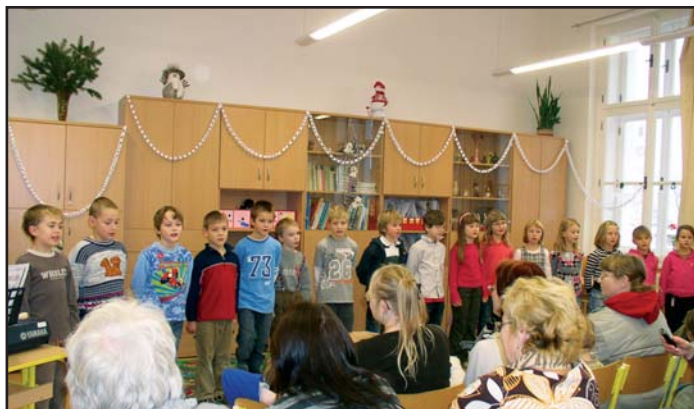
druháci překvapili perfektně secvičeným recitačně-hudebním pásmem.