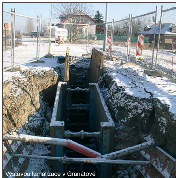
Výstavba kanalizace v Granátové