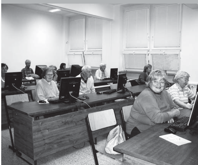
Po celý podzim se mohli senioři opět zúčastnit počítačového kursu. Zájem byl značný.

Srdečně blahopřejeme našim občanům, kteří v měsíci lednu, únoru a březnu 2009 oslavili nebo oslaví významné životní jubileum