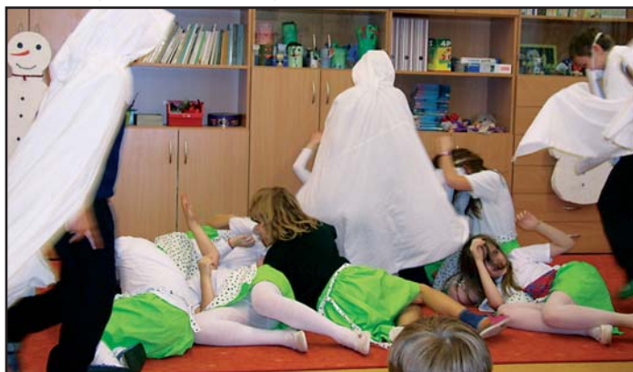
Třetí třída nadchla pestrým komponovaným pořadem o Vánocích,