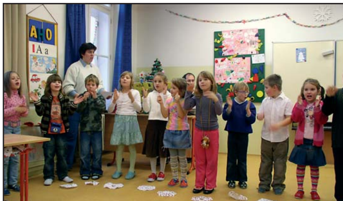
Zatímco vystoupení prvňáčků bylo roztomilé,

Dne 12. prosince uspořádala naše Základní a mateřská škola vlastní vánoční jarmark. Nejprve si každá třída připravila program ve své učebně.