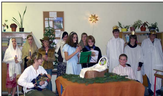
osmáci předvedli divadlo o narození Ježíška.