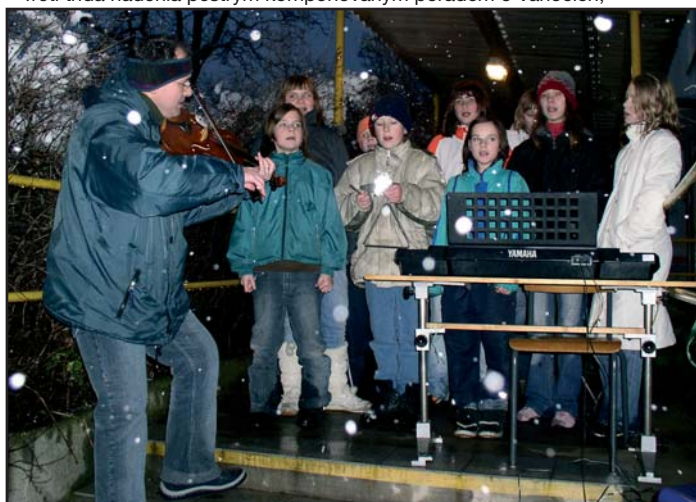
Žáci zahráli a zazpívali za hustého sněžení i na nádvoří,