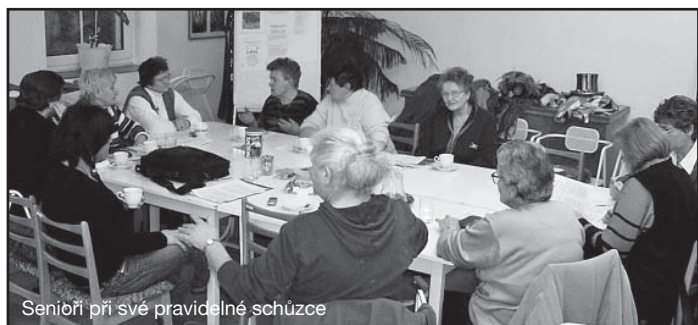
Seniři při své pravidelné schůzce