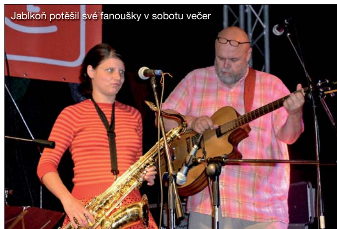
Jablkoň potěšil své fanoušky v sobotu večer