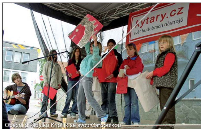
Obecní divadlo Kňoflík se svou Carpoolkou