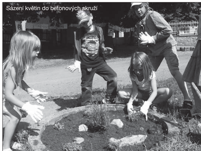
Sázení květin do betonových skruží

V naší škole jsme vytvořili tzv. Ekotým složený ze žáků 2. stupně, který plní úkoly zasláné v rámci tohoto projektu. Ve druhé polovině června proběhlo sázení květin do veřejných prostor před školou, děti měřily kvalitu vody a zapojily se do projektu Bezpečné cesty do škol. Tento projekt přinesl naší městské části finanční prostředky na vypracování projektových studií. Žáci všech ročníků společně se svými rodiči vytypovali místa, která se z jejich pohledu zdají být nebezpečnými při cestě do nebo ze školy. Poté si místa označili ve vlastních pláncích naší městské části. Nad plánky se sešly nejprve jednotlivé třídy, poté celá škola, a tak vznikla společná mapa s vyznačením nebezpečných míst, která byla slavnostně předána projektantovi k prostudování. Předání mapy proběhlo za přítomnosti celé školy, zástupců odboru dopravy MHMP, Policie ČR, dopravního inženýra, občanského sdružení Oživení, zřizovatele školy a médií ve středu 24. 6. 2009 v tělocvičně naší školy. Žáci 7. ročníku si připravili vlastní Power Pointovou prezentaci, pomocí níž účastníci seznámili se závěry průzkumu. Mapy naší městské části s vyznačením a popisem nebezpečných míst budou sloužit jako podklad pro zpracování studií vhodných pro řešení těchto situací. V rámci tohoto projektu rovněž získáme finanční prostředky na vybavení prostor školy.