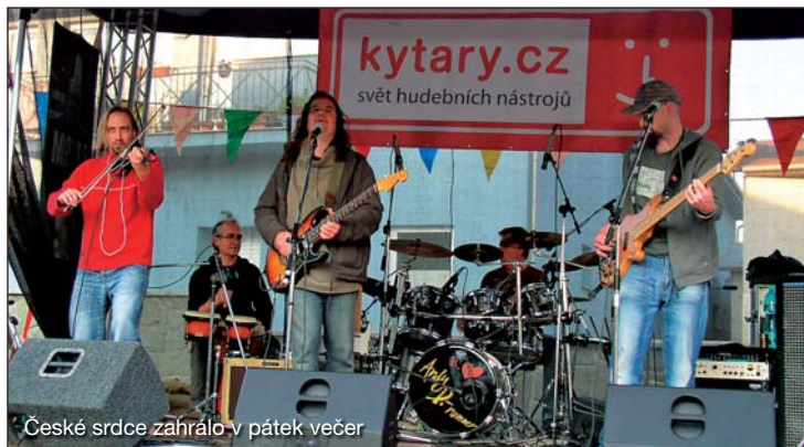
České srdce zahrálo v pátek večer

Ti nejskalnější, co vytrvali, měli možnost sledovat hudebně pestrý maraton hudby a doposlouchat se k oběma večerním vrcholům. Jedním z vrcholů byl páteční koncert skupiny České Srdce a vystoupení tradiční stálice Letnic - Blue Effectu s Radimem Hladíkem. Sobotním zlatým hřebem programu se stalo vystoupení Jaroslava Hutky a jablkonění souboru Jablkoň, které tryskalo hudebními nápady téměř stejně jako barevný gejzír ohňostroje, který se vzápětí snesl