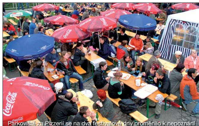
Parkoviště za Pizzerií se na dva festivalové dny proměnilo k nepoznání