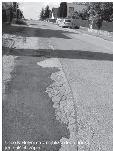
Ulice K Holyni se v nejbližší době dočká jen dalších záplat.