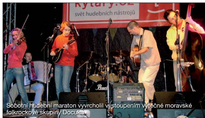
Sobotní hudební maraton vyvrcholil vystoupením výtečné moravské folkrockové skupiny Docuku