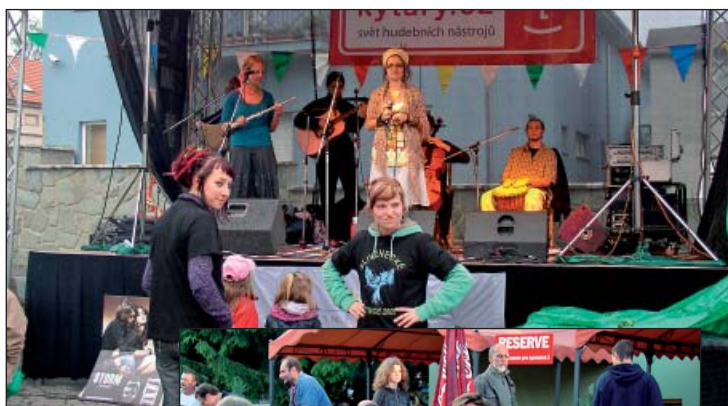
▲ Etnokapela Džezvica roztančila (skoro) každého