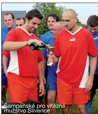
Šampaňské pro vítězné mužstvo Slivence