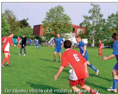
Do zápasu vložila obě mužstva veškeré síly