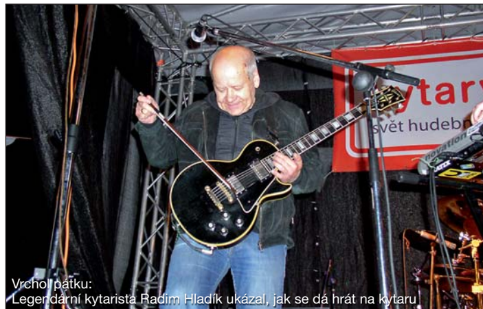
Vrchol pátku: Legendární kytarista Radim Hladík ukázal, jak se dá hrát na kytaru