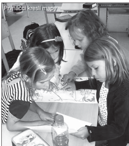
Prvňáčci kreslí mapy

dovolte nám, abychom shrnuli nové zkušenosti ve vedení naší základní a mateřské školy. První školní rok pod novým vedením školy přinesl pro všechny zaměstnance školy i pro žáky a jejich rodiče mnoho nového. Každý, kdo se o vzdělávání v této pražské části zajímá, měl a má jistá očekávání. Svá očekávání mělo i nové vedení školy a všichni učitelé i žáci. Co tedy tento školní rok přinesl? Co bylo jeho hlavním přínosem? Naplnilo se očekávání? A jak se bude ve škole pracovat dál? To jsou nejčastější otázky, na něž je zapotřebí hledat odpověď, a to nejen pro potřebu sebereflexe pracovníků a žáků školy, ale především pro to, aby došlo k porozumění ze strany rodičů žáků a širší nepedagogické veřejnosti.