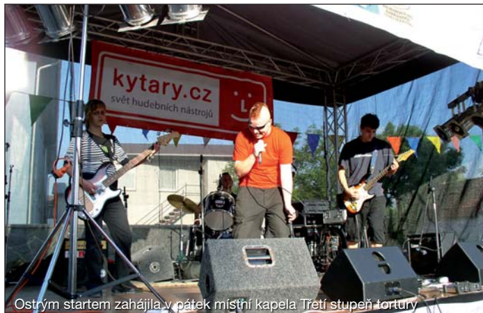
Ostrým startem zahájila v pátek místní kapela Třetí stupeň tortury