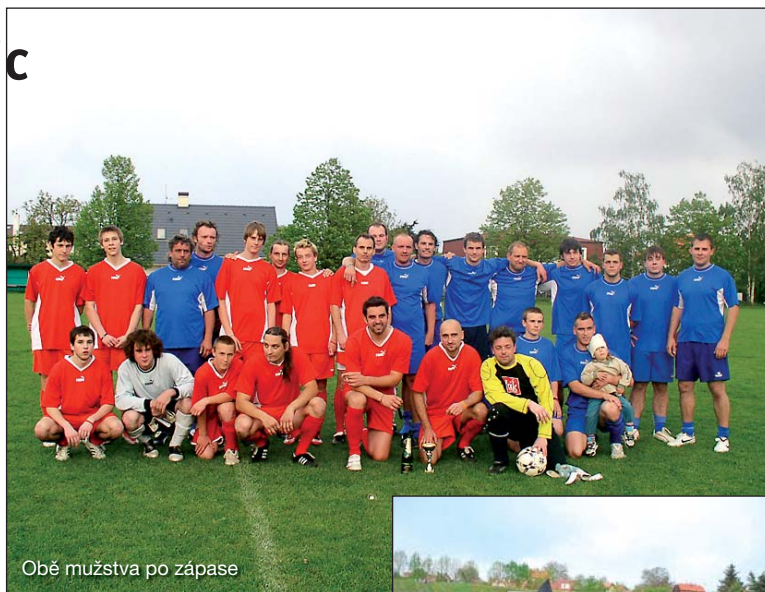
Obě mužstva po zápase