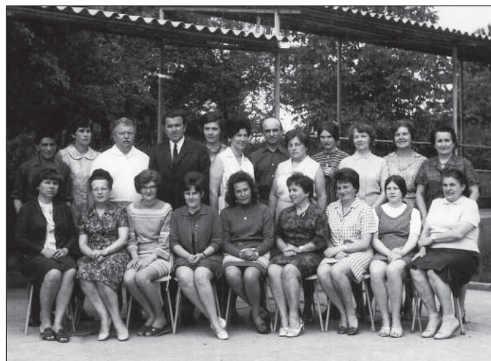
Učitelství v roce 1970