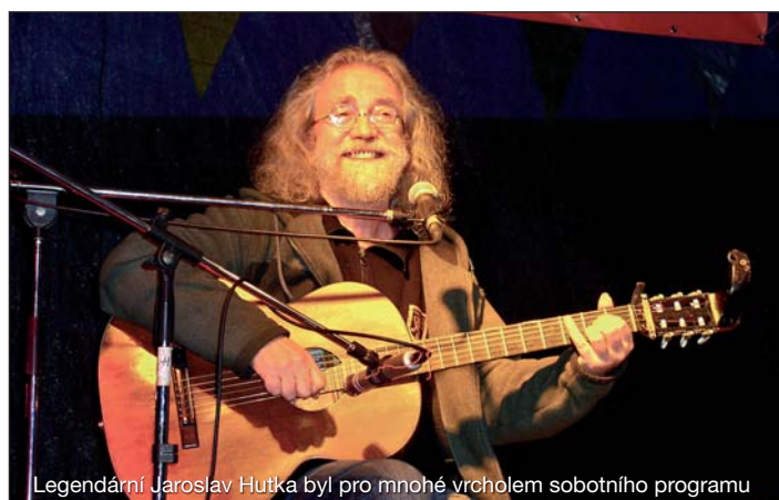
Legendární Jaroslav Hutka byl pro mnohé vrcholem sobotního programu

■ dešťová kanalizace ■ oprava školy ■ výsledky voleb ■ ■ vyhodnocení dotazníku ■ AFK Slivenec ■ Centrum Pecka ■