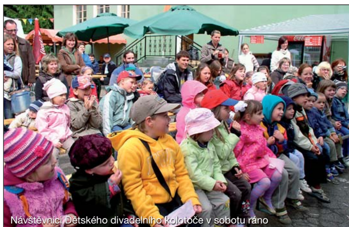
Navštěvníci Dětského divadelního kolotoče v sobotu ráno