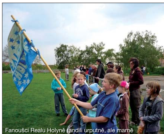
Fanoušci Realu Holyně fandili urputně, ale marně