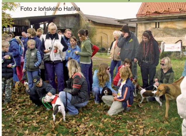
Foto z loňského Hafíka

Odměny pro závodníky všech kategorií. Občerstvení pro doprovod zajištěno. Podmínkou účasti je platný očkovací průkaz. Z přehlídky jsou vyloučeny hárající a březí feny, vstup zakázán nemocným zvířatům. Kousaví jedinci musí mít košík a vystavovatelé mladší 18 let musí mít dospělého doprovod. Těšíme se na soutěžící i nadšené diváky!!!