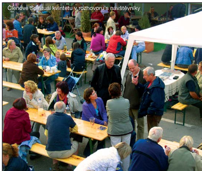
Členové Spirituál kvintetu v rozhovoru s návštěvníky