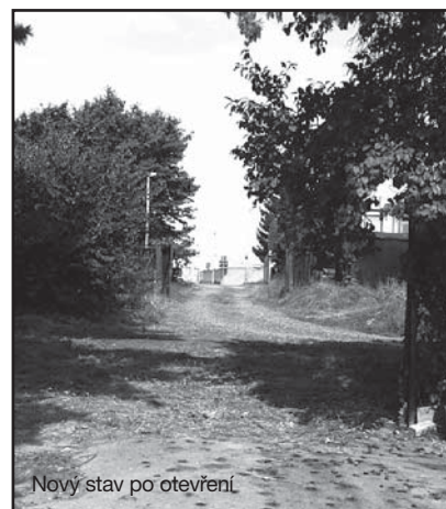
Nový stav po otevření