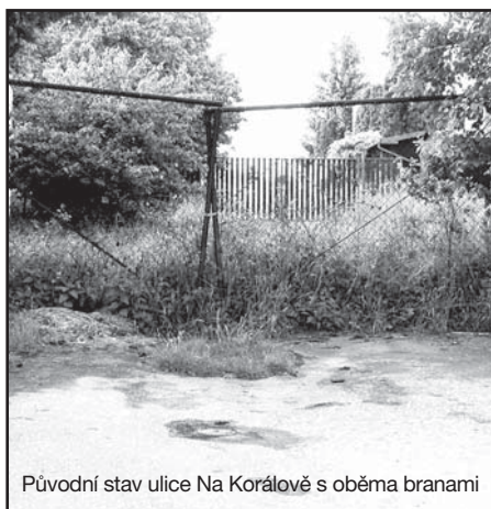
Původní stav ulice Na Korálově s oběma branami

Jak si již možná mnozí všimli, došlo před nedávnem k otevření komunikací Na Korálově a Za Křížkem, do kterých nebyl vstup po léta umožněn díky nainstalovaným branám. Všechny brány zde byly instalovány neoprávněně, protože jde o komunikace zařazené do běžné sítě místních ulic a tyto komunikace, byť jsou v soukromém majetku, není možné jen tak zaplotit. V praxi bývá cesta k vynucení práva někdy poněkud klikatá, ale ve spolupráci s odborem dopravy a životního prostředí Prahy 5 se dobrá věc nakonec podařila. V nejbližší době zde ÚMČ Praha 5 ve spolupráci s Policií ČR stanoví režim dopravního značení a naše MČ tam posléze značky nainstaluje. Staronový majitel, tedy Filmový průmysl, s. p., v likvidaci, v současné době ulice spolu s dalšími pozemky v okolí prodává v dražbě. Pla ■