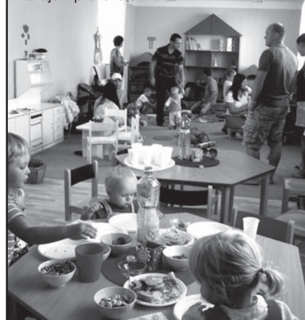
Zahájení provozu 31. 8.

dagoga, obě s dlouholetými zkušenostmi s předškolními dětmi. Maminky našich Sluníček nemusí být zaměstnané či splňovat jiná kritéria pro přijetí dětí, mohou dále pobírat rodičovský příspěvek. Rozvíjení dětské osobnosti není u nás realizováno nahodile, ale podle Rámcového programu pro předškolní vzdělávání. S dětmi pracujeme bez zbytečného spěchu, snažíme se o kamarádský přístup a celkovou pohodu. Důraz klademe na úzkou spolupráci s rodinou. Naší snahou je vytvořit školičku, do které by se děti ráno těšily a odpoledne nechtěly odcházet domů. Prosím, nepleťte si nás s hlídacím koutkem!“