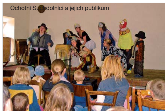
Ochotní Suchdolníci a jejich publikum