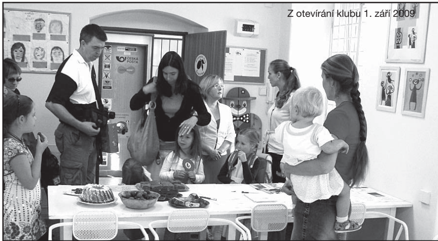
Z otevření klubu 1. září 2009

Začátkem letošního školního roku byl dnem otevřených dveří zahájen provoz v nově vzniklém Sliveneckém klubu Švestka v přízemí úřadu městské části. Klub bude sloužit Rodinnému centru Pecka, obecnímu divadélku Knoflík, seniorům a dalším plánovaným volnočasovým aktivitám v obci. Mimo pravidelný rozvrh lze též prostor (po domluvě) pronajmout pro dětské oslavy, besedy, kurzy. O klubových aktivitách se dočtete na nástěnkách (především na vývěsce naproti poště) a na webu obce. kud ■