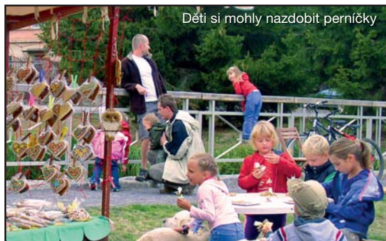
Děti si mohly nazdobit perníčky