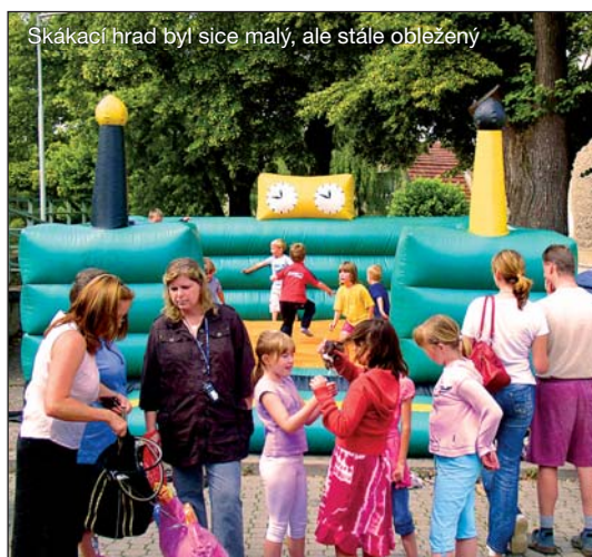
Skákací hrad byl sice malý, ale stále obležený