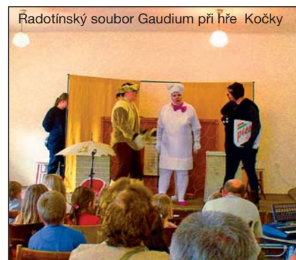
Radotínský soubor Gaudium při hře Kočky