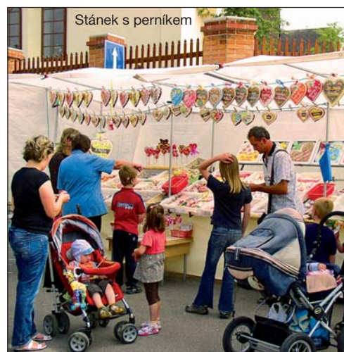
Stánek s perníkem

■ Slivenecký burčák ■ výstavba ■ nové hřiště ■ RC Pecka ■ novinky ze školy ■ mateřinka Sluníčko ■ kalendář akcí ■