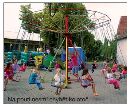
Na pouti nesmí chybět kolotoč