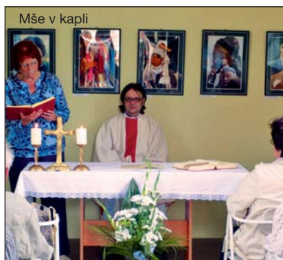
Mše v kapli