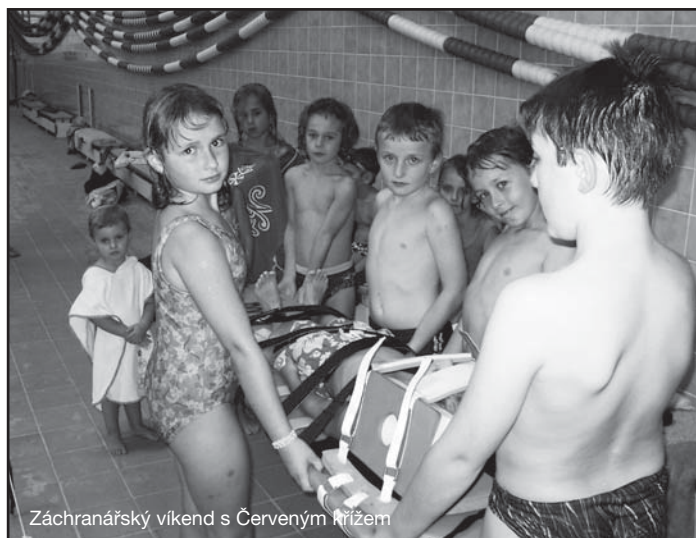
Záchranný víkend s Červeným křížem