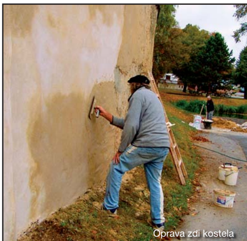
Oprava zdi kostela