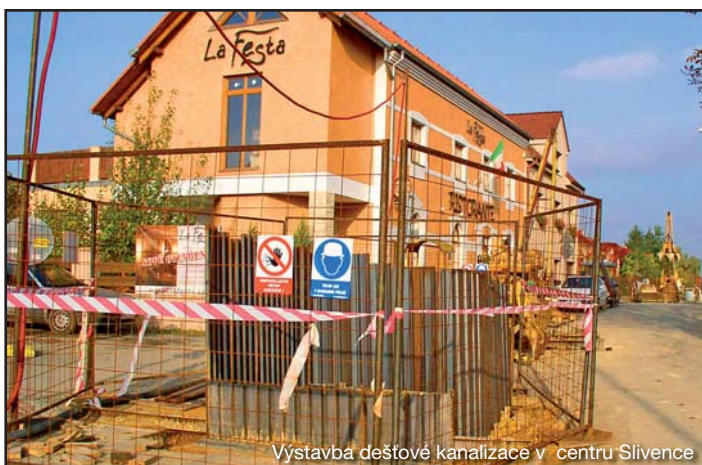
Výstavba dešťové kanalizace v centru Slivence