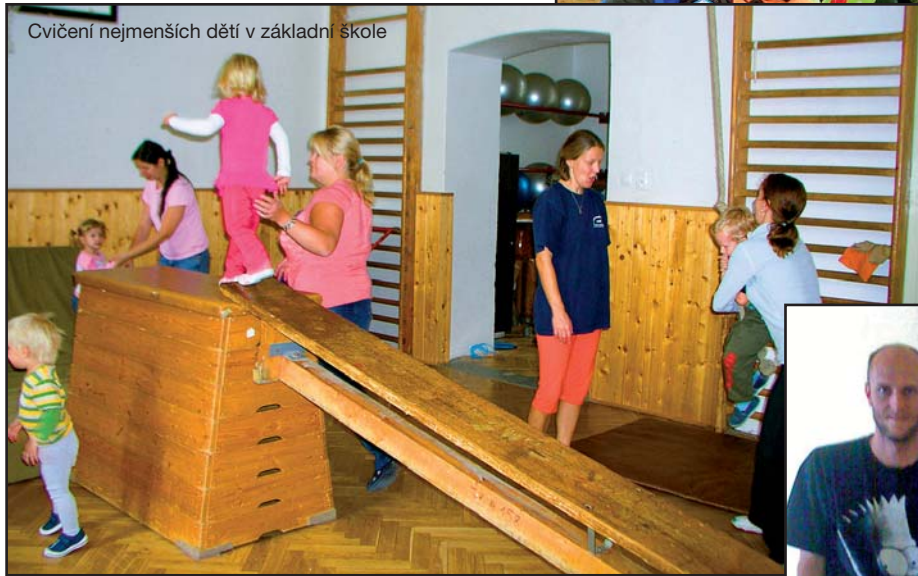
Cvičení nejmenších dětí v základní škole