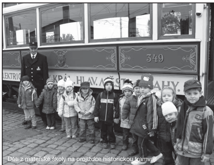
Děti z mateřské školy na projíždce historickou tramvají