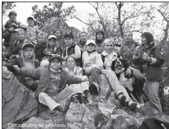
Děti z družiny na přechodu Brd