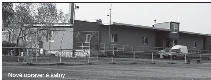
Nově opravené šatny

RC Pecka srdečně zve na předvánoční dílnu pro celou rodinu