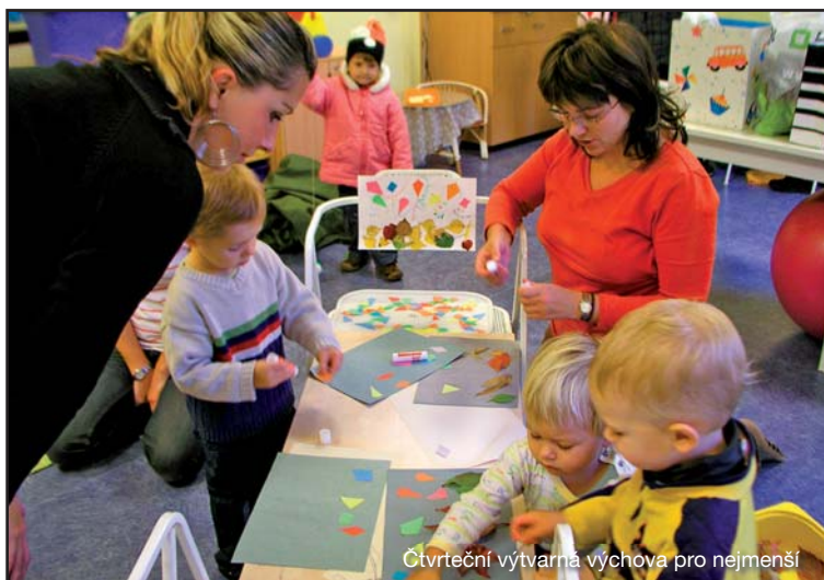
Čtvrteční výtvarná výchova pro nejmenší