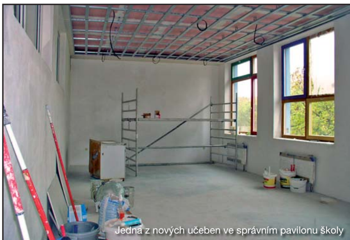
Jedna z nových učeben ve správním pavilonu školy