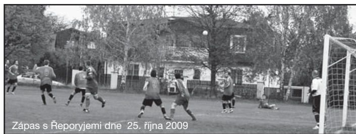
Zápas s Řeporyjemi dne 25. října 2009

V rozběhnuté podzimní soutěži ale moc spokojenosti v oddíle není. Všechna mužstva, která máme v soutěžích, si nevedou moc dobře a pohybují se ve spodních patrech tabulky. Zvláště umístění našeho „áčka“ nás překvapuje. Čekalo se, že se bude pohybovat kolem 10. místa. Skutečností je však předposlední příčka a boj o záchranu v 1. A. třídě. Hráči jsou na tom špatně psychicky a to se projevuje v neproměňování vyložených šancí, které nás stojí body a lepší umístění