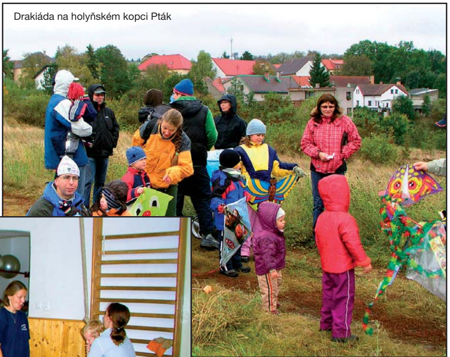
Drakiáda na holyňském kopci Pták