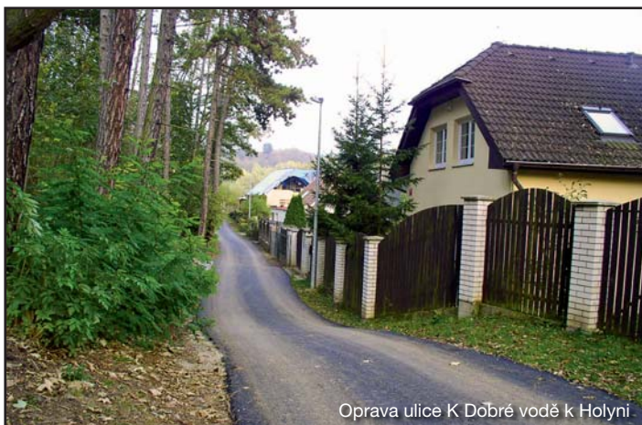
Oprava ulice K Dobré vodě k Holyni