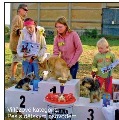
Vítězové kategorie „Pes s dětským psovodem“

Novinkou bylo tentokrát vyhodnocení nejmladšího psa, nejstaršího psa a psa „sympatáka“. Veselým zjištěním při závěrečném ceremoniálu bylo, že nejstaršího psa Jacka vodil nejmladší psovod.