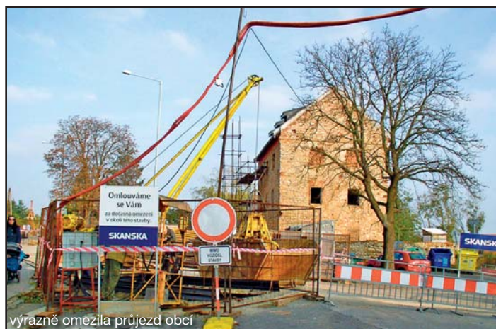
výrazně omezila průjezd obcí