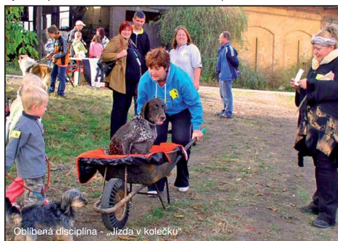
Oblíbená disciplína - „Jízda v kolečku“