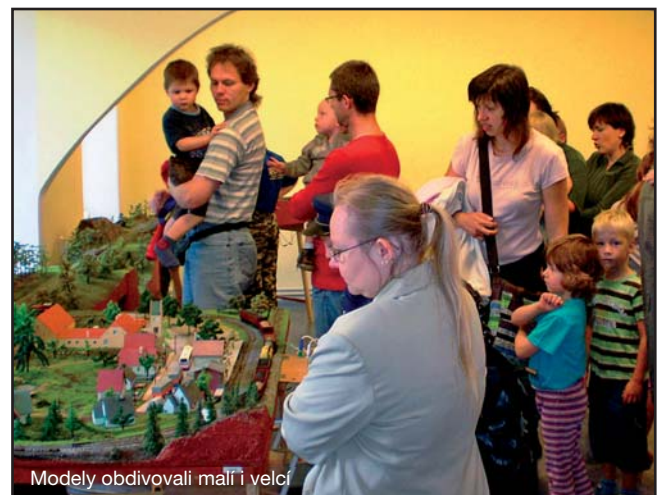
Modely obdivovali malí i velcí