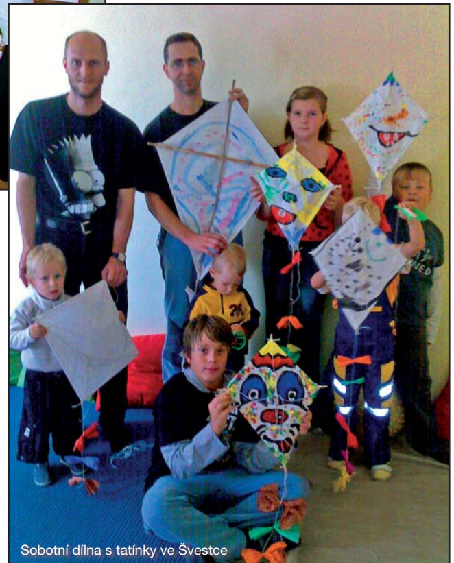
Sobotní dílna s tatínky ve Švestce