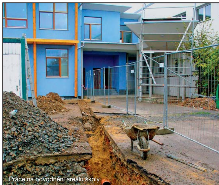
Práce na odvodnění areálu školy