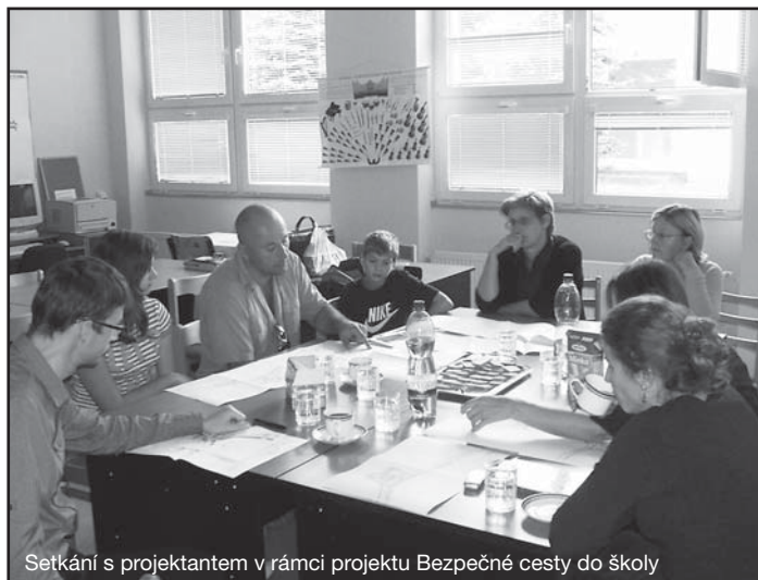
Setkání s projektantem v rámci projektu Bezpečné cesty do školy

Protože sociální potřeby jsou pro člověka v jakémkoli věku považovány za ty nejdůležitější, rozhodli jsme se společně s rodiči, že budeme usilovat o jejich pozitivní naplnění právě u žáků 5. ročníku. Prvním „domácím“ krokem bude dohlédnutí rodičů na to, aby děti nehovořily o druhých za použití vulgarismů a hrubých označení. První „školní“ krok proběhne na základě předem připravené diskuse