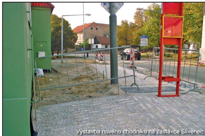
Výstavba nového chodníku na zastávce Slivenec