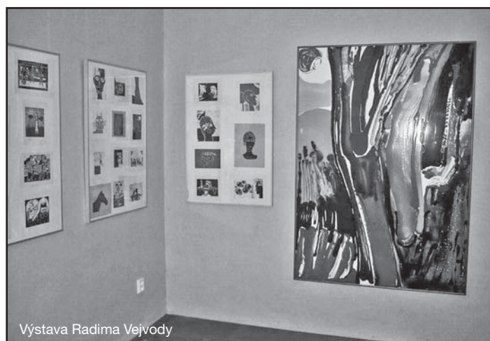
Výstava Radima Vejvody