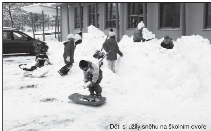
Děti si užily sněhu na školním dvoře