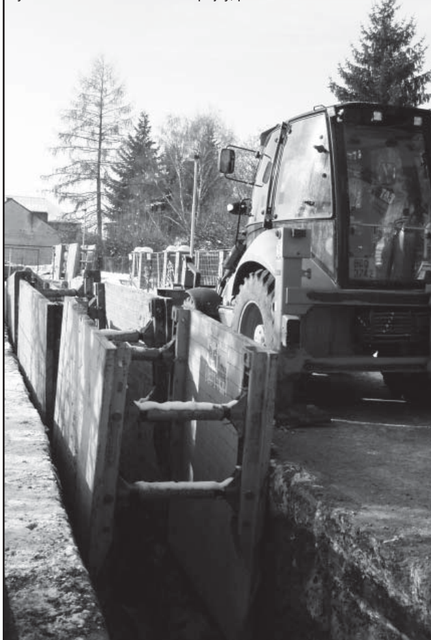
Výstavba kanalizace v ulici U Spojky, prosinec 2009

V případě zájmu o pronájem místností částečně zapuštěných pod terémem se informujte o podmínkách na ÚMČ Praha – Slivenec, Ing. Musilová, tel. 251 818 044. Vhodné využití: drobné služby pro obyvatele, dílna, sklad apod.