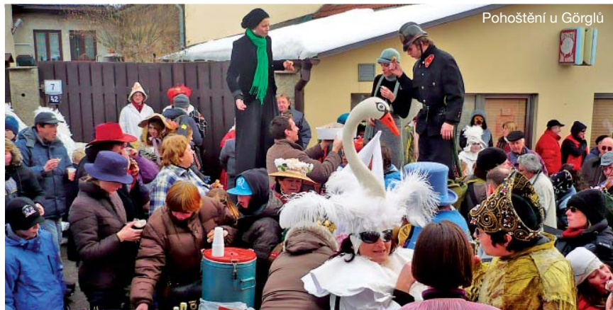
Pohoštění u Görglů