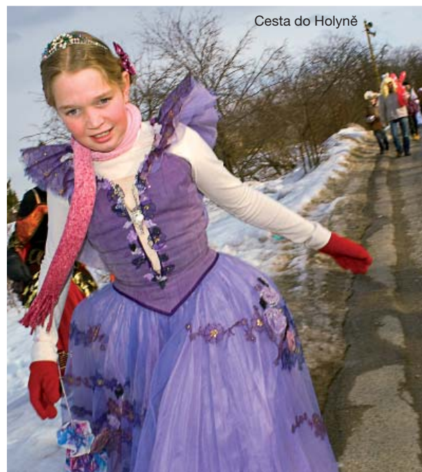
Cesta do Holyně