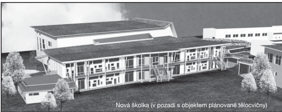
Nová školka (v pozadí s objektem plánované tělocvičny)

MČ Praha – Sliveneč již desítky let postrádá moderní mateřskou školku . Nová školka je v plánu již od 50. let 20. století, zůstalo ale jen u plánů. Po připojení Slivence k Praze v roce 1974 stouply naděje zdejších obyvatel na novou školku, ale až dosud nebyly naplněny. Situace se naopak značně zhoršila počátkem 90. let: v roce 1990 byla sice školka umístěná ve statku u Křížů (dnešní Schäfer Shop) rekonstruována, ale krátce poté byla budova školky se dvěma odděleními vrácena v restituci. Děti tak musely být provizorně přemístěny do jediného oddělení v budově bývalé kempeličky. Mělo jít o nouzové, provizorní řešení, ale toto provizorium už bohužel trvá od roku 1993, tedy 17 let.