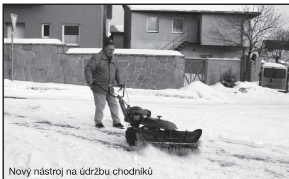
Nový nástroj na údržbu chodníků