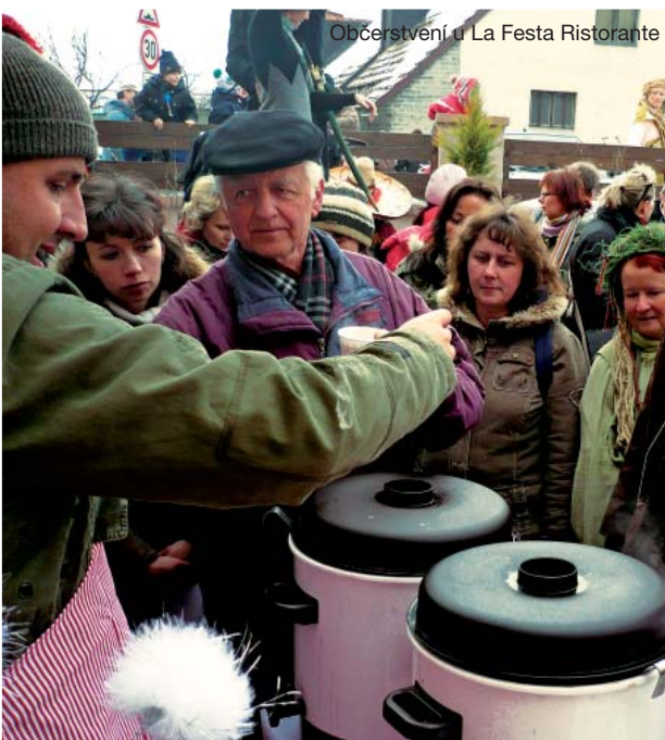
Občerstvení u La Festa Ristorante