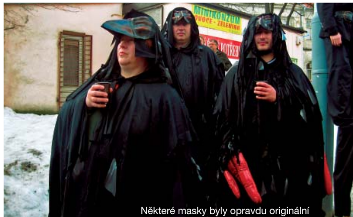
Některé masky byly opravdu originální