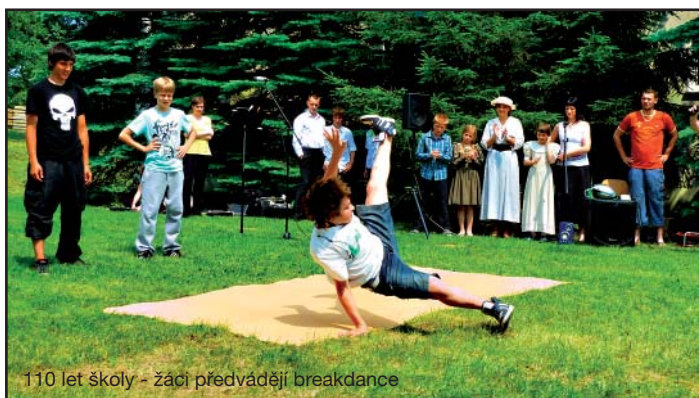
110 let školy - žáci předvádějí breakdance