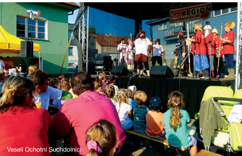
Veselí Ochotní Suchdolníci