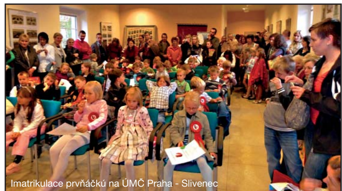
Imatrikulace prvňáčků na ÚMČ Praha - Sliveneč