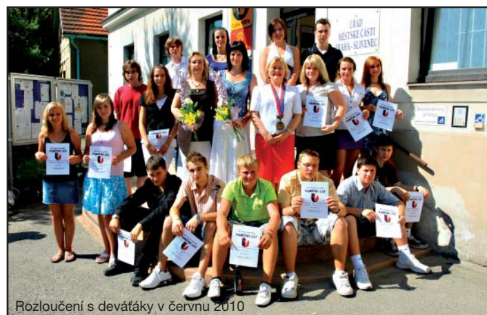
Rozloučení s devátáky v červnu 2010

Především jde o projektové vyučování založené na spolupráci starších