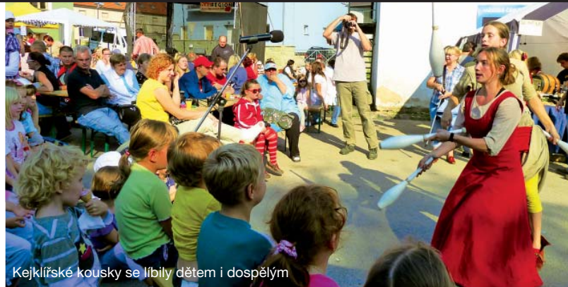
Kejklířské kousky se líbily dětem i dospělým