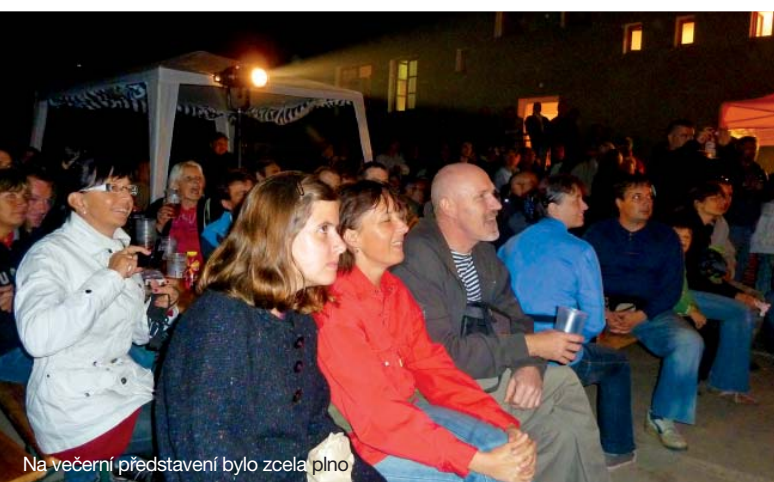
Na večerní představení bylo zcela plno