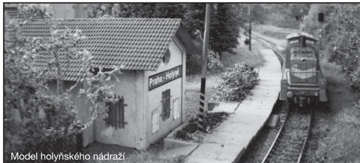
Model holyňského nádraží