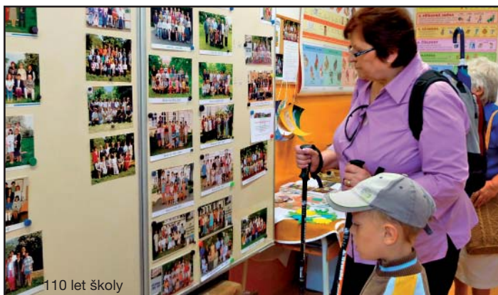
110 let školy