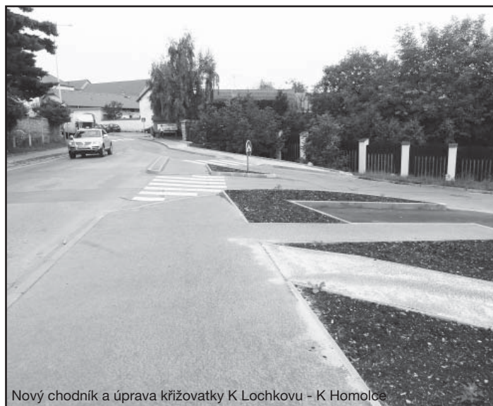
Nový chodník a úprava křižovatky K Lochkovu - K Homolce