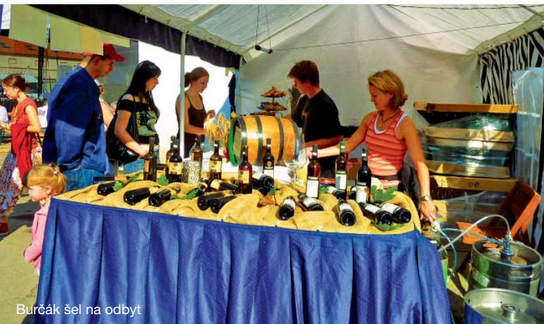
Burčák šel na odbyt