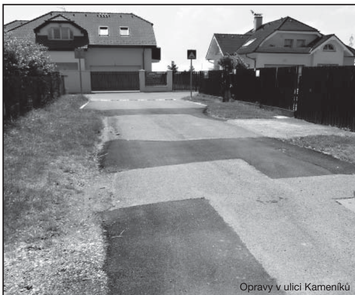
Opravy v ulici Kameník

Z původního záměru, pouze položit kvalitní povrch na stávající komunikaci, se během těch měsíců, po které už řízení běží, staly rozsáhlé a složité stavby. Snad se podaří je ještě letos dotáhnout do konce aspoň co se týče příslušných povolení, abychom je mohli napřesrok realizovat.