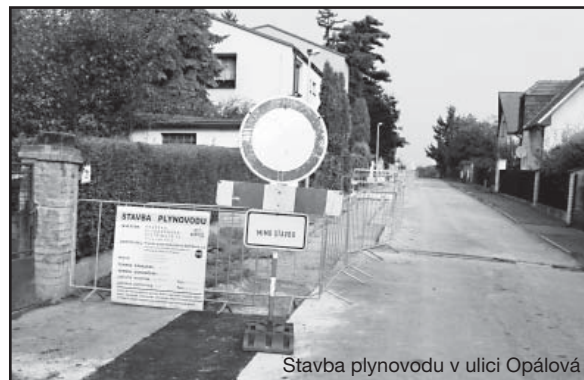
Stavba plynovodu v ulici Opálová

V září byla dokončena výstavba plynovodu v ulici Opálová. Během října společnost Pražská plynárenská dokončila výstavbu dalšího úseku. Plynem jsou nyní nově zásobováni i obyvatelé ulice K Homolce. V letošním roce to byla již poslední akce plynáren. V příštím roce bude probíhat poměrně rozsáhlá výstavba kanalizace a následně by se ve stejných lokalitách měl pokládat i plyn.