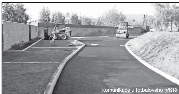
Komunikace u fotbalového hřiště

Obyvatelé zbylých lokalit se nemusí bát, že se na ně zapomnělo. Stavební povolení na zbývající úseky – Na Přídole (V Lipkách, Na Křemínku, Na Botě, Ve Smrčině, V Doubcích, Na Přídole), Na Korálově ( Na Bělci, Na Kraji, Na Korálově) a zbytek Habeše se již vyřizuje a příští rok se požádá o dotace na tyto části.