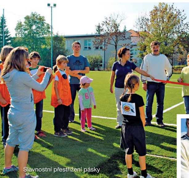
Slavnostní přestřižení pásky