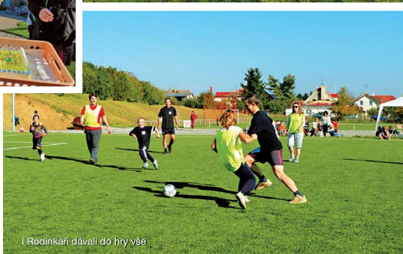
I Rodinkáři dávali do hry vše