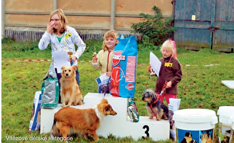
Vítězové dětské kategorie