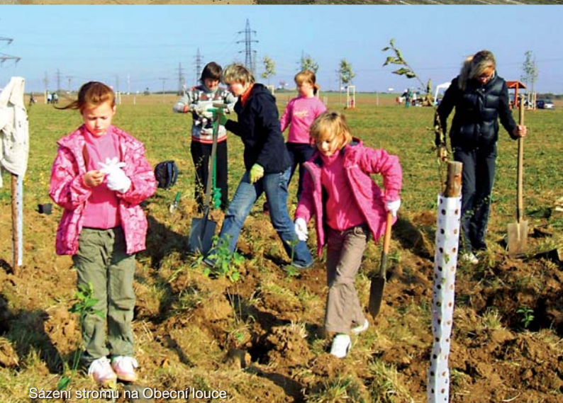
Sazení stromů na Obecní louce inzerce