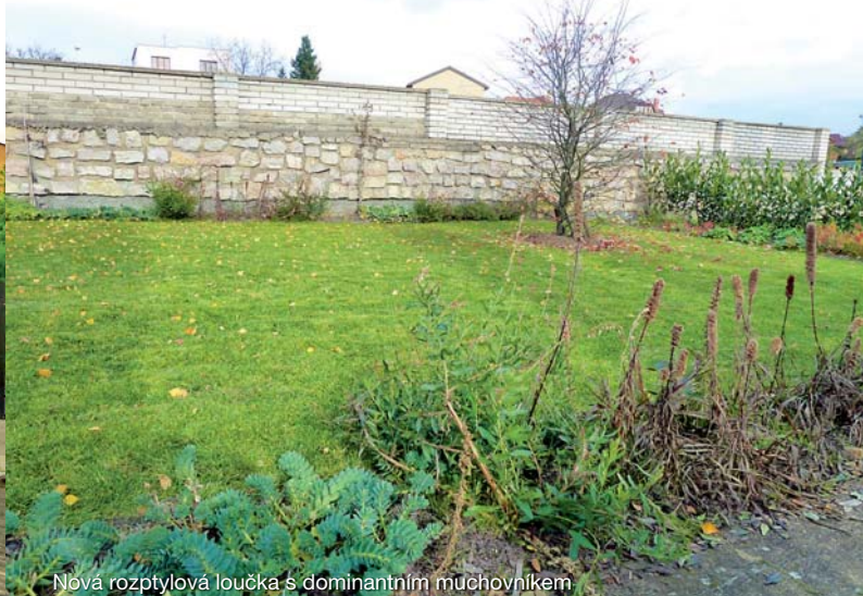
Nová rozptylová loučka s dominantním muchovníkem