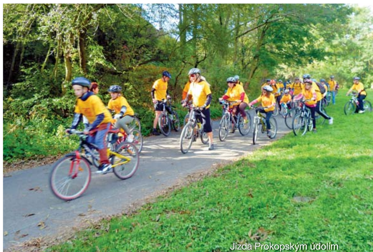
Jízda Prokopským údolím