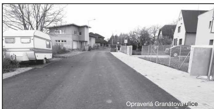
Opravená Granátová ulice