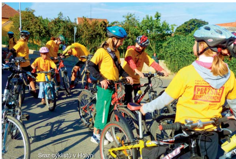
Sraz cyklistů v Holyni