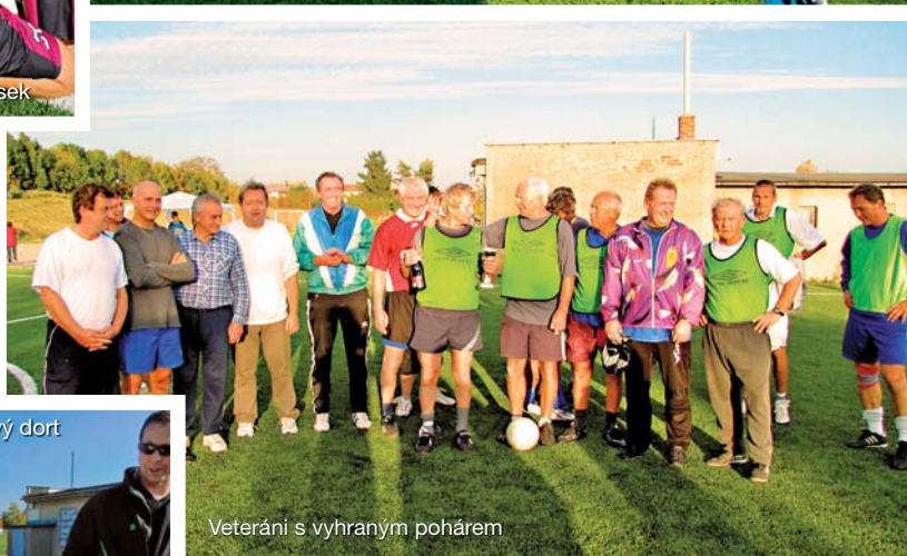
Veteráni s vyhraným pohárem