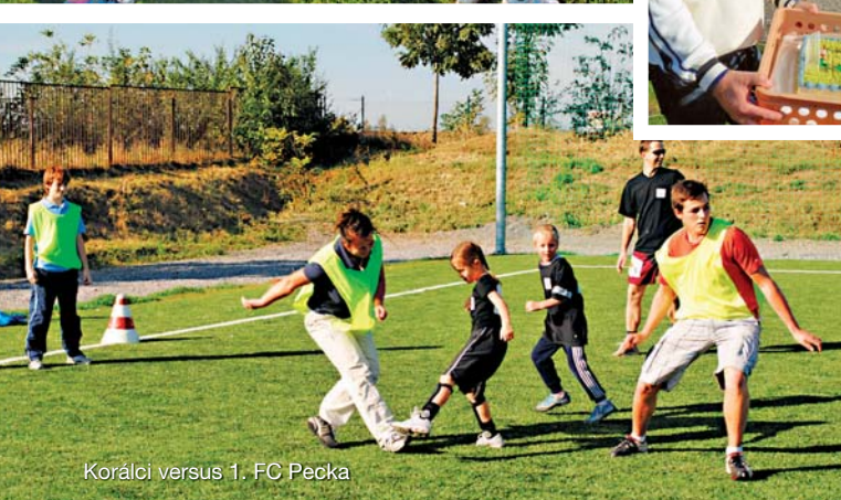
Korálci versus 1. FC Pecka