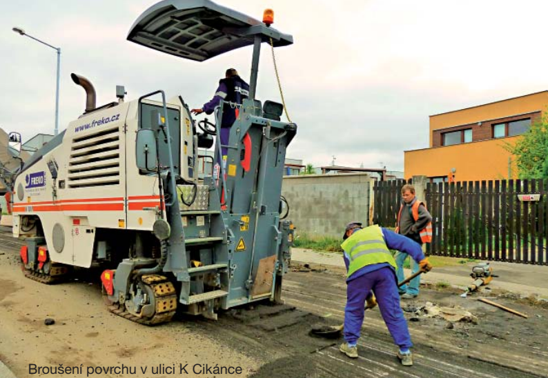
Broušení povrchu v ulici K Cikánce