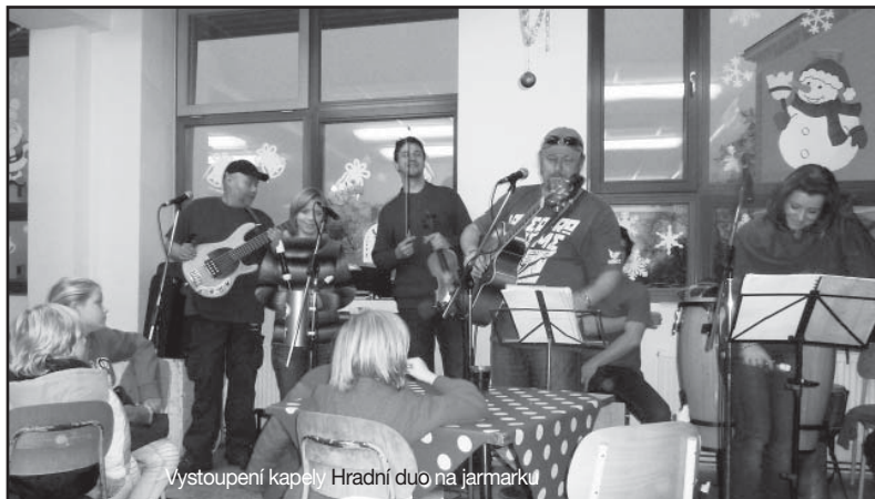
Vystoupení kapely Hradní duo na jarmarku