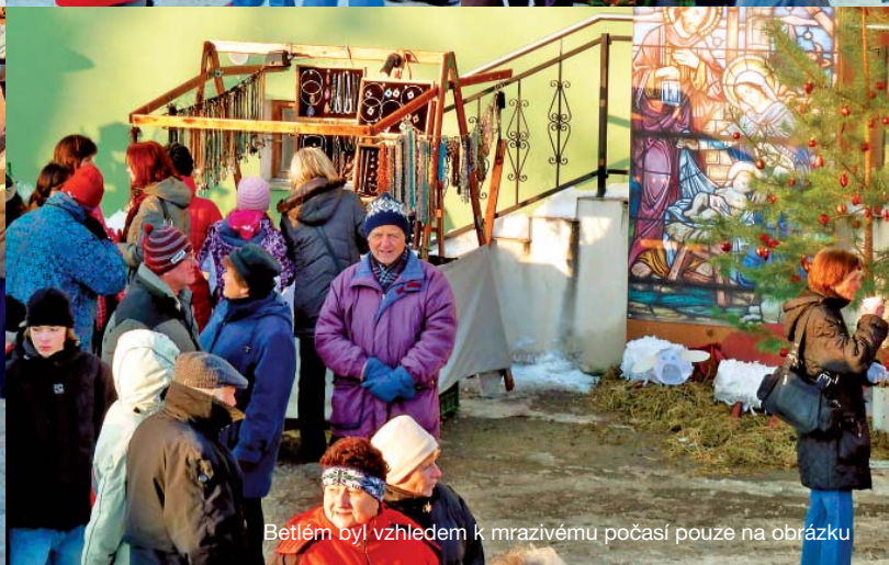
Betlém byl vzhledem k mrazivému počasí pouze na obrázku