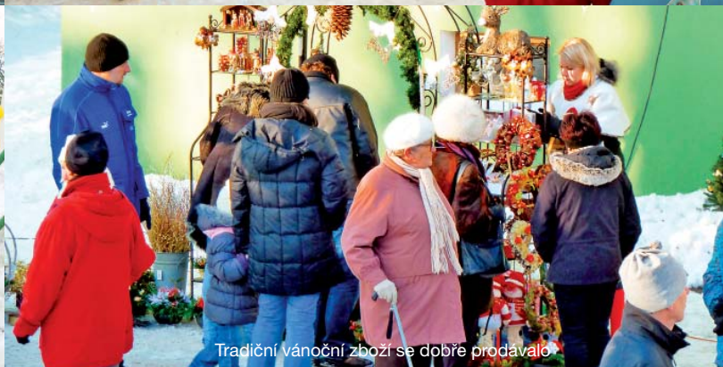
Tradiční vánoční zboží se dobře prodávalo