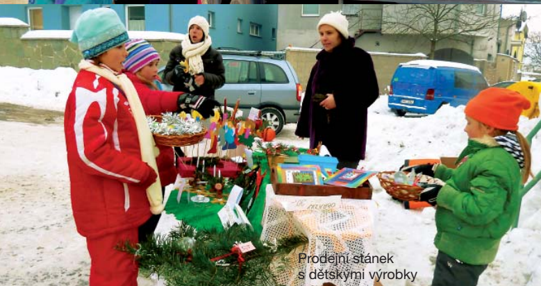
Prodejní stánek s dětskými výrobky