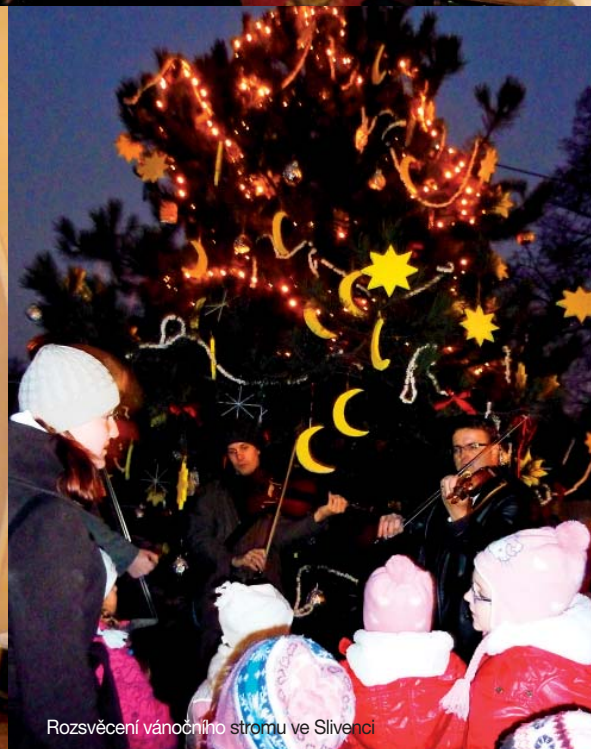
Rozsvěcení vánočního stromu ve Slivenci