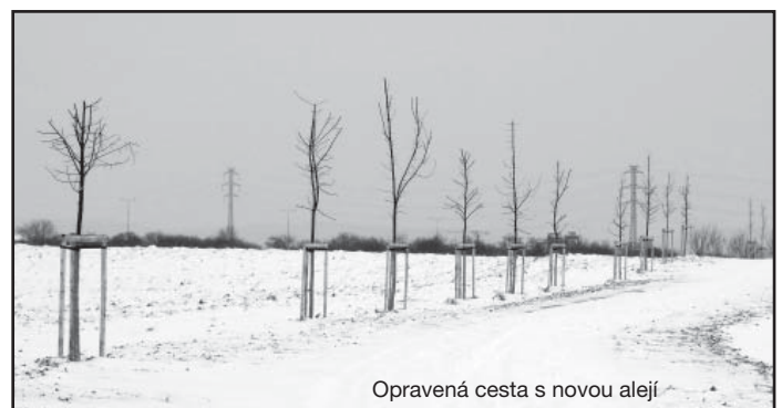
Opravená cesta s novou alejí