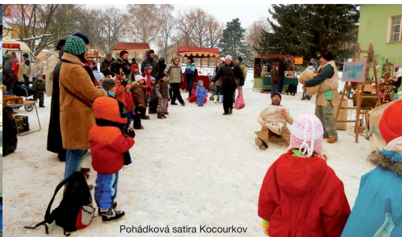
Pohádková satira Kocourkov