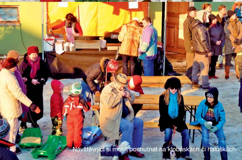
Návštěvníci si mohli pochutnat na klobáskách či haluškách