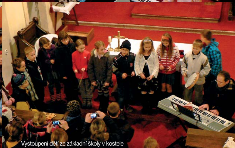
Vystoupení dětí ze základní školy v kostele