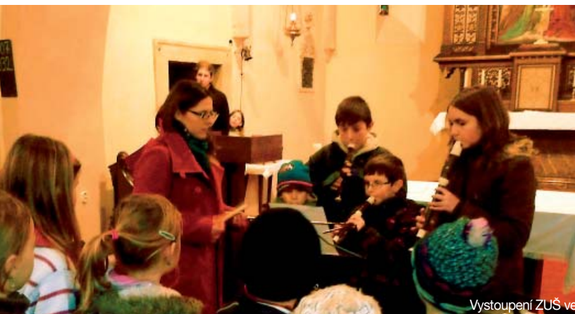
Vystoupení ZUŠ ve sliveneckém kostele