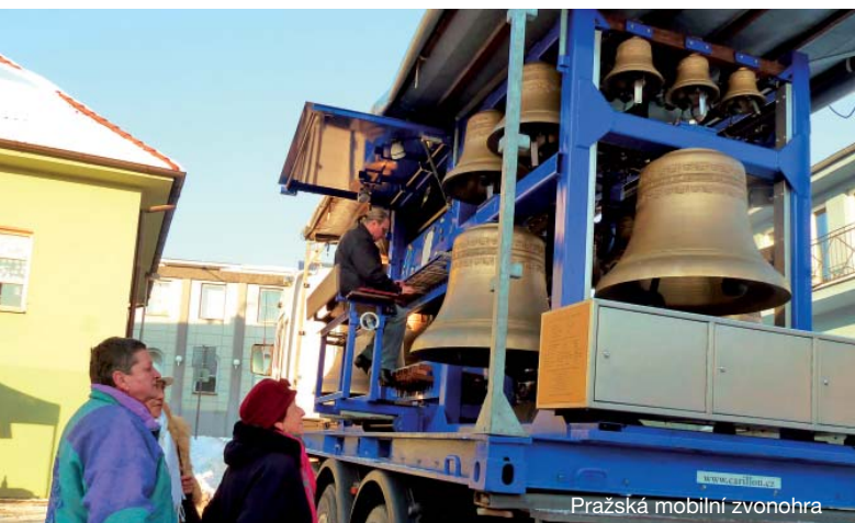
Pražská mobilní zvonohra