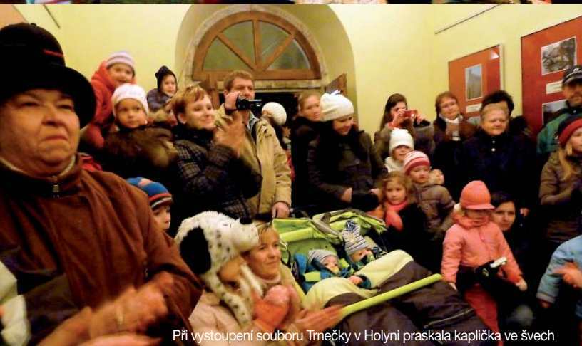
Při vystoupení souboru Trnečky v Holyni praskala kaplička ve švech