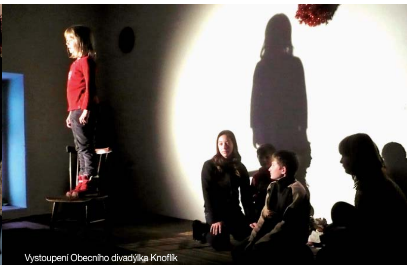
Vystoupení Obecního divadýlka Knoflík