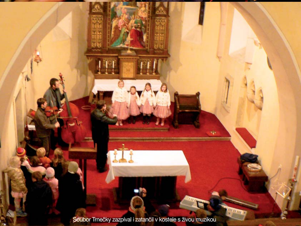
Soubor Trnečky zazpíval i zatančil v kostele s živou muzikou