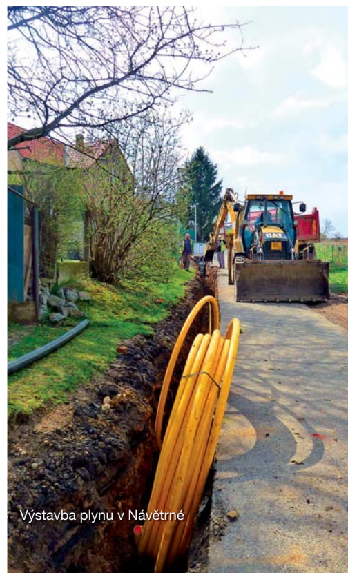
Výstavba plynu v Návětrné