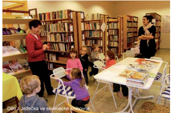
Děti z Ježečka ve slivenecké knihovně

Více informací o široké škále služeb, které naše školka nabízí, se dozvíte na www.skolka-jezecek.cz .