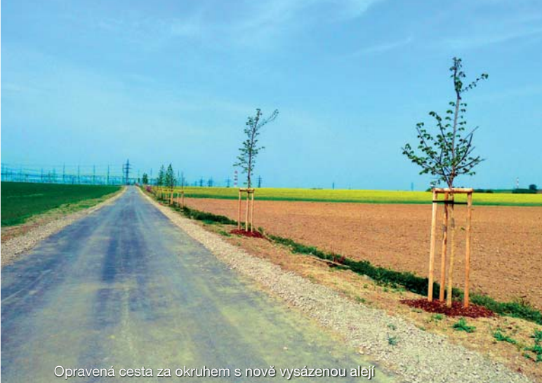
Opravená cesta za okruhem s nově vysázenou alejí