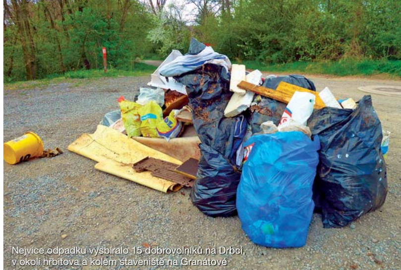
Nejvíce odpadků vysbíralo 15 dobrovolníků na Drbči, v okolí hřbitova a kolem staveniště na Granátové