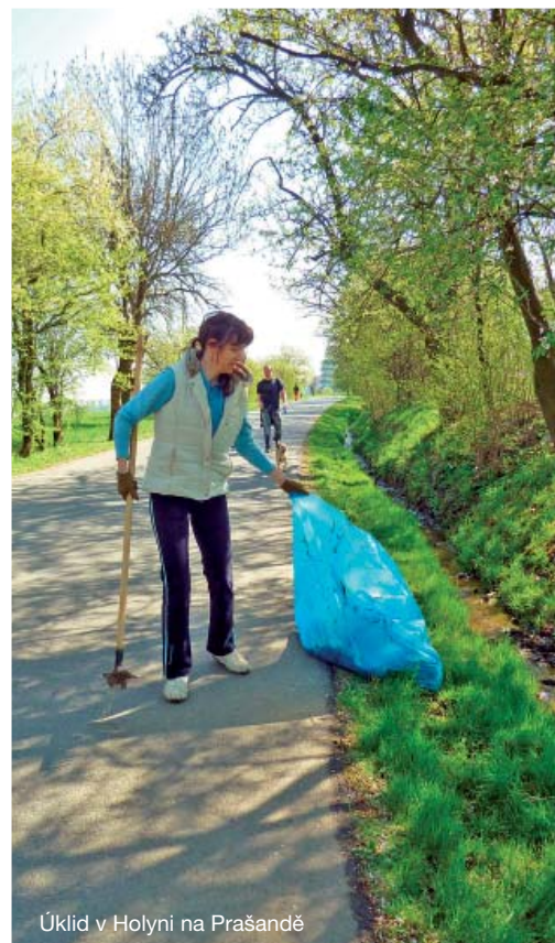
Úklid v Holyni na Prašandě