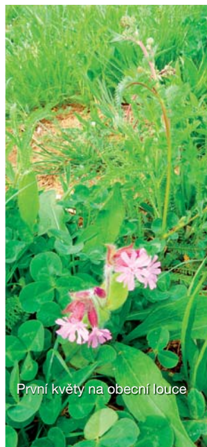
První květy na obecní louce