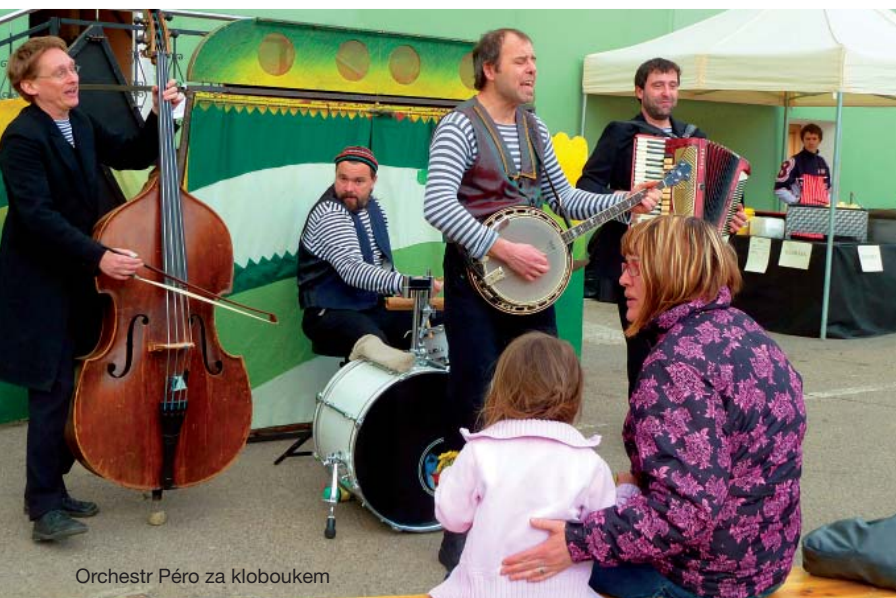
Orchestr Péro za kloboukem