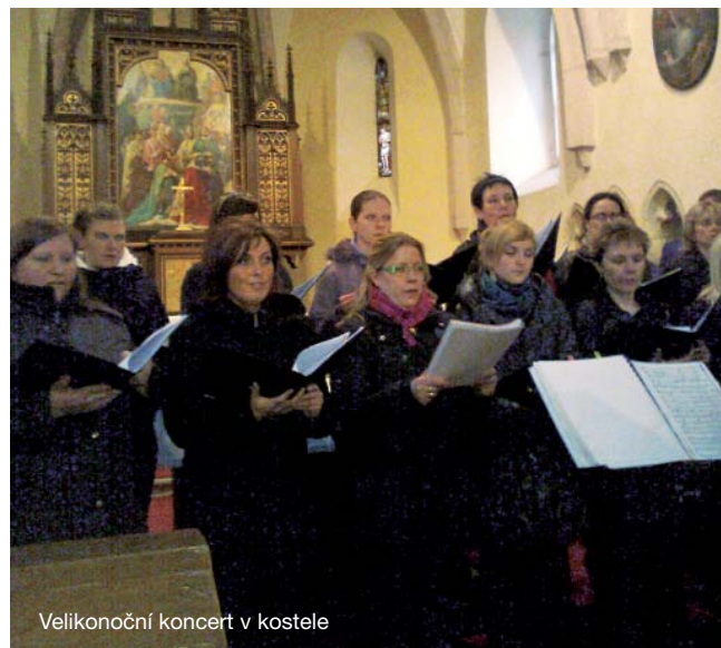
Velikonoční koncert v kostele