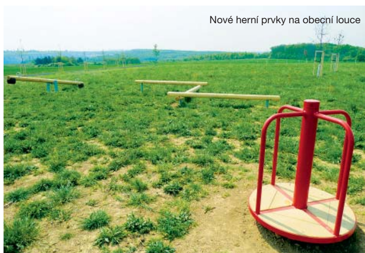
Nové herní prvky na obecní louce