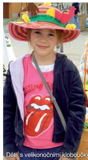
Děti s velikonočními kloboučky