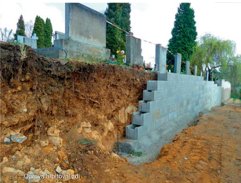
Oprava hřbitovní zdi