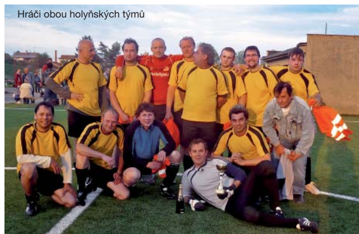
Hráči obou holyňských týmů