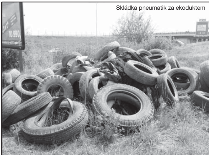
Skládka pneumatik za ekoduktem

Text smlouvy o výpůjčce a Předávacího protokolu je, případně v brzké době bude uveden na adrese www.ises.cz .