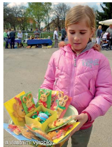
a vlastními výrobky