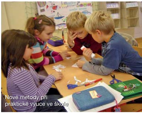
Nové metody při praktické výuce ve škole