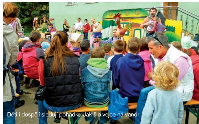
Děti i dospělí sledují pohádku Jak šlo vejce na vandr