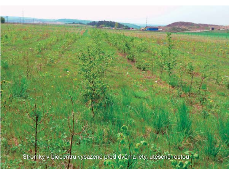
Stromky v biocentru vysazené před dvěma lety, utěšeně rostou