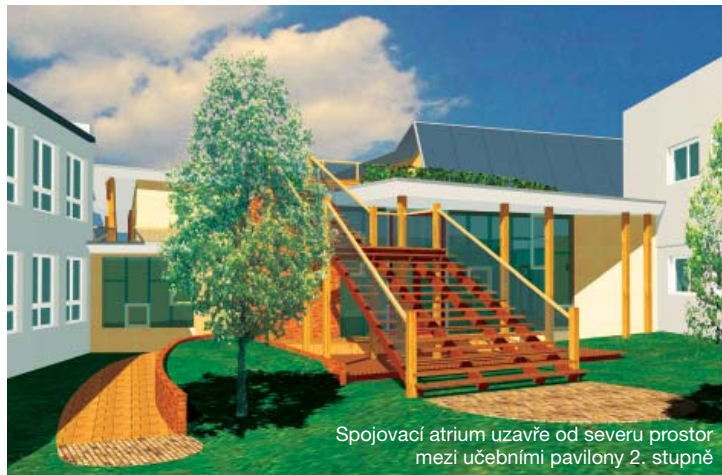
Spojovací atrium uzavře od severu prostor mezi učebními pavilony 2. stupně