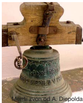
Menší zvon od A. Diepolda

Rád bych vás informoval o naší sbírce na zvony, kterou pořádá Římskokatolická farnost Sliveneč ve spolupráci s Městskou částí Praha Sliveneč. Na účet farnosti do dnešního dne bylo darováno celkem 63.400,-Kč a v obecní kasičce se vybralo 6.097,-Kč. Upřímně děkuji všem dárcům. Dal jsem pokyn k zahájení prací: 19. 4. byly sejmuty dva památné zvony, které budou zbaveny koroze a povrch patinován a ošetřeny konzervačním voskem. Objednali jsme si i nové zvonové příslušenství pro oba zvony. Počítáme i s elektronickým ovládním těchto zvonů. Náklady jsou spočítány na 140.000,-Kč, ještě však nevím, na kolik vyjdou práce tesařské. Jelikož nacházím oporu v paní starostce Plamínkové, věřím, že dílo dotáhneme k zdárnému konci. Zvony budou před umístěním na věž vystaveny v lodi kostela a bude uspořádána děkovaná bohoslužba za všechny, kteří se o rekonstrukci zasloužili. Pokud se budete chtít ještě k naší sbírce připojit, můžete tak učinit převodem na transparentní účet farnosti 2742917001/5500 nebo prostřednictvím Úřadu městské části Praha – Sliveneč, kde stále funguje obecní kasička. Potvrzení o daru na požádání vystavím. Zdeněk Skalický, farář ve Slivenci ■