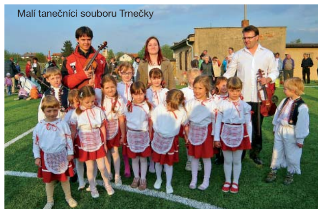
Malí tanečníci souboru Trnečky