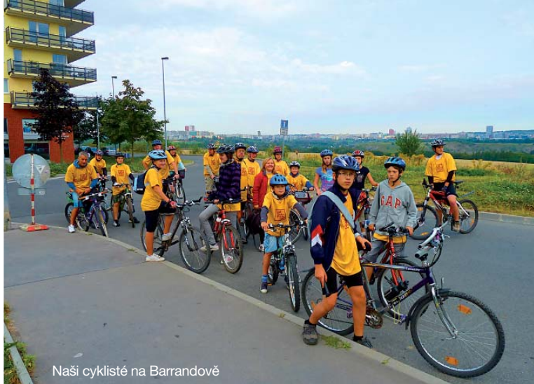
Naši cyklisté na Barrandově