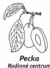
Pecka Rodinné centrum