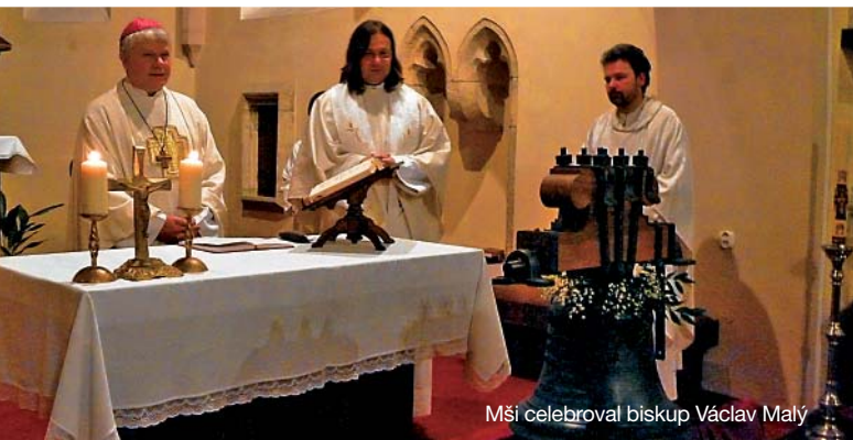
Mši celebroval biskup Václav Malý