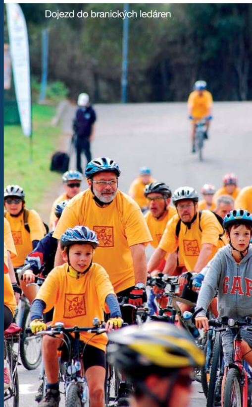
Dojezd do branických ledáren