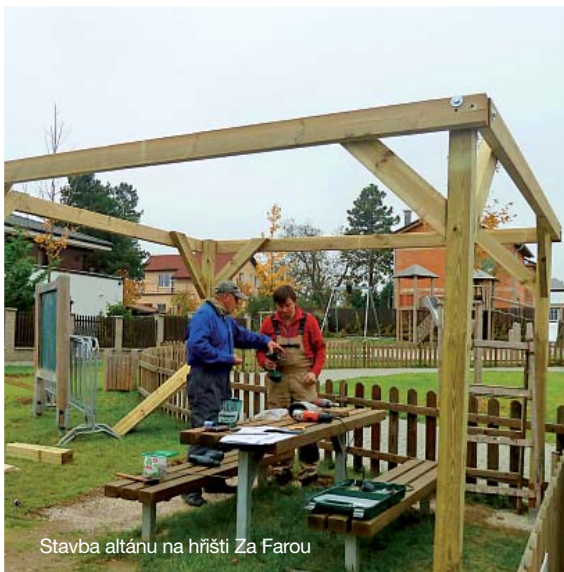
Stavba altánu na hřišti Za Farou