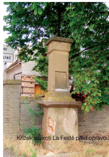
Křížek naproti La Festě před opravou