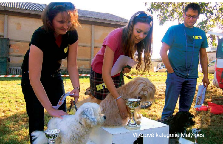
Vítězové kategorie Malý pes