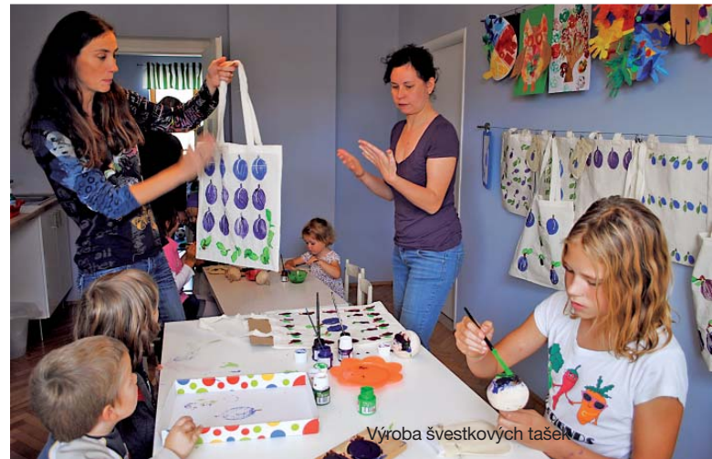
Výroba švestkových tašek