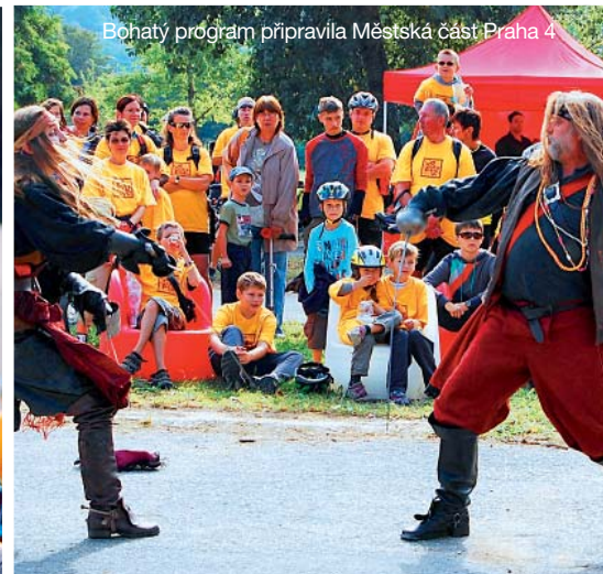
Bohatý program připravila Městská část Praha 4