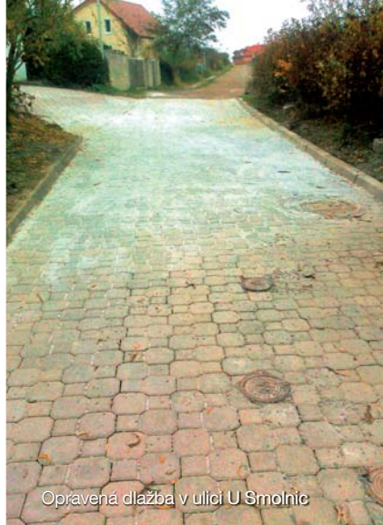
Opravená dlažba v ulici U Smolnic