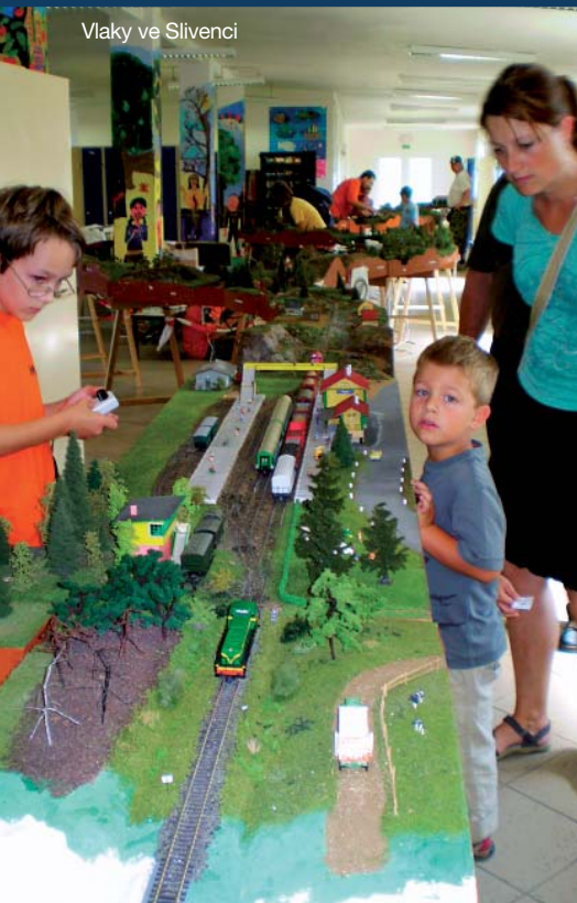
Vlaky ve Slivenci