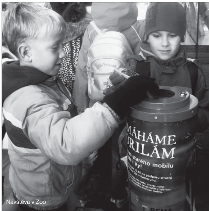
Návštěva v Zoo

V sobotu 15. 10. připravila školní družina pro děti a jejich rodiče již V. přechod Brd z Mníšku pod Brdy do Řevnic. Během cesty plni-