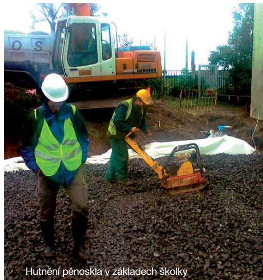
Hutnění pěnospkla v základech školky