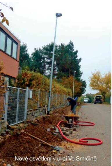
Nové osvětlení v ulici Ve Smrčině