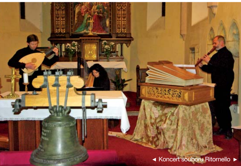
◀ Koncert souboru Ritornello ▶

Podrobnější článek o průběhu svěcení zvonů najdete na str. 10.