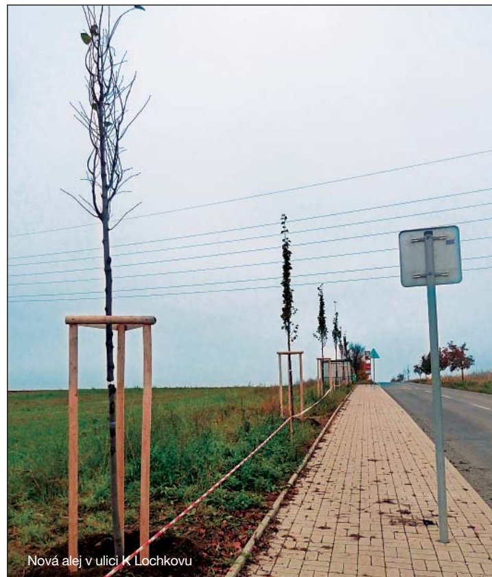
Nová alej v ulici K Lochkovu