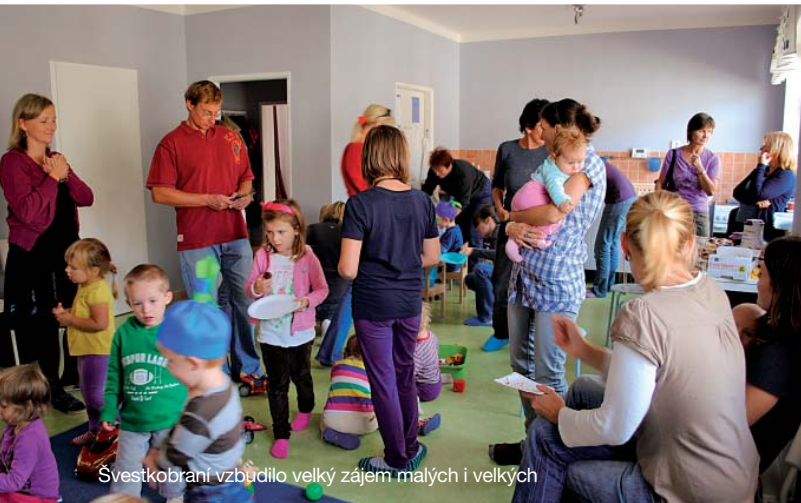
Švestkobraní vzbudilo velký zájem malých i velkých