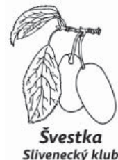
Švestka Slivenecký klub