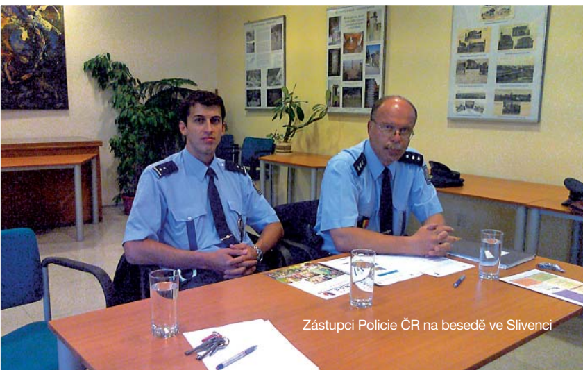
Zástupci Policie ČR na besedě ve Slivenci