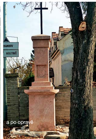
a po opravě