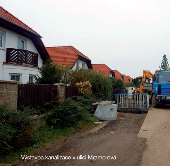
Výstavba kanalizace v ulici Mramorová