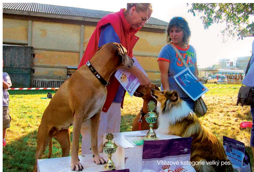
Vítězové kategorie velký pes