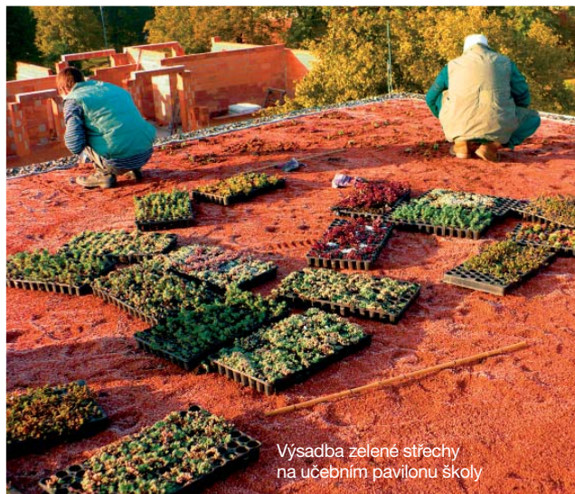
Výsadba zelené střechy na učebním pavilonu školy