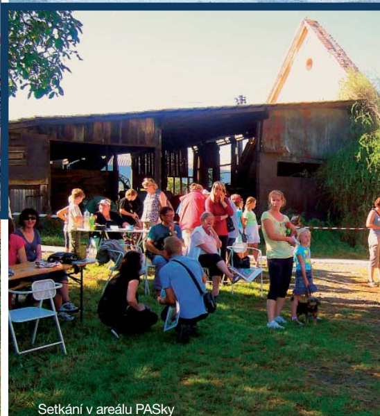
Setkání v areálu PASky