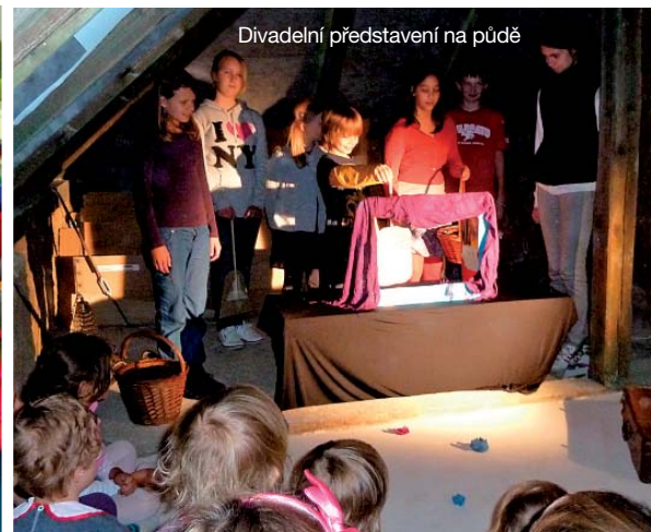
Divadelní představení na půdě