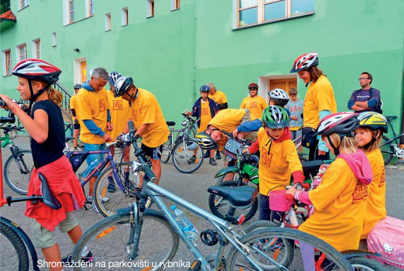
Shromáždění na parkovišti u rybníka