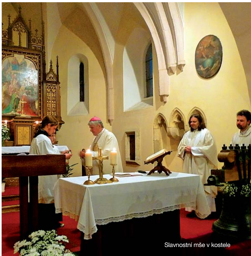
Slavnostní mše v kostele