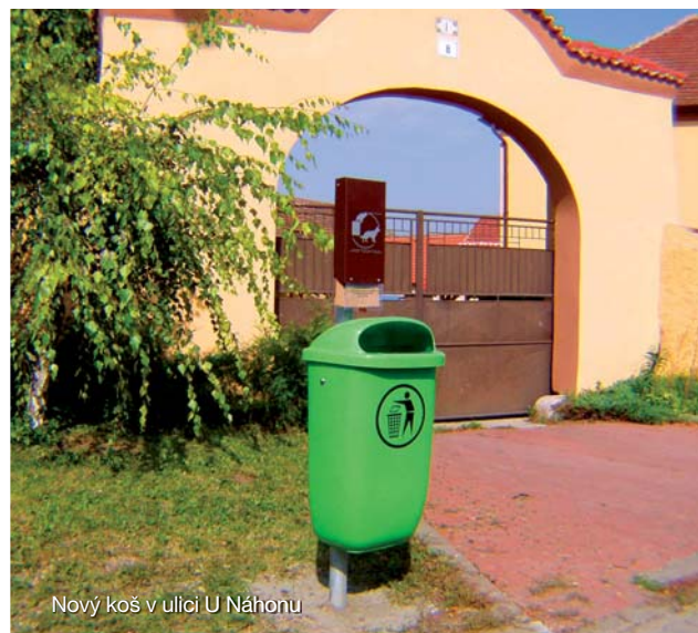
Nový koš v ulici U Náhonu