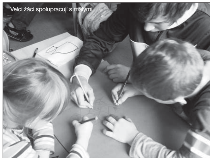
Velcí žáci spolupracují s malými

Během října naši žáci navštívili místní kostel Věch svatých. Zde si prohlédli vystavené zvony a dozvěděli se něco o historii této unikátní stavby i celé obce. S těmito informacemi žáci pracovali i v dalších dnech. Za zmínku stojí především spolupráce žáků 8. a 9. ročníku s prvňáčky. V rámci spolupráce vznikly postery zahrnující práci jak starších, tak mladších žáků.