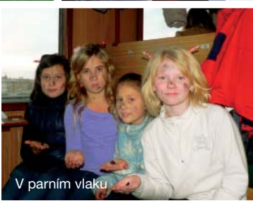
V parním vlaku