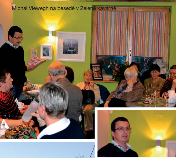
Michal Viewegh na besedě v Zelené kavárně