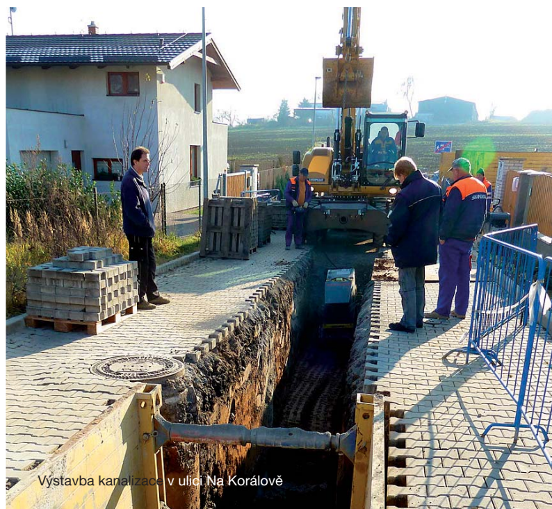
Výstavba kanalizace v ulici Na Korálově