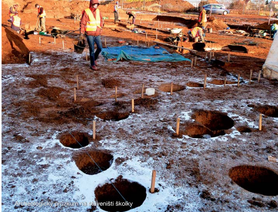
Archeologický průzkum na staveništi školky