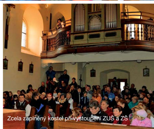
Zcela zaplněný kostel při vystoupení ZUŠ a ZŠ