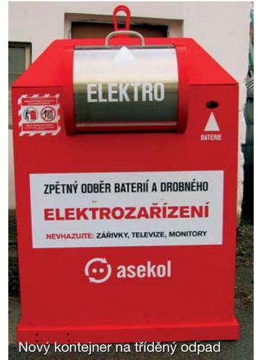
Nový kontejner na tříděný odpad