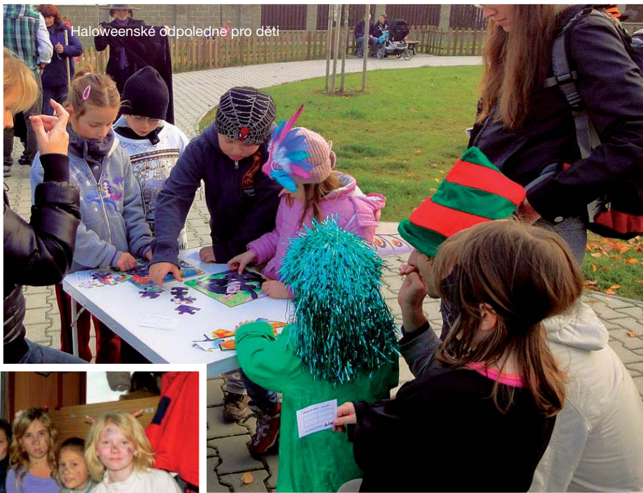
Halové odpoledne pro děti