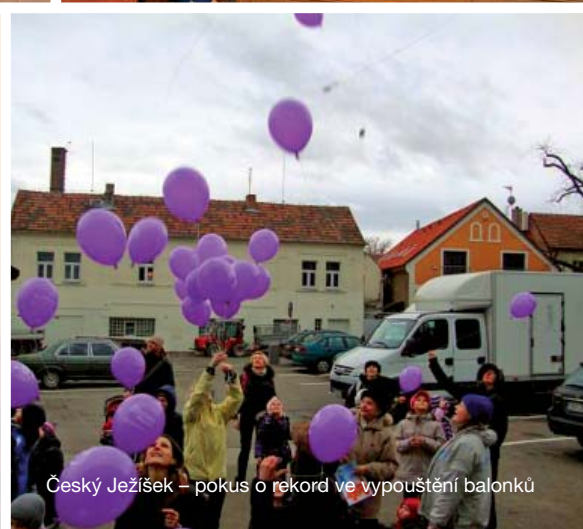
Czech Jesus - attempt on record in balloon release