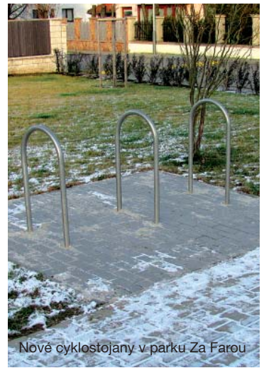
Nové cyklostojany v parku Za Farou