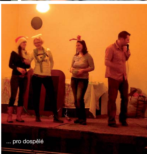
... for adults