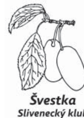
Švestka Slivenecký klub

Informace z Klubu připravil realizační tým Klubu Švestka ☐