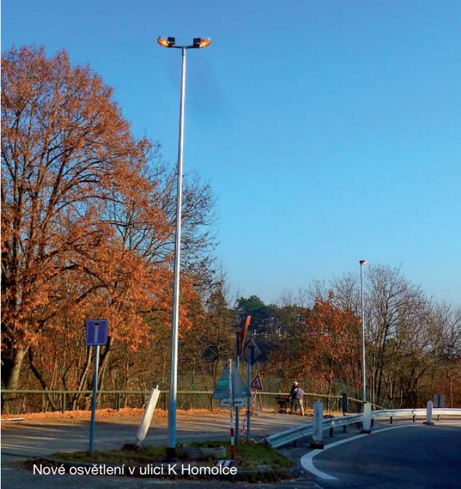
Nové osvětlení v ulici K Homolčů