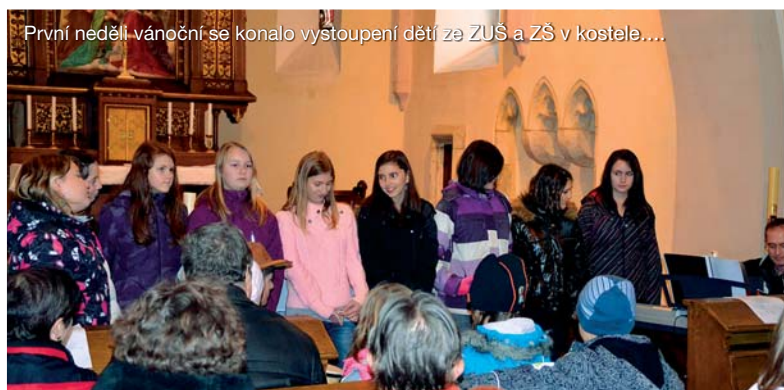
První neděli vánoční se konalo vystoupení dětí ze ZUŠ a ZŠ v kostele....