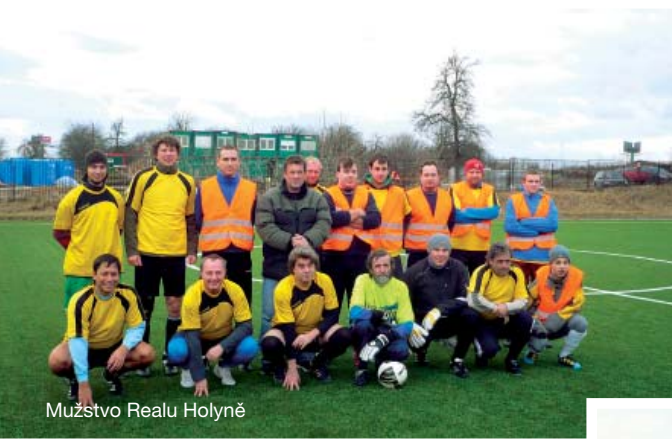
Mužstvo Realu Holyně