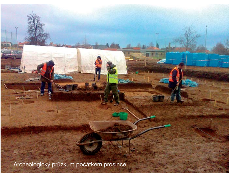
Archeologický průzkum počátkem prosince