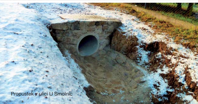
Propustek v ulici U Smolnic