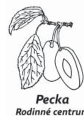
Pecka Rodinné centrum

A co chystáme v novém roce? Především se snažíme neustále zkvalit-