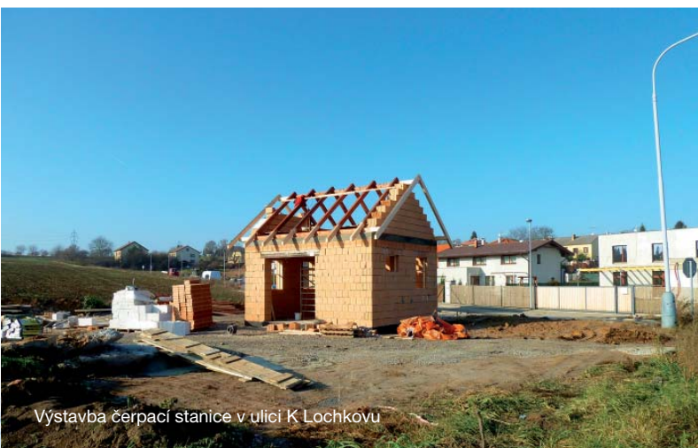
Výstavba čerpací stanice v ulici K Lochkovu