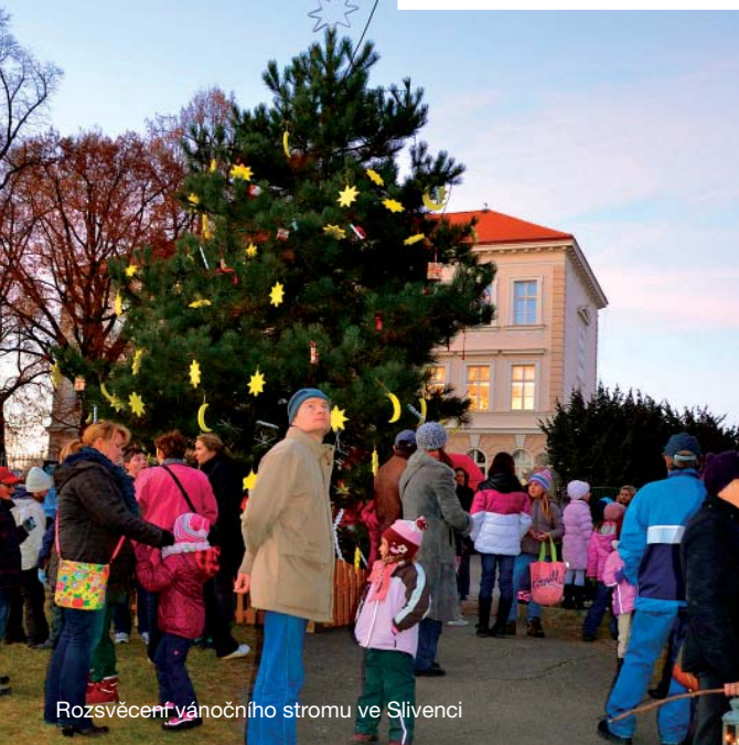
Rozsvěcení vánočního stromu ve Slivenci