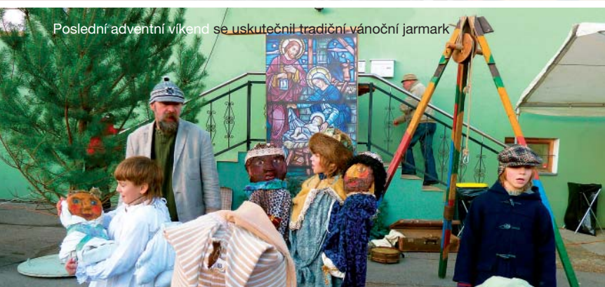
Poslední adventní víkend se uskutečnil tradiční vánoční jarmark