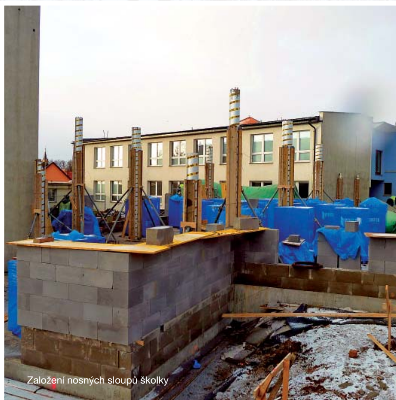
Založení nosných sloupů školky