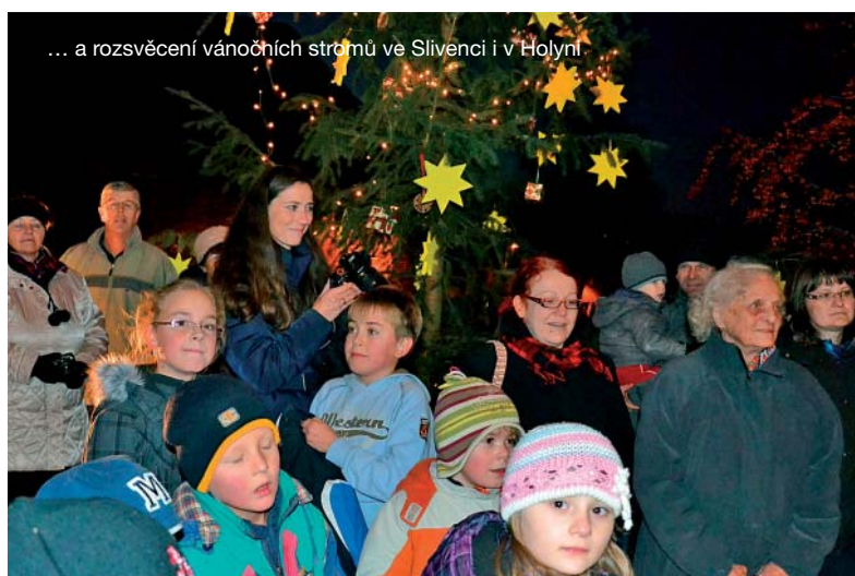
... a rozsvícení vánočních stromů ve Slivenci i v Holyni.