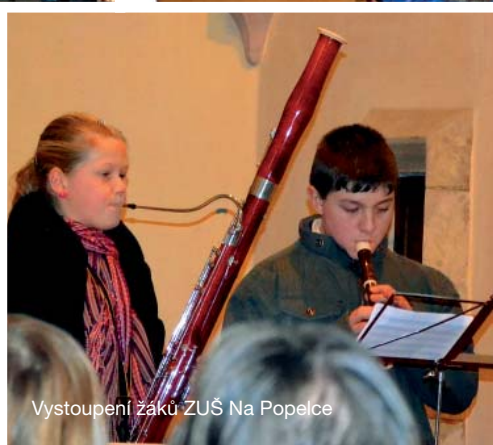
Vystoupení žáků ZUŠ Na Popelce