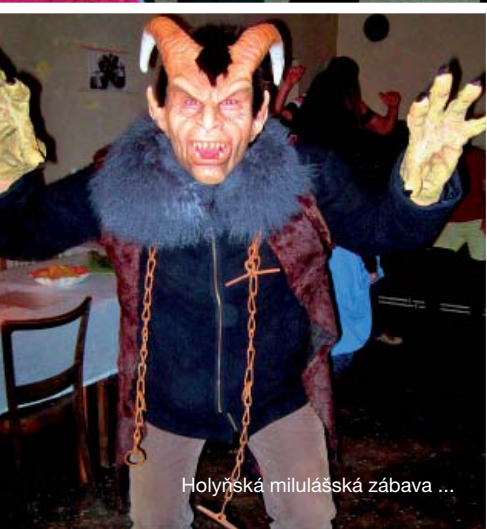
Holy Mary's folk festival ...