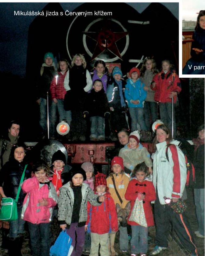
Mikulášská jízda s Červeným křížem