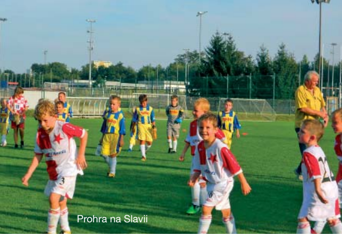
Prohra na Slavii