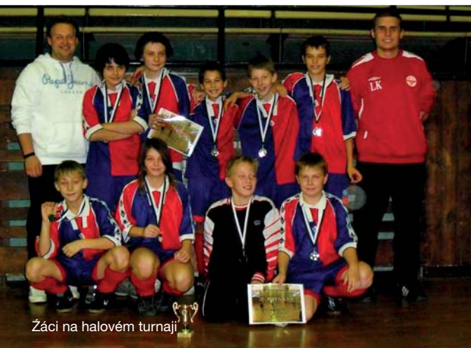
Žáci na halovém turnaji