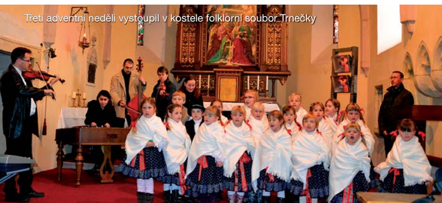
Třetí adventní neděli vystoupil v kostele folklorní soubor Trnečky