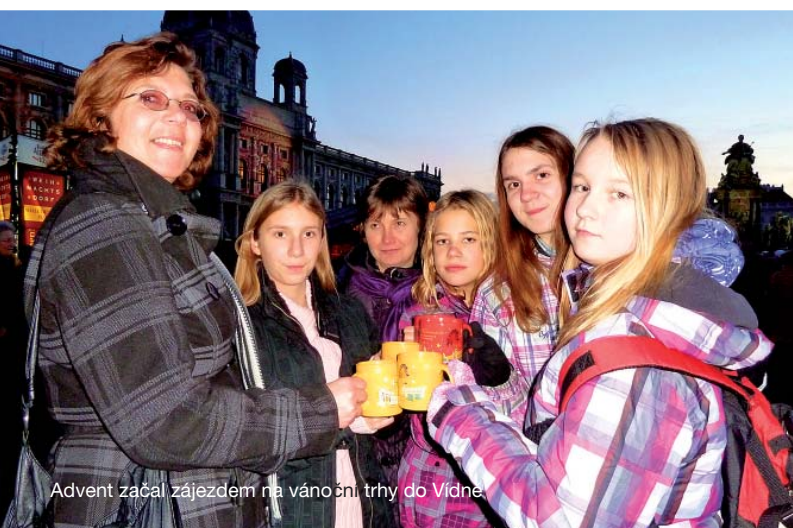
Advent začal zájezdem na vánoční trhy do Vídně.