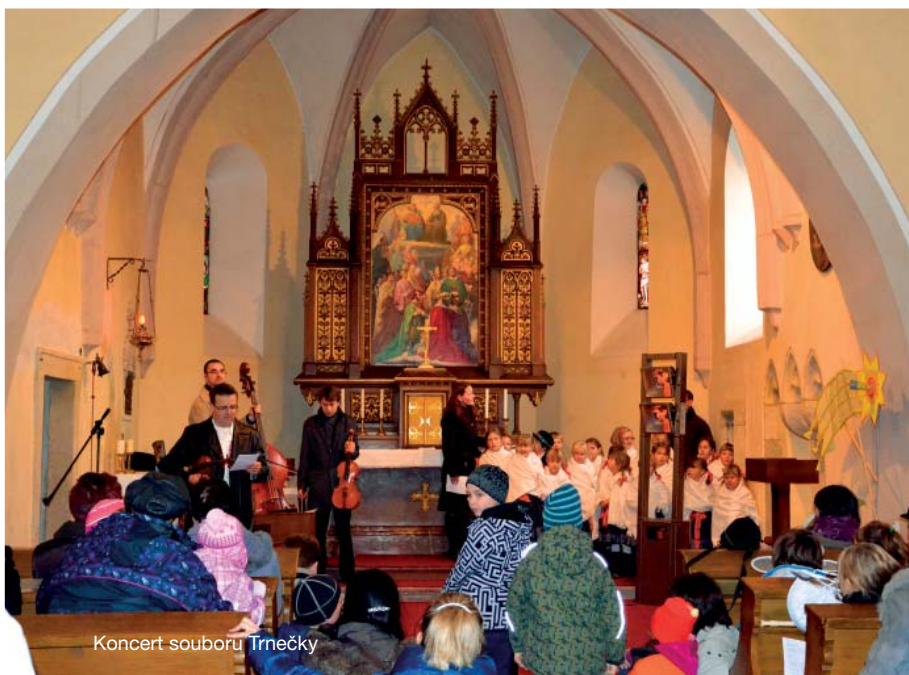
Koncert souboru Trnava