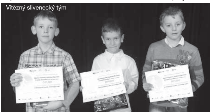
Vítězný slivenecký tým