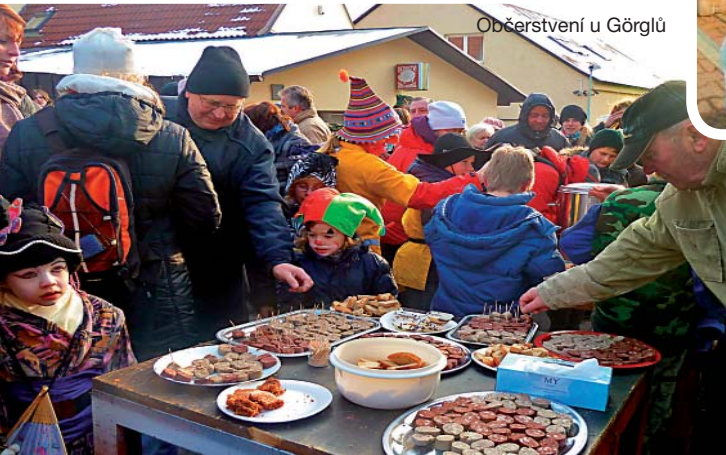
Občerstvení u Görglů