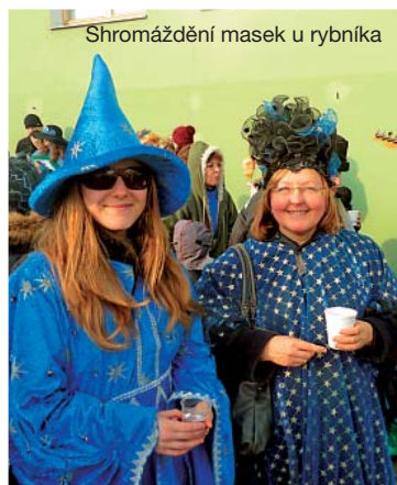
Shromáždění masek u rybníka