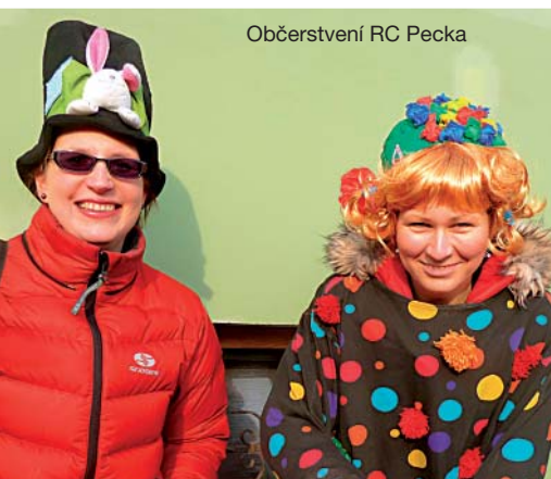
Občerstvení RC Pecka