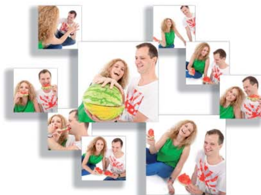
Jedním z nejoblíbených a ojedinělých produktů je 3D koláž složená z 9 obrazů.