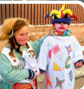
Stánky v Holyni