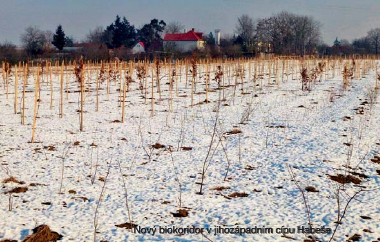
Nový biokoridor v jihozápadním cípu Hábeše