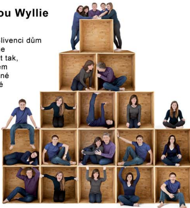
Ukázka focení ve studiu. Pracujeme se spoustou rekvizit, jednou z oblíbených je dřevěná krabice.