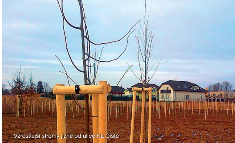
Vzrostlejší stromy jižně od ulice Na Čisté