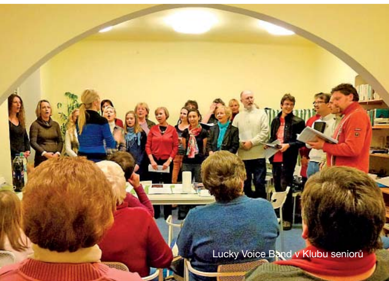
Lucky Voice Band v Klubu seniorů