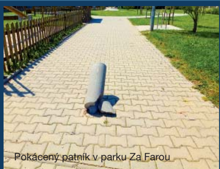
Pokácený patník v parku Za Farou