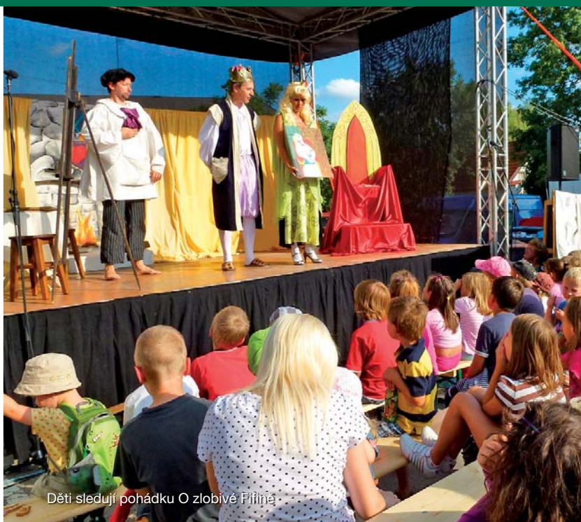
Děti sledují pohádku O zlobivé Fifině