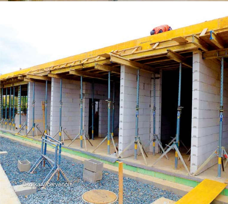
Školka v červenci