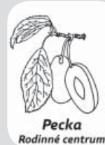
Pecka Rodinné centrum

Předškoláček Po 15.00-15.45/5-6 let /10 lekcí/ 850 Kč /Krenželoková