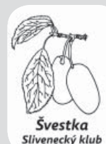
Švestka Slivenecký klub

Módní doplňky II. – 12-16let 310, st 16:30-18:00/ 850+200 Kč/Doležalová