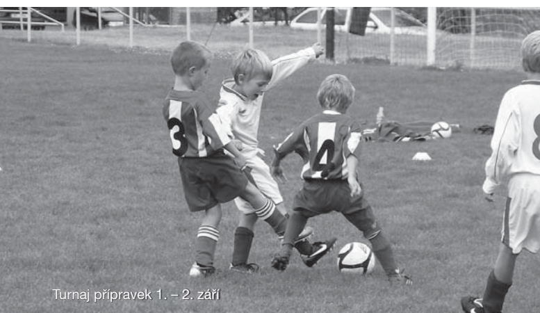
Turnaj přípravek 1. – 2. září