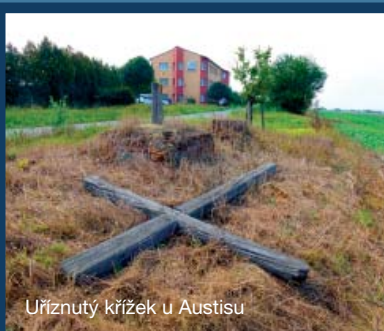
Uříznutý křížek u Austisu