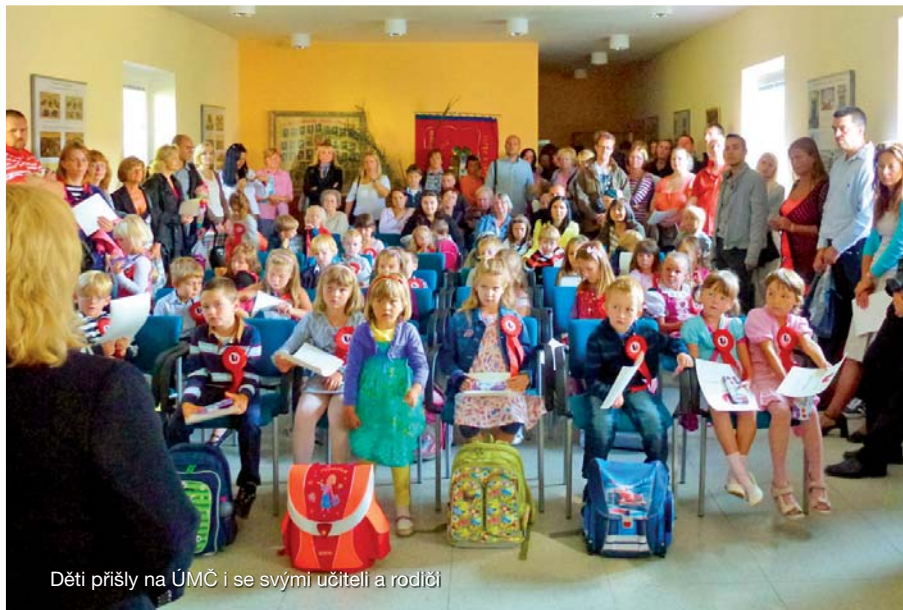
Děti přišly na ÚMČ i se svými učiteli a rodiči