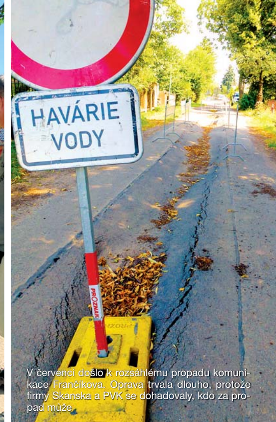
V červenci došlo k rozsáhlému propadu komunikace Francíčkova. Oprava trvala dlouho, protože firmy Skanska a PVK se dohadovaly, kdo za propad může