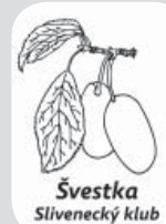
Švestka Slivenecký klub

Španělština pro mírně pokročilé 522, Čt 19.00-19.45 / 1200 Kč/Poláková