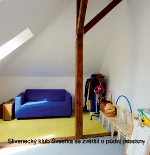
Slivenecký klub Švestka se zvětšil o půdní prostory