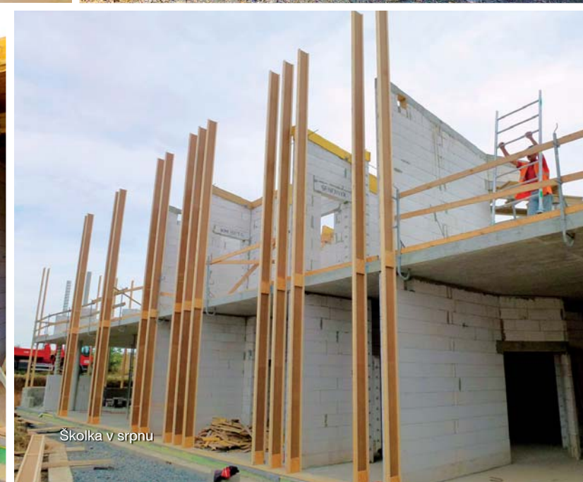
Školka v srpnu