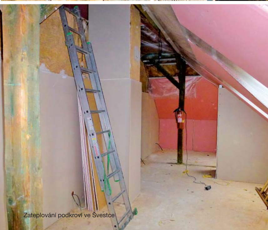
Zateplování podkrovní ve Švestce