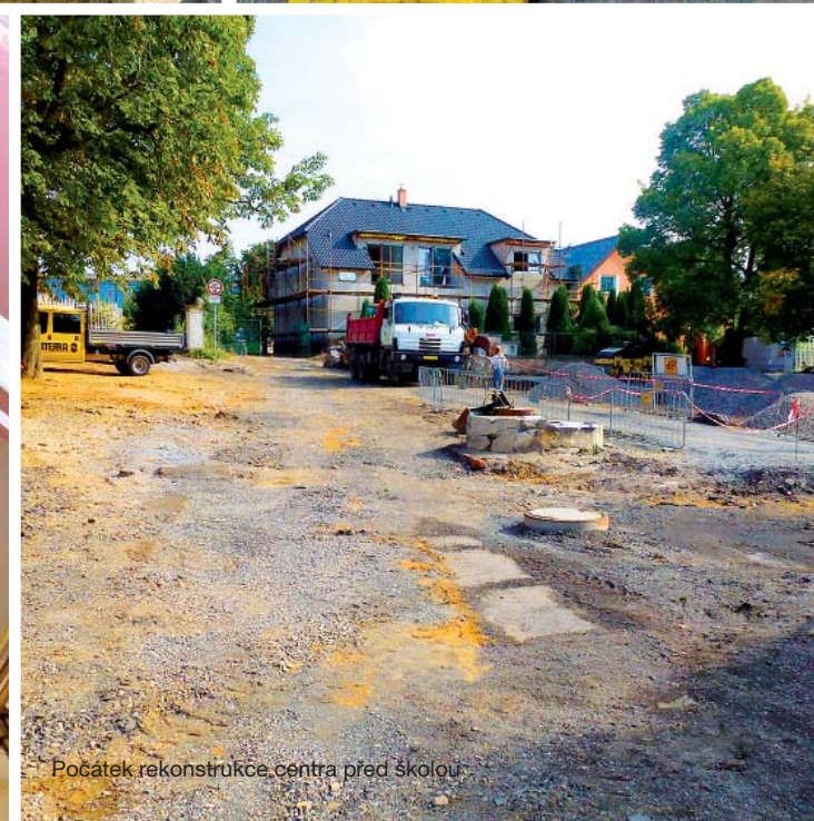
Počátek rekonstrukce centra před školou