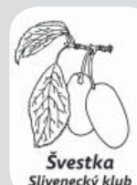
Švestka Slivenecký klub

Platby mohou zohledňovat naplněnost kurzu - individuální výuka je po domluvě možná.