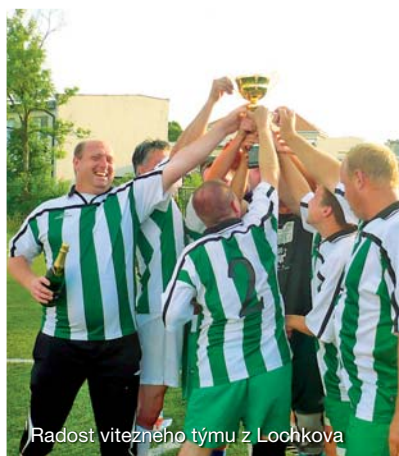
Radost vítězného týmu z Lochkova