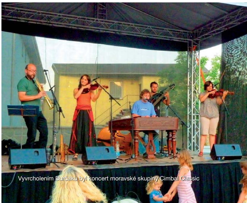
Vyvrcholením Burčáku byl koncert moravské skupiny Cimbal Classic