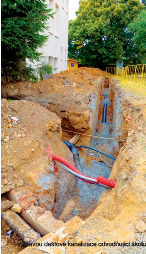
Instalaci deštové kanalizace odvodňující školu