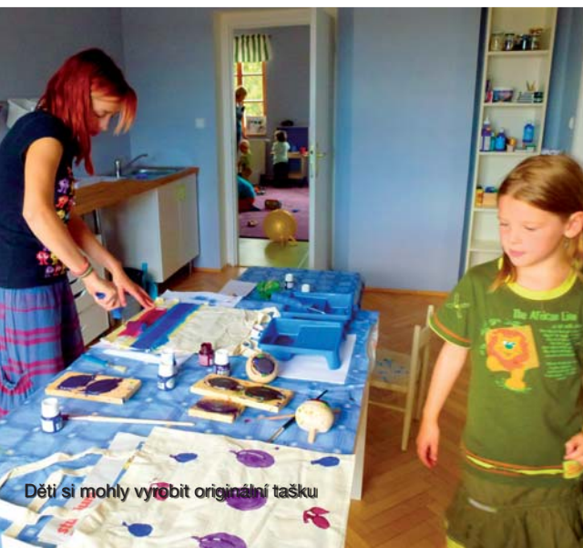
Děti si mohly vyrobit originální tašku