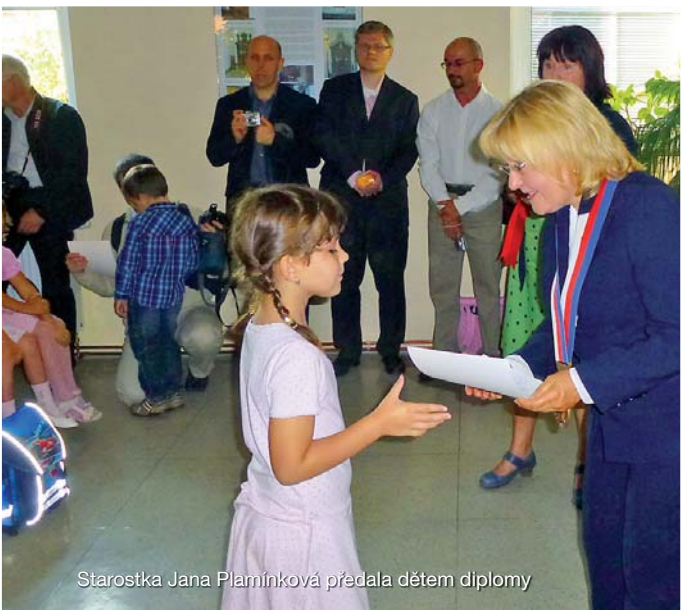
Starostka Jana Plamínková předala dětem diplomy

V první den školy se konala na ÚMČ Praha – Slivenec imatrikulace nových žáků prvních ročníků naší základní školy. K dětem, jejich rodičům a učitelům krátce promluvila starostka městské části Jana Plamínková. Popřála dětem, ať se jim ve škole líbí, a předala jim diplomy. Od místostarostky Lenky Kudlákové dostaly kokardu a čokoládu.