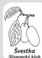
Švestka Slivenecký klub

Břišní tanec – dospělí 208, St 18.00-19.30/ 1200 Kč/Šmahelová