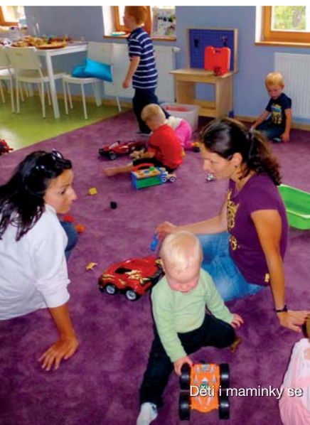
Děti i maminky se