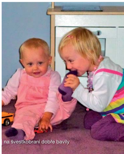
na švestkobraní dobře bavily