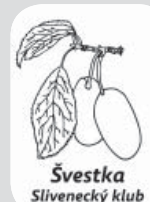
Švestka Slivenecký klub

Začínáme s kytarou 405, Út 17.00-17.45 / 1200 Kč - malá skupina /Kohout