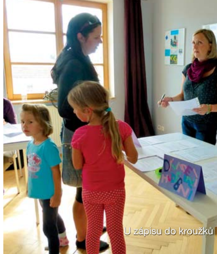
U zápisu do kroužků