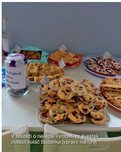
V soutěži o nejlepší výrobek ze švestek zvítězil koláč Boženka (vpravo nahore)