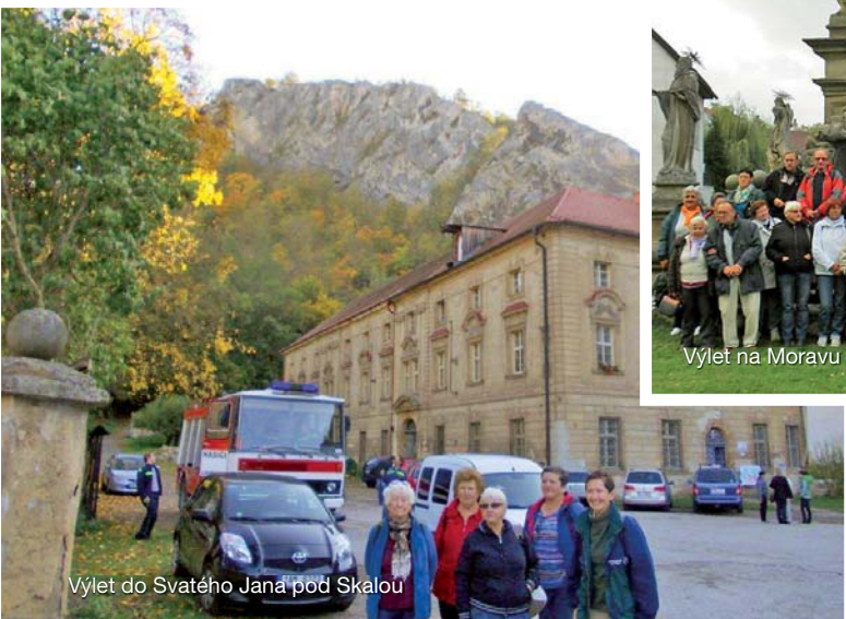
Výlet do Svatého Jana pod Skalou