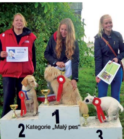
Kategorie „Malý pes“