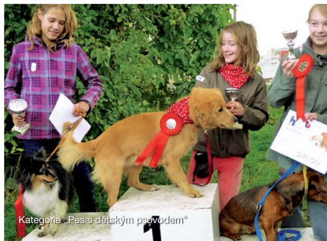
Kategorie „Pes s dětským psovodem“