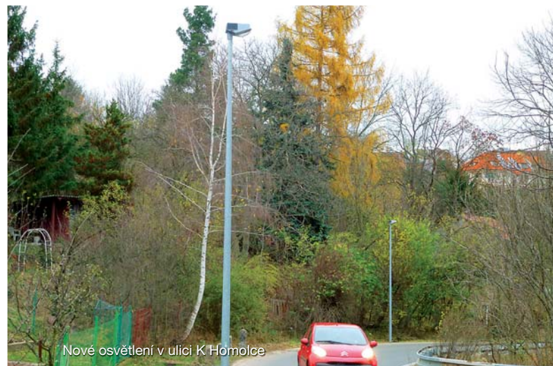
Nové osvětlení v ulici K Homolce