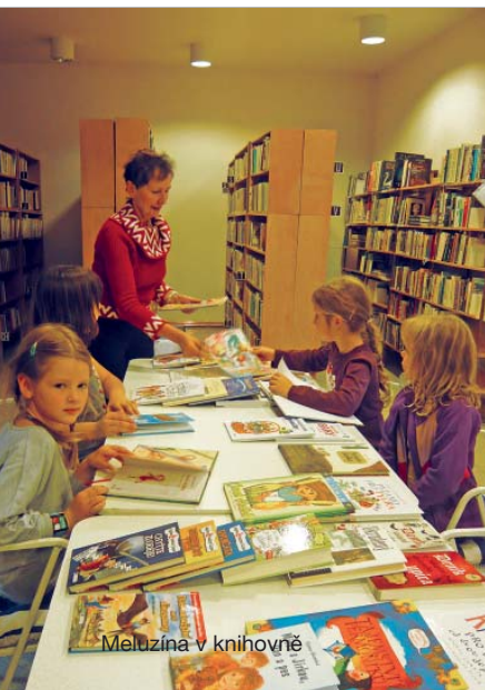
Meluzína v knihovně