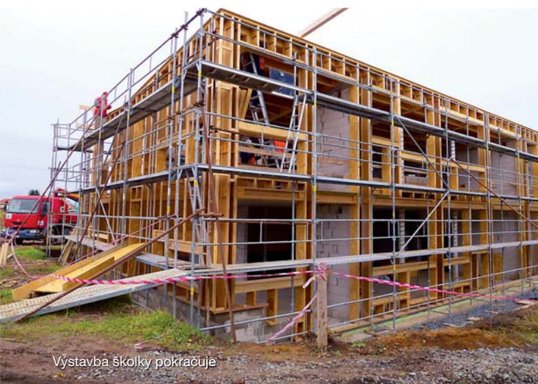
Výstavba školky pokračuje