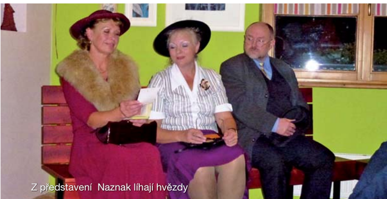
Z představení Naznak Iihaj hvězdy