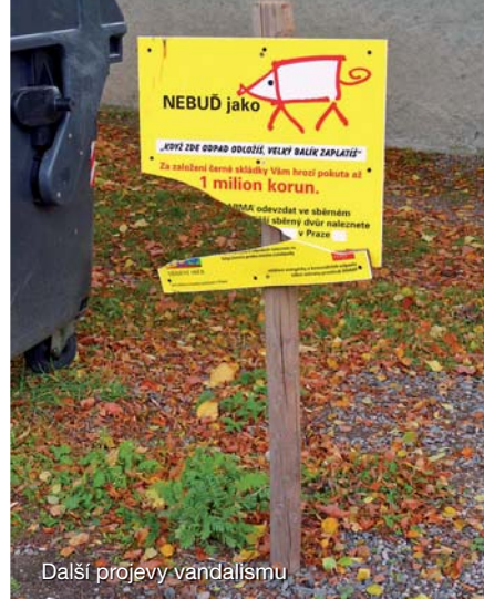
Další projevy vandalismu