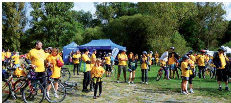
Na louce U soutoku