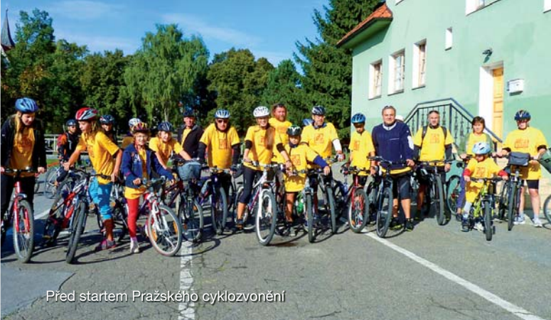
Před startem Pražského cyklozvonění