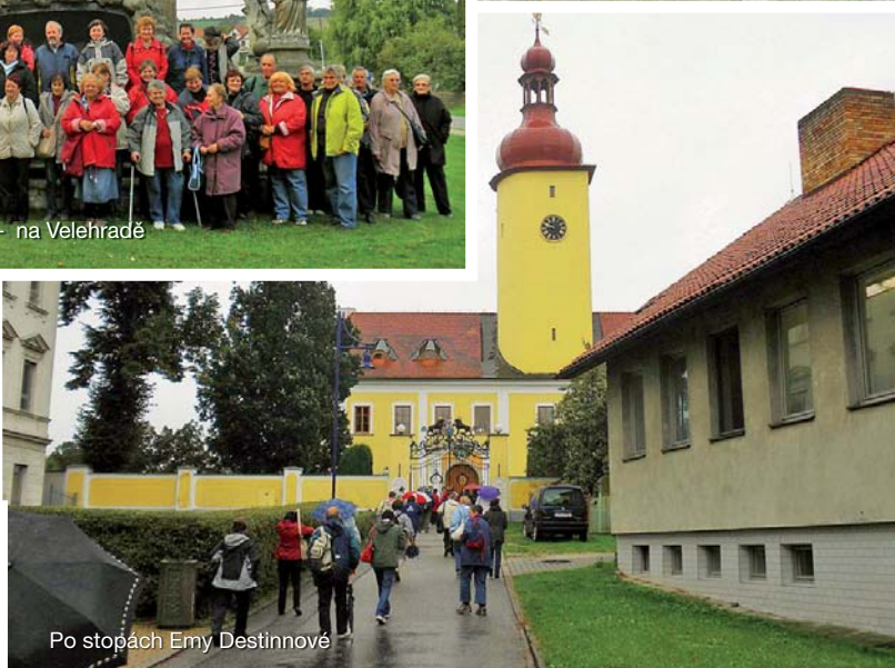
Po stopách Emy Destinové