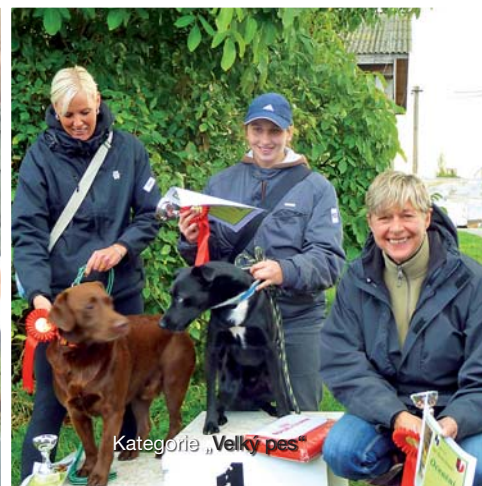
Kategorie „Velký pes“