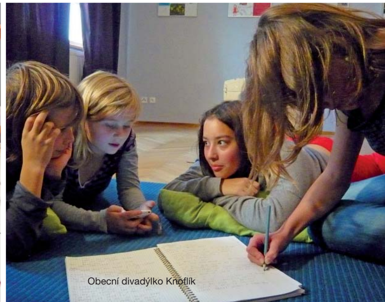
Obecní divadélko Křořík