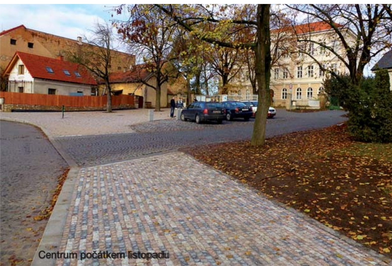
Centrum počátkem listopadu