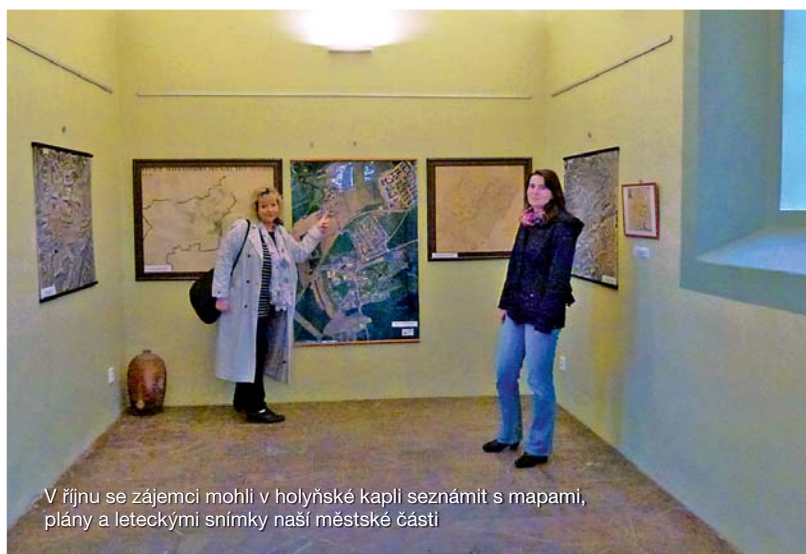
V říjnu se zájemci mohli v holyšské kapli seznámit s mapami, plány a leteckými snímky naší městské části