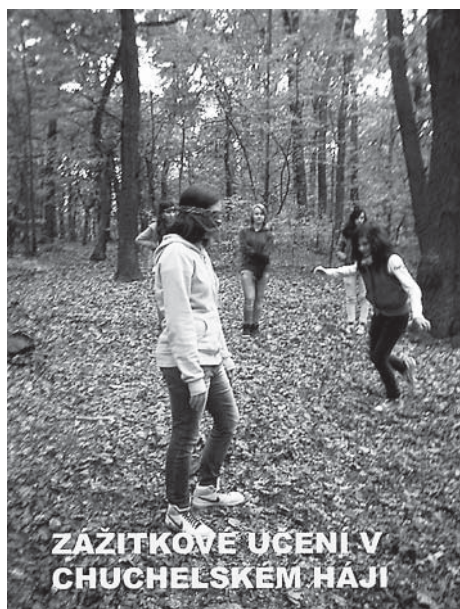
ZAŽITKOVÉ UČENÍ V CHUCHELSKÉM HAJI

je náročnější také v oblasti hodnocení a sebehodnocení žáků. A právě o nových metodách výuky, o učebnicích a jejich využívání, o domácích úkolech a o dalších otázkách chtějí učitelé naší školy hovořit osobně s rodiči našich žáků. Zveme tedy všechny zájemce o výuku v naší škole na společné posezení dne 10. 12. v 16:30 do zasedací místnosti Úřadu městské části Praha – Slivenec. Přineseme vám ukázat také práce žáků a vy budete mít možnost diskutovat o tématech týkajících se výuky v naší škole.