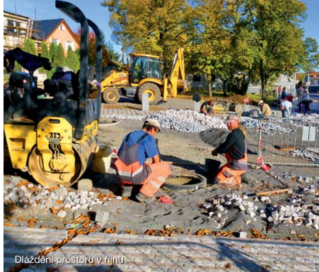
Díždění prostoru v říjnu