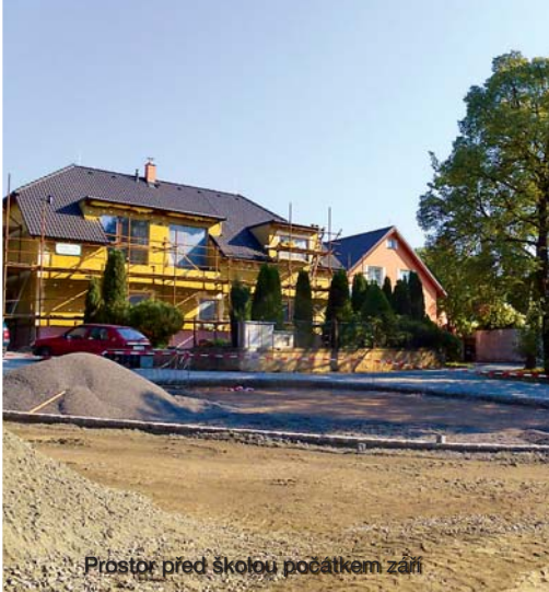
Prostor před školou počátkem září