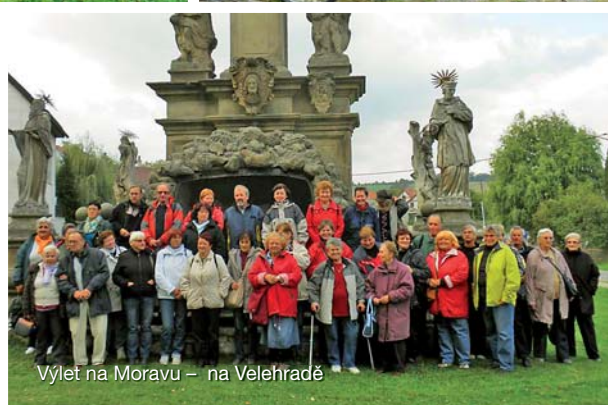
Výlet na Moravu – na Velehradě