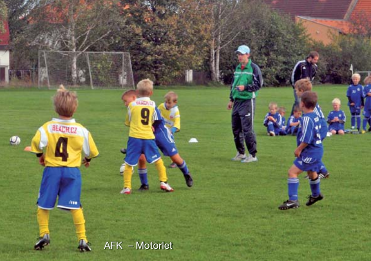
AFK – Motorlet