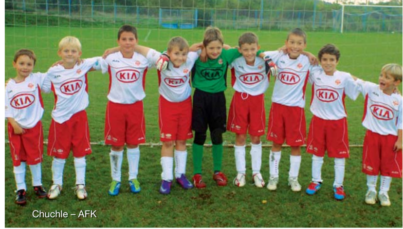
Chuchle – AFK