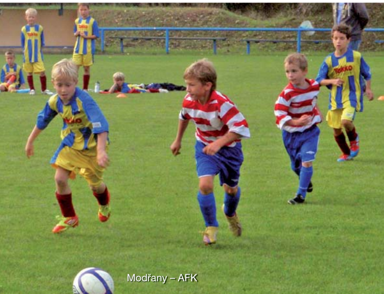
Modrány – AFK