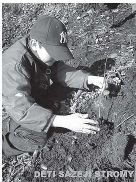
DETI SAZEJÍ STROMY