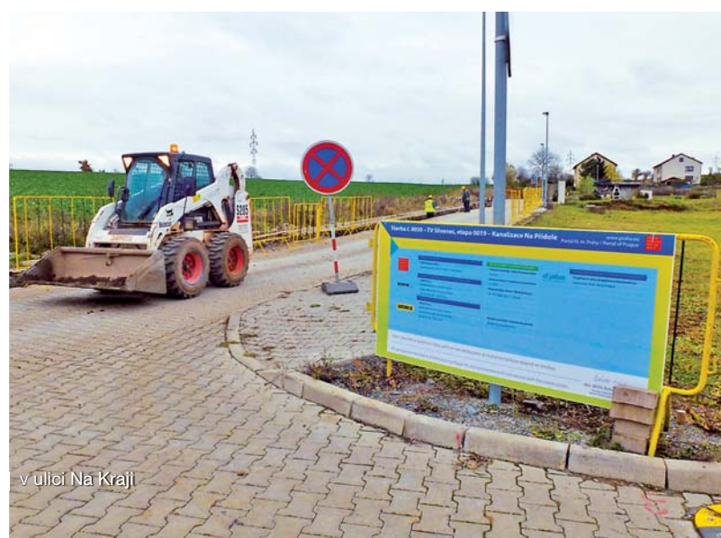
v ulici Na Kraji