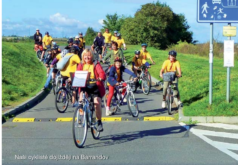
Naši cyklisté dojíždějí na Barrandov