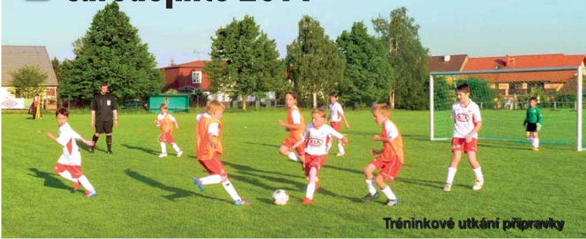
Tréninkové utkání přípravky