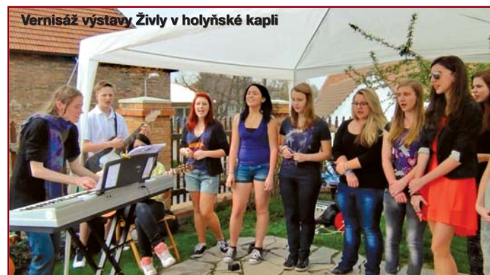
Vernisáž výstavy Živly v holyříské kapli