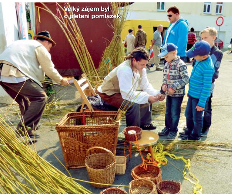
Velký zájem byl o pletení pomlázek