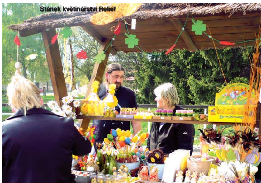
Stánek květinářství Reliéf