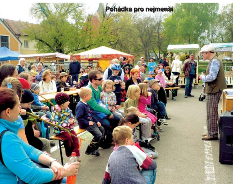
Pohádka pro nejmenší