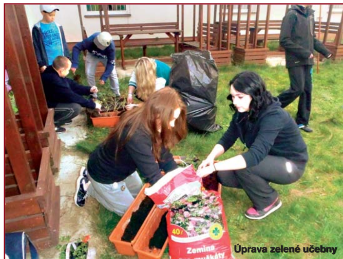
Úprava zelené učebny

I letos nám výrazně přálo počasí, svítilo sluníčko. Žáci si den velmi užili, malí poznali lépe své starší spolužáky a bylo pěkné pozorovat, jak se „staršáci“ úkoly opatrovnictví zhostili se ctí a starali se vzorně o své přidělenec.