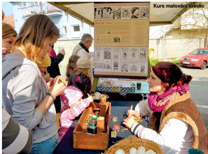
Kurs malování kraslic