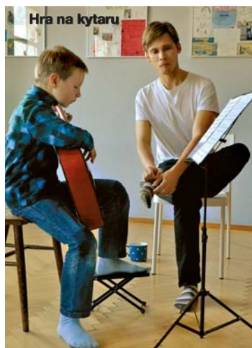
Hra na kytaru