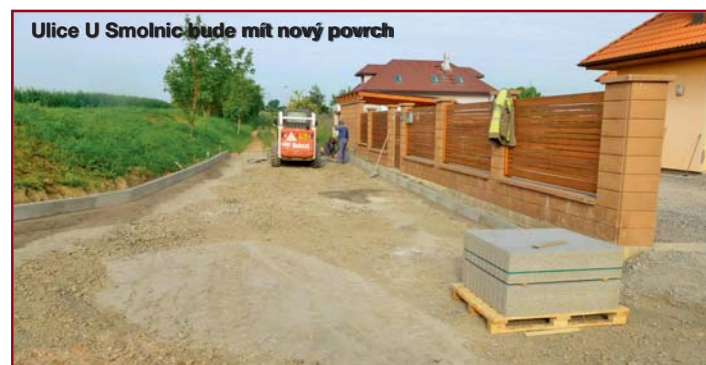
Ulice U Smolnic bude mít nový povrch

Po problémech s nástupem firmy by se s prvním červencem mělo začít i s budováním avizovaného chodníku podél ulice K Lochkovu od křižovatky s ulicí K Cikánce po křižovatku s ulicí K Rozvodně. Prosíme místní, aby byli během výstavby opatrní, protože v tomto úseku je i zastávka MHD, kterou bude nutno na čas posunout směrem k Lochkovu. Doufáme, že se touto investicí zvýší bezpečnost chodců, kteří v tomto úseku často chodí ve vozovce.