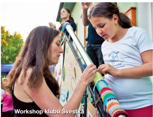
Workshop klubu Švestka