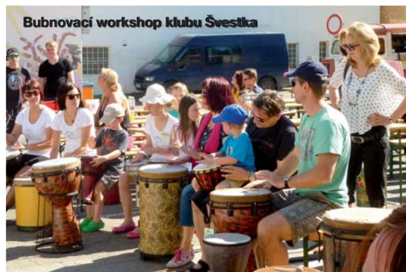
Bubnovací workshop klubu Švestka