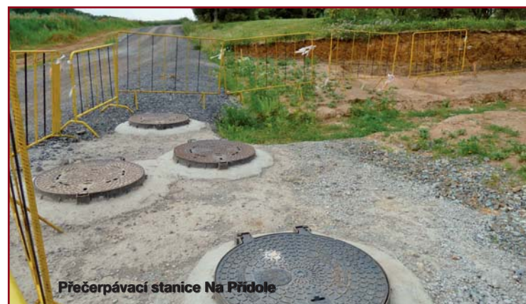
Přečerpávací stanice Na Přídole