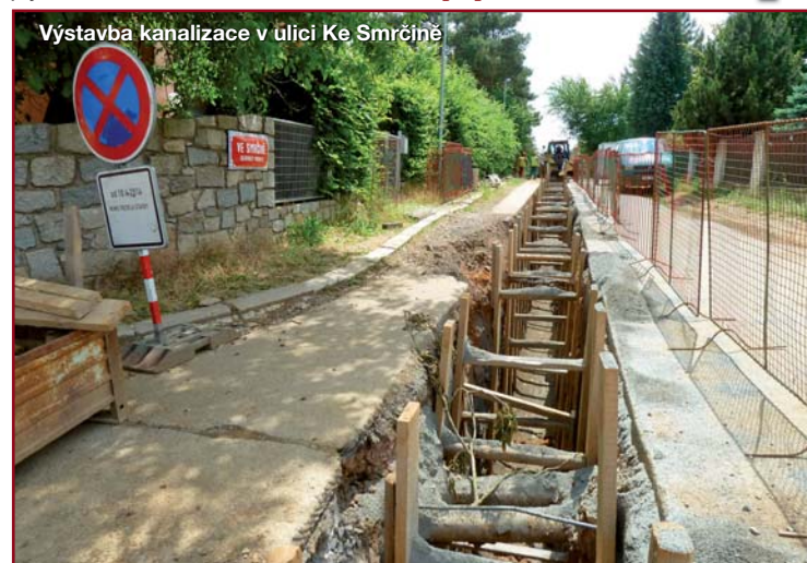
Výstavba kanalizace v ulici Ke Smrčíně