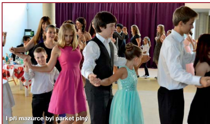
I při mazurce byl parket plný