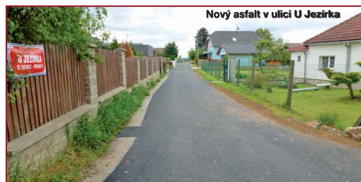
Nový asfalt v ulici U Jezírka