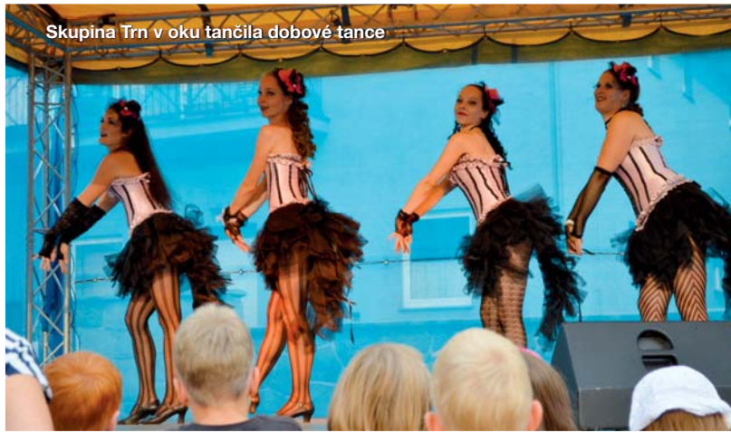
Skupina Trn v oku tančila dobové tance