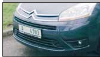
14 Pociť jako v malém ...