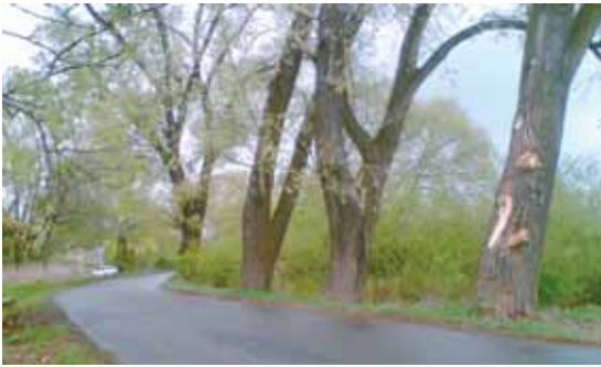
Poškozené a neošetřené stromy při kácení