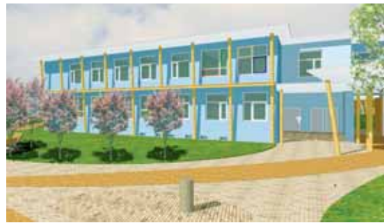
Vizualizace Správního pavilonu architektka Aleše Brotánka