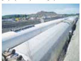
Lochkovský tunel – stav koncem dubna

Přírodní krásy Lochkova Národní přírodní památka Lochkovský profil – se nachází mezi Radotínem a Lochkovem. Nalézá se zde souboj mezinárodně významných geologických profilů a paleontologických nalezišť.