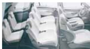
Pohled na sedm míst je povzbudivý

Poněkud zvláštním způsobem působí dvouramenný volant. Je sice velice příjemný do rukou, je na něm spousta užitečných tlačítek na ovládání radia, i další vymoženosti, ale přece jen zvyk na čtyřramenný volant je dosti silný, a tak se dvouramenný zdá trochu nezvyklý. Při jízdě po nerovnějším terénu, což je velká vět-