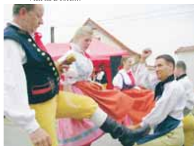
Loni v Letech

Program černošických májů a májí v Hlásné Třebani, které se konají tuto sobotu 9. května, jsme zveřejňovali v minulém čísle. Pokud by jste chtěli podniknout pěkný výlet, Staročeské máje se slaví i v Mníšku pod Brdy 16. května na náměstí a ve Všeradicích v prostranství u hospody 23. května. Více od organizátora – Naše noviny tel.: 724 135 824, frydl@dobnet.cz