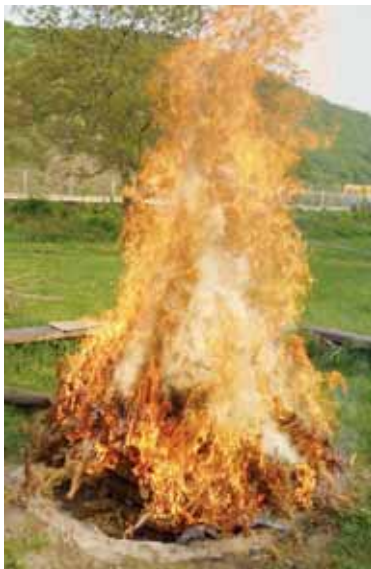
Vatra na Zbraslavi

VYSOKÝ ÚJEZD – Vraty míru mají na Újezdě dlouhou tradici. Pravda, od velkých a zdaleka viditelných hranic jsme se přesunuli k menším a menším, až letos proběhl ohnivý svátek v komorním duchu. U Sokolovny jsme vystavěli malou hranici a připravili hlavní hrdinku večera ze dřeva a slámy. „Já bych to podpálil hned. Bude přšet,“ ozvalo se mezi přítomnými. Optimisté doufali v zákras. Nestalo se. Během několika minut se zvedl silný vítr doprovázený intenzivním deštěm. Ten zahlal i děti ze hřiště zpátky k ohni. „To už lítají ty čarodějnice, mamí? Já se bojím.“bylo slyšet nejčastěji. Plameny z ohniště se natahovaly střídavě na jednu či druhou stranu. Zkrátka se našťásti počasí umoudřilo. Vítr téměř zcela utichl, dešť pomalu ustal. Rozhodli jsme se nejdříve naplnit žaludky šťavnatými buřtky opečenými nad