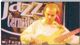
3 Jazz Černošice 2009

Bubovice, Černošice, Dobříš, Dobříšovice, Dolní Roblín, Drahelčice, Holyně, Hostim, Choteč, Chrástany, Chrutenice, Chýnice, Jilovistě, Jinočany, Karlík, Karlštejn, Kosoř, Kozolupy, Kuchař, Kuchařik, Lahovice, Lety, Lipence, Loděnice, Lochkov, Lužec, Malá Chuchle, Malé Přílepy, Mezouň, Mokropsy, Mořina, Mořinka, Nenačovice, Nučice, Ofech, Podkozi, Radotín, Roblín, Rovina, Rudná, Reporyje, Revnice, Slivence, Sobín, Solopisky, Srbsko, Tachlovice, Trněný Újezd, Tebonice, Třebotov, Velká Chuchle, Vonoklasy, Všenory, Vysoký Újezd, Zadní Kopanina, Zadní Třebáň, Zbraslav, Zbuzany, Zličín Shopping Malls, Železná