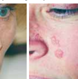
... ale ekzém na tváři nikoliv

V příštím vydání budeme pokračovat radami, jak omezit negativní vlivy slunečního záření.