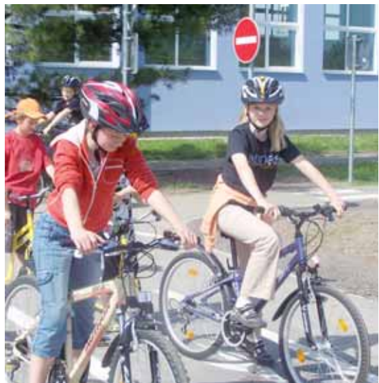
První návštěvníci dopravního hřiště v Radotíně

Jaký přínos má organizování takové akce pro Dolní Březany? VM: Jsem rád, že společnost takový cyklus přednášek pořádá. Jedná se určitě o pozitivní zviditelnění obce. Navíc přibližuje kvalitní přednášející podnikatelům a jednotlivcům z širšího okolí. Podle mně dostupných informací by měl jeden večer být věnován ochutnávce rakouských vín a specialit pod širým nebem, což je příležitost seznámit se s Rakouskem i z pohledu každodenního života. (red)