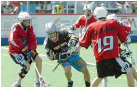
Memoriál Aleše Hřebeského, den 3.

ve spolupráci s prodejci alkoholických nápojů, kteří mají své prodejny ve vyhláskově konkretizovaných lokalitách.