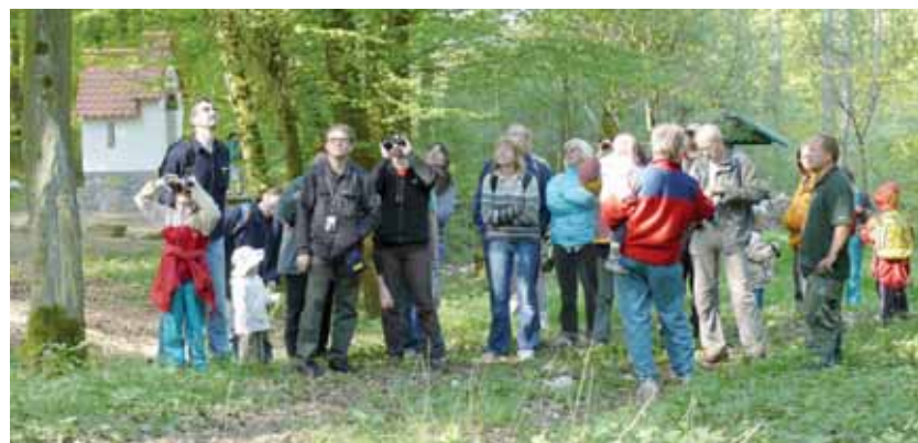
V pozadí kaplička sv. Antonína U tří habrů. V popředí účastníci „Vítání ptačího zpěvu“ sledují a poslouchají strážníka