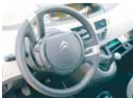
Dvouramenný volant je elegantní, plný tlačítek, ale...

Sedí se vám velice pohodlně, prostor pro nohy nejen řidiče, ale i spolujezdců na všech sedadlech je plně dostačující i pro vzrostlejší postavy, navíc si pochopitelně můžete sedadla upravovat podle libosti, a to nejen výšku, ale i sklon opěradla. Radič páka je umístěna výš, přímo jakoby pod palubní desku, takže ji nemusíte dlouho hledat a natahovat ruku. Razační je poněkud toporné, ale při dobré vůli se na tuto drobnou chybu dá rychle zvyknout. Sešlápnutím plynu a přidáním otáček se automaticky uvolní systém brzdových asistentů, kteří nahrazují ruční brzdu. Také je nutné si na tuto skutečnost zvyknout. Když totiž zastavíte, brzdový asistent okamžitě začne účinkovat. Uvolní se, až když se rozjídáte, jak jsme už popsali.