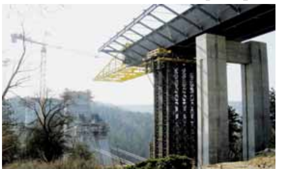
Most přes Lochkovské údolí

prokročování ze str. 1 Lochkovský tunel Tunel, který následuje za mostem bude dlouhý více než 1,6 km, začíná portálem Lochkov a končí portálem Radotín. Skládá se ze dvou tubusů, v pravém (stoupajícím) tubusu jsou tři jízdni pruhy, v levém (klesajícím) dva jízdni pruhy. Tunel bude téměř po celé délce ražený, úseky u portálů budou hloubené. Za tunelem pokračuje trasa mostním objektem výběžek Slavčického údolí. Vlastní stavbě tunelu předchází razba 1313 m dlouhých průzkumných stoly. Důvodem její stavby je zpsnění podrobného inženýrsko-geologického průzkumu. Auta by tudy měla projíždět od května roku 2010. Stavba se o několik měsíců protáhla, opět kvůli geologickým potížím. Jeden metr tunelu včetně vybavení pak podle projektového manažera Zdražily stojí necelý milion korun. Tubusy na Slivenecké straně budou zahrnuty zeminou, kromě větráčního otvoru. Celý tunel pak tvoří obklop. Mezi oběma tunely bude sedm spojek, které v případě nehody umožní příjezd napřík záchraných vozů do druhého směru.