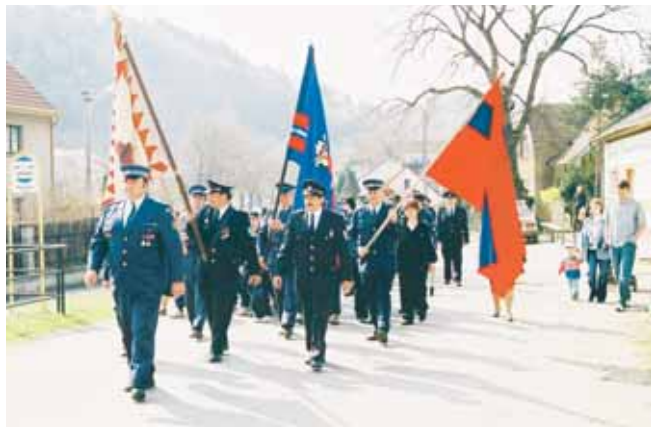
Oslava 100. výročí svého založení