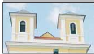
11 Hrubou nebo ...