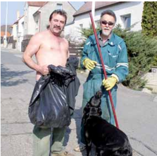
Brigádníci v ulici k Homolce