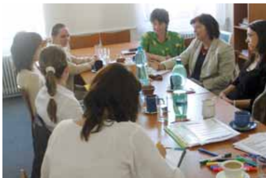
Beseda "Spolu u kulatého stolu" na téma „Jak prohloubit vzájemnou a pravidelnou spolupráci?“ v prostorách radnice

né spolupráce, na které se při první besedě nedostalo. Kontakt na Pexeso: 724018708;