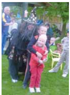
Naše hodná čarodějnice