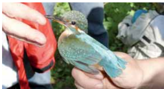
Samička loděnického ledňáčka v krátkodobém zajetí