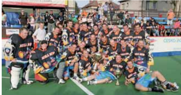
Memoriál Aleše Hřebekého 2009, LCC Radotín; foto Matěj Feszaniec