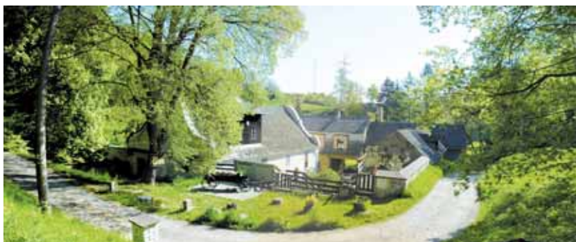
Veselých mlýn v Chotči

Purkrabí rozkázal, aby přivedli pasáčkovi dva koně a na jednoho naložili dva pytle oslešeného hrachu. Mladíka mu bylo líto, neboť ho už viděl rozspápaného mezi karlštejnskými skala-