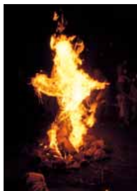
Tato čarodějnice z Vysokého Újezda to má již za sebou.