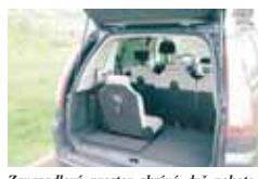
Zavazadlový prostor skrývá dvě pohotivostní sedadla, jedno už je rozložené