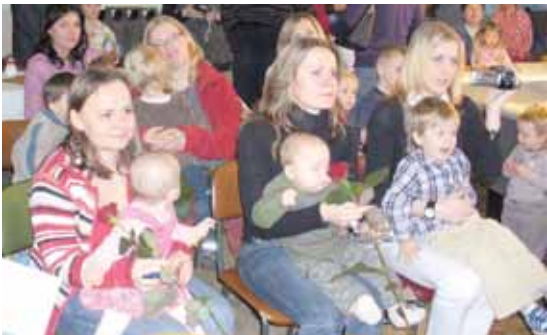
Vítání občánků v Hostinci u Barchánků