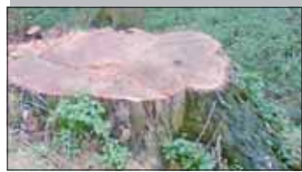
13 Péče o veřejnou ...