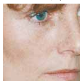
Píhy jsou šušivé a prý i moderní ...

obdobně nazývají solární keratózy a neléčené mohou vést ke vzniku spinaliomu. Sluneční záření však může škodit i tím, že vyvolává svě-