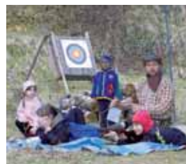
Stříleli jsme ze vzduchovky a luku