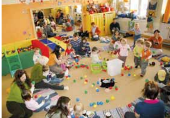
Mateřské centrum Pexeso

přírodovědce se svými živými svěřenci, rodiče, krtonožkující s dětmi v pískovišti, anebo trnujícími dovednosti mrňouši na hřišti. Byli bychom rádi, kdyby spříznění, dosavadní klienti i budoucí návštěvníci Pexesa měli možnost vnímat nový prostor jako své zázemi.