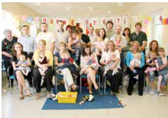
Jedna skupina občánků s rodinnými příslušníky ve Slivenci