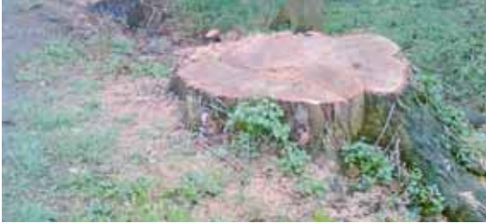
Pařez, který vypovídá o stáří stromu, zachycen 30. 3.