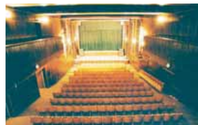
Doufejme, že sál nezůstane opuštěn