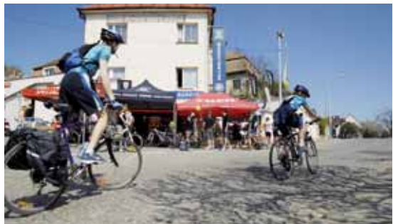
Dubnový testovací víkend před Ski a Bike Centru Radotín

RADOTÍN – Již za několik málo dní se bude mít cyklistická veřejnost opět možnost zúčastnit testování horských kol v pražském Radotíně. V rámci čtvrtého ročníku testovacího víkendu Ski a Bike Centru Radotín představuje a zdarma zapůjčuje cyklistům žhavé novinky z nabídky horských kol legendárních amerických značek Specialized, Trek, Gary Fisher a Kona.