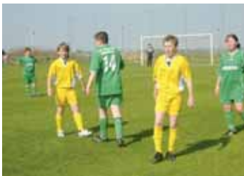
Z utkání starších žáků Vysoký Újezd - Neumětels