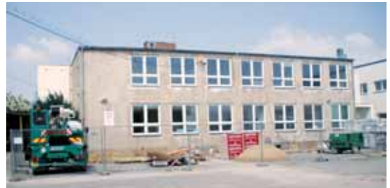
Současný stav, před 3 týdny začala rekonstrukce