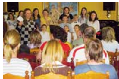
Celkem 23 mladých interpretů zahrálo či zazpívalo vybrané skladby