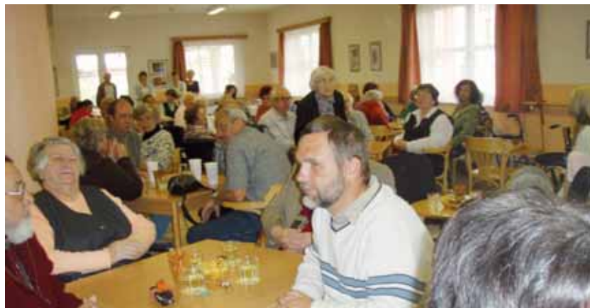
Oslava 6. výročí otevření Domova seniorů Rudná