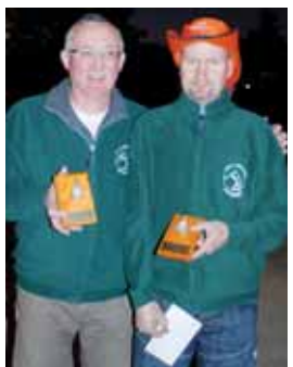
Vítězové z Holandska