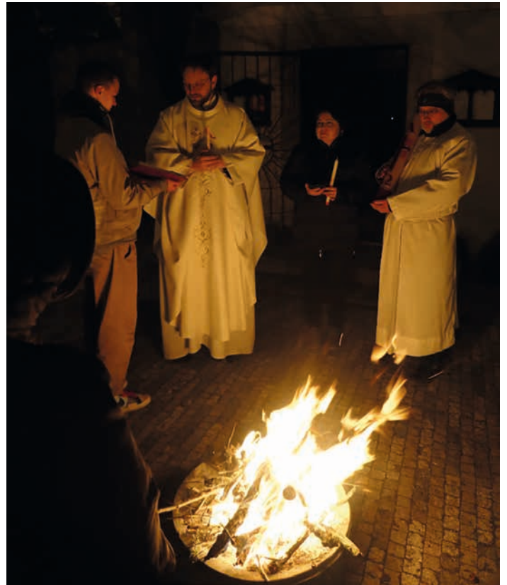
Vigilie na Bílou sobotu 8. 4.

li poslední večeři Páně s ustanovením eucharistie. Na Velký pátek se bylo možné připojit k odpolední venkovní pobožnosti Křížové cesty. Také velkopáteční obřady při mši svaté připomínaly Kristovo ukřižování. Během dne Bílé soboty byl kostel otevřen k osobním adoracím u Božího hrobu. O vigilií Bílé noci byl nejprve posvěcen oheň a paškál – velikonoční svíce symbolizující vzkříšeného Krista. Rozsvícený paškál vnesený do ztemnělého kostela symbolizuje světlo Kristovo přemáhající temnotu hříchu a smrti. Dále následovala mše svatá, kterou začaly oslavy Velikonoc. Při odpolední mši svaté o neděli Zmrtvýchvstání byly také tradičně požehnány pokrmy na velikonoční stůl.