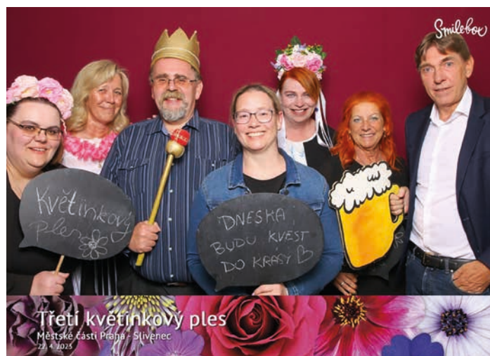
Třetí květinový ples